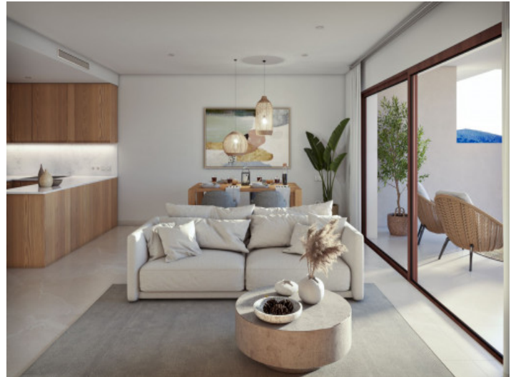
Sala con terraza