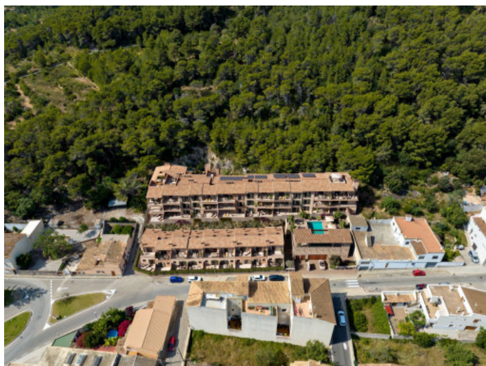
Complejo vista exterior