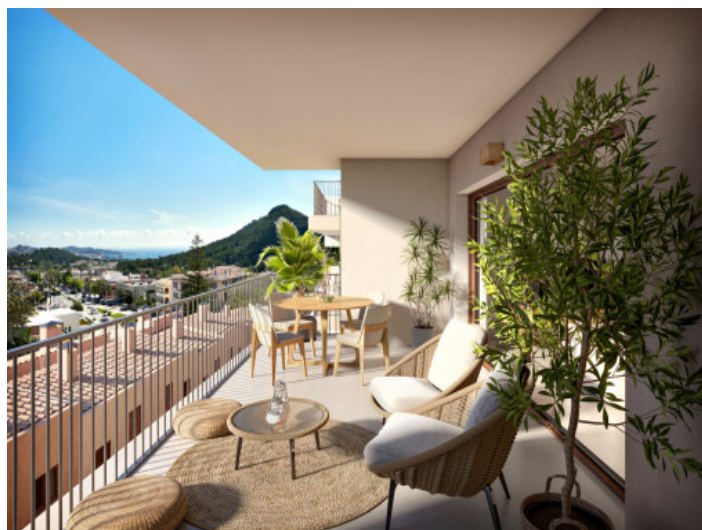
Terraza con vista de mar

Toda la información como mejor se puede saber, salvo por error durante el periodo de venta. Sirva este documento como un informe previo, las bases legales solo serán válidas a través de un contrato de compra acordado ante Notario.