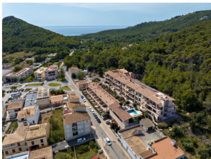
Ubicacion de complejo