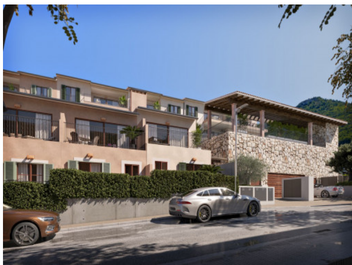
Entrada de complejo