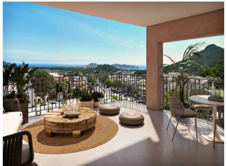
Terraza con vista de mar