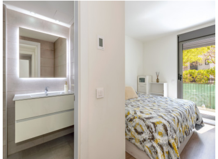
Habitación en suite