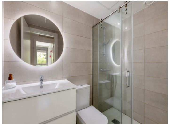
Cuarto de baño 2

Toda la información como mejor se puede saber, salvo por error durante el periodo de venta. Sirva este documento como un informe previo, las bases legales solo serán válidas a través de un contrato de compra acordado ante Notario.