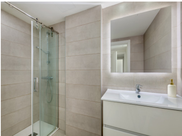
Cuarto de baño 1