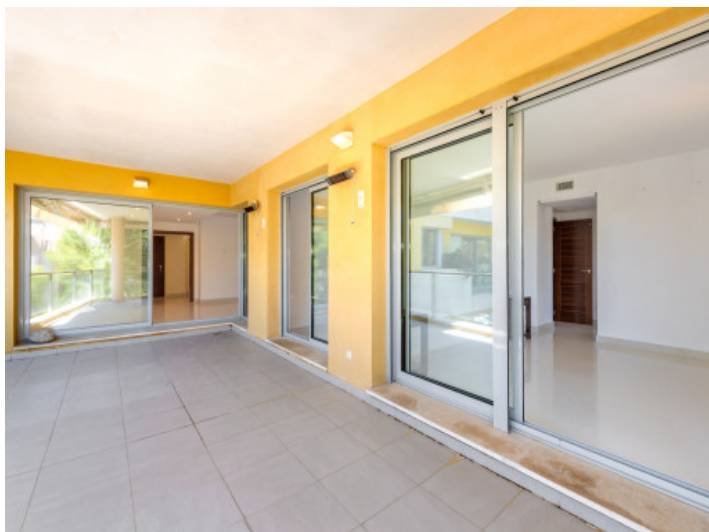
Terraza cubierta en la planta principal