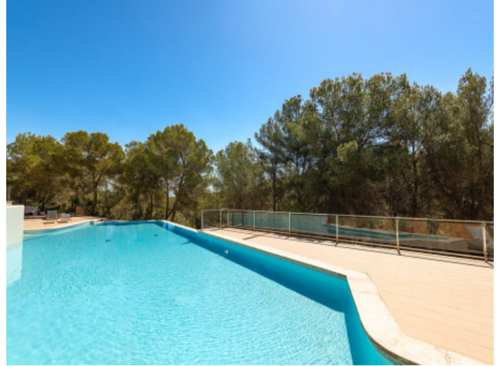
Preciosa zona de piscina