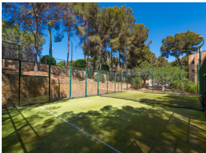
Pista de pádel