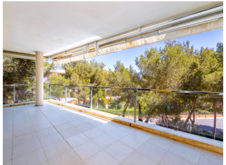
Terraza cubierta en la planta principal

Toda la información como mejor se puede saber, salvo por error durante el periodo de venta. Sirva este documento como un informe previo, las bases legales solo serán validas a traves de un contrato de compra acordado ante Notario.