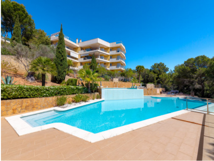
Preciosa zona de piscina