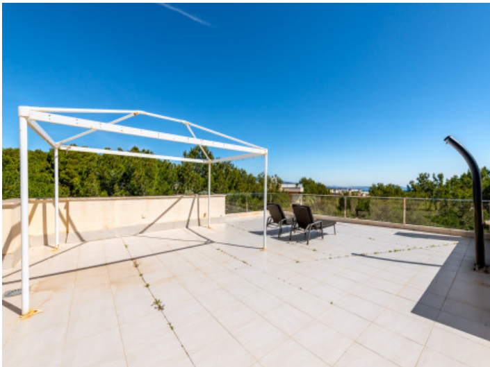
Gran terraza en la azotea