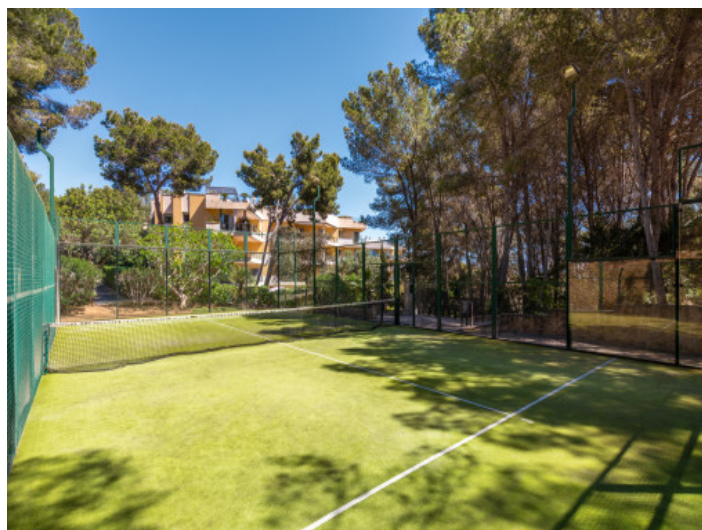
Pista de pádel

Toda la información como mejor se puede saber, salvo por error durante el periodo de venta. Sirva este documento como un informe previo, las bases legales solo serán válidas a través de un contrato de compra acordado ante Notario.