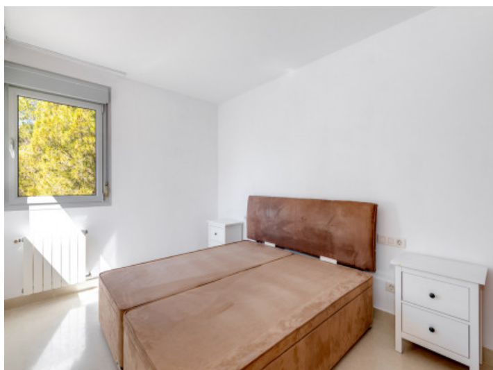
Uno de los 4 dormitorios