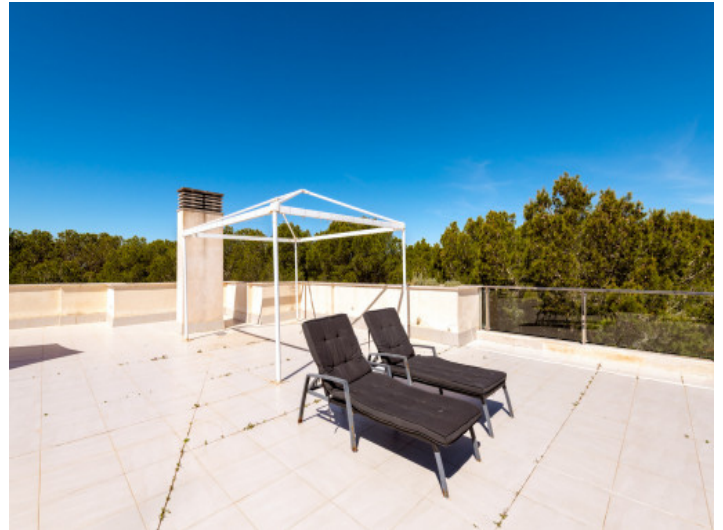
Gran terraza en la azotea