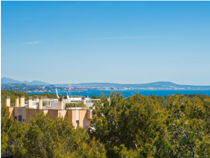
Vistas parciales al mar desde la terraza en la azotea