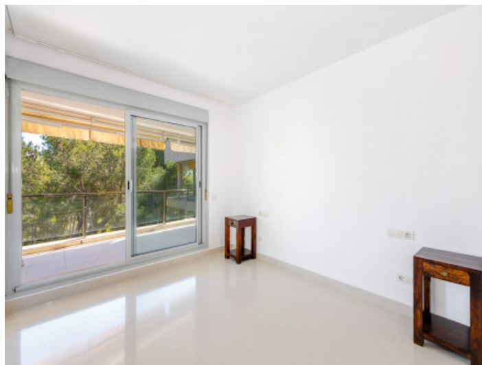
Uno de los 4 dormitorios