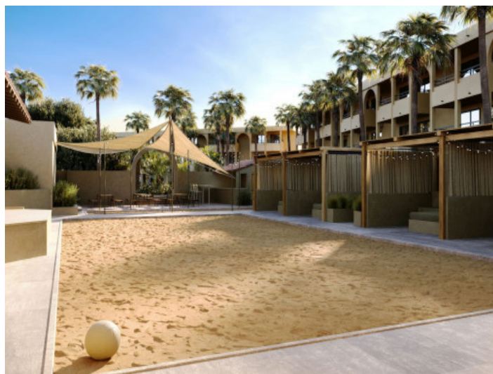
Cancha de voleibol

Toda la información como mejor se puede saber, salvo por error durante el periodo de venta. Sirva este documento como un informe previo, las bases legales solo serán válidas a través de un contrato de compra acordado ante Notario.