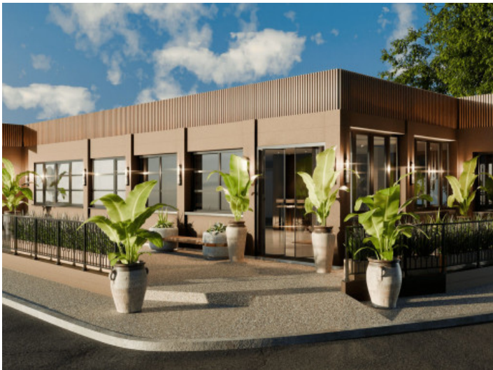
Edificio de recepción