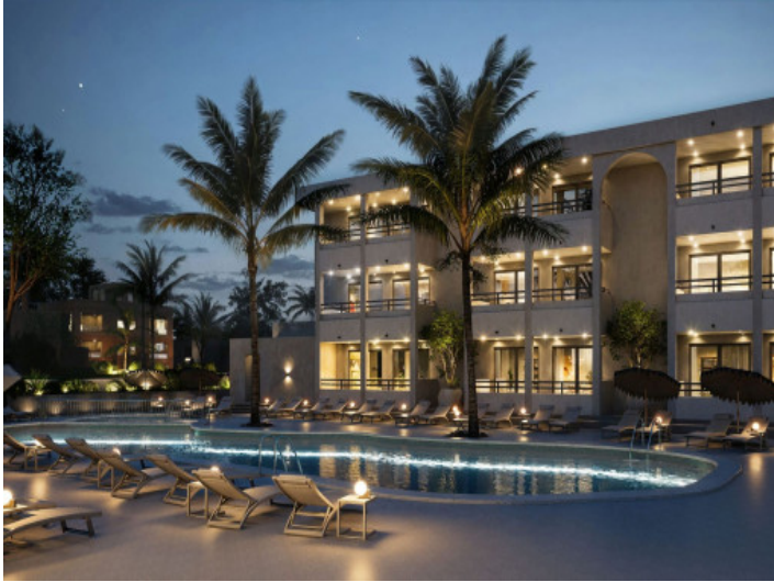
Atractiva propiedad de inversión en ubicación privilegiada