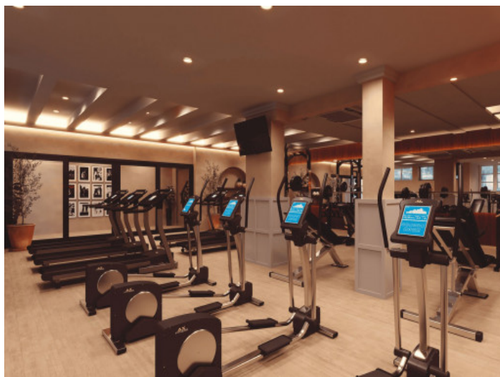
Sala de fitness