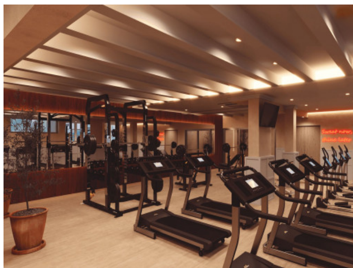
Sala de fitness