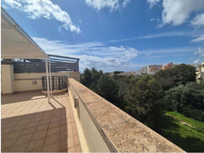
Apartamiento en Bonanova con terraza de azotea