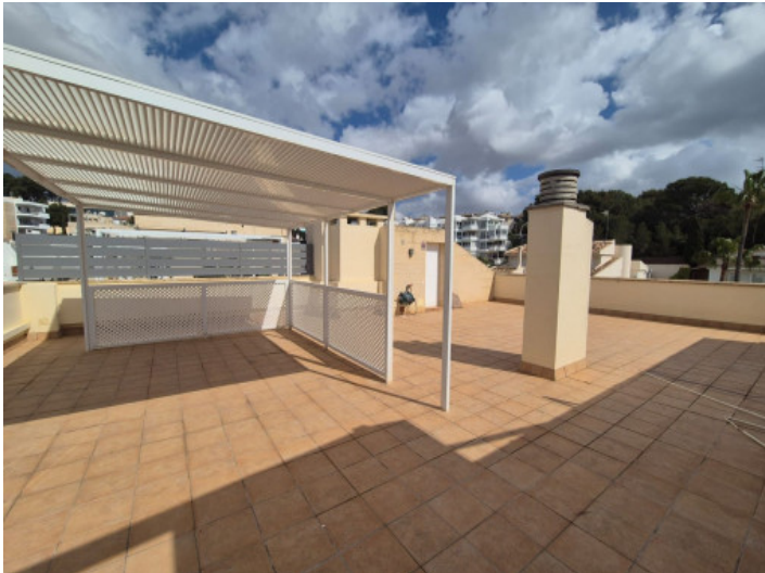
Azotea privada con pergola