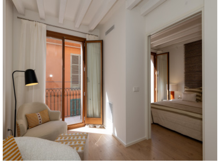
Zona de estar