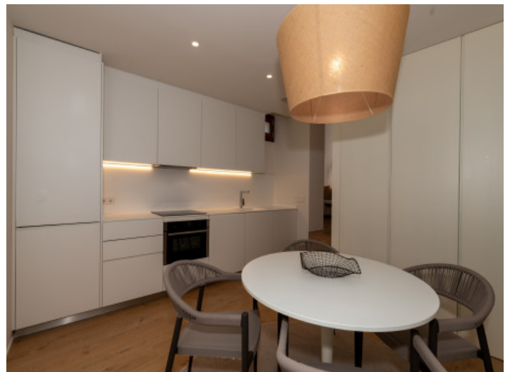
Cocina con zona para comer

Toda la información como mejor se puede saber, salvo por error durante el periodo de venta. Sirva este documento como un informe previo, las bases legales solo serán válidas a través de un contrato de compra acordado ante Notario.