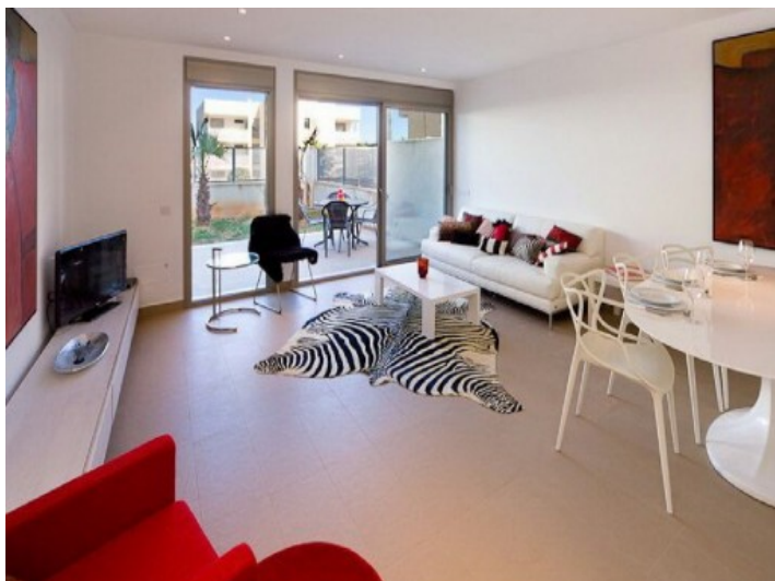
Salón-comedor con acceso al jardín