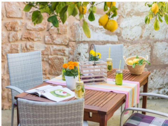
Patio con jardín