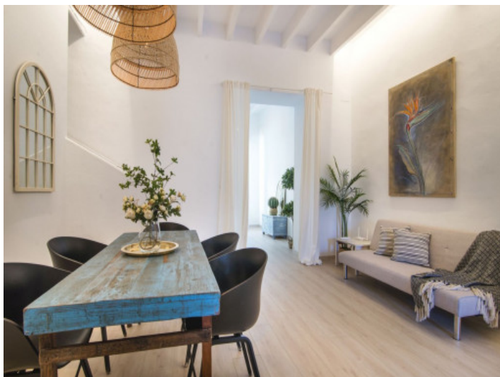
Zona comedor y estar