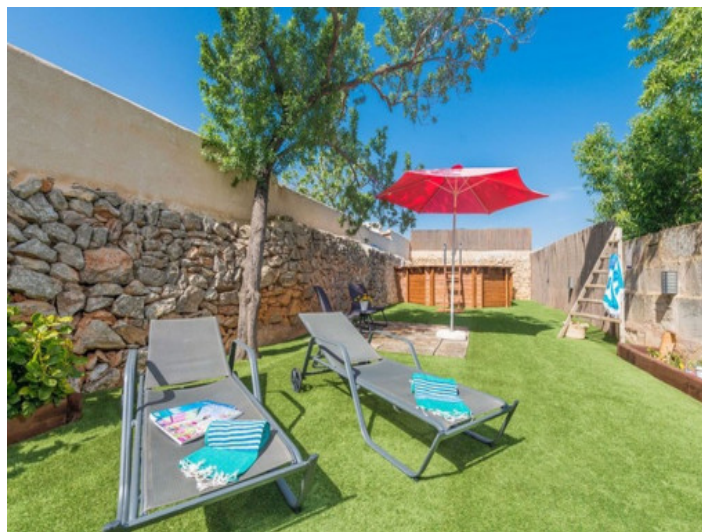
jardín con Piscina

Toda la información como mejor se puede saber, salvo por error durante el periodo de venta. Sirva este documento como un informe previo, las bases legales solo serán válidas a través de un contrato de compra acordado ante Notario.