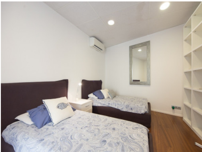
Amplio dormitorio doble