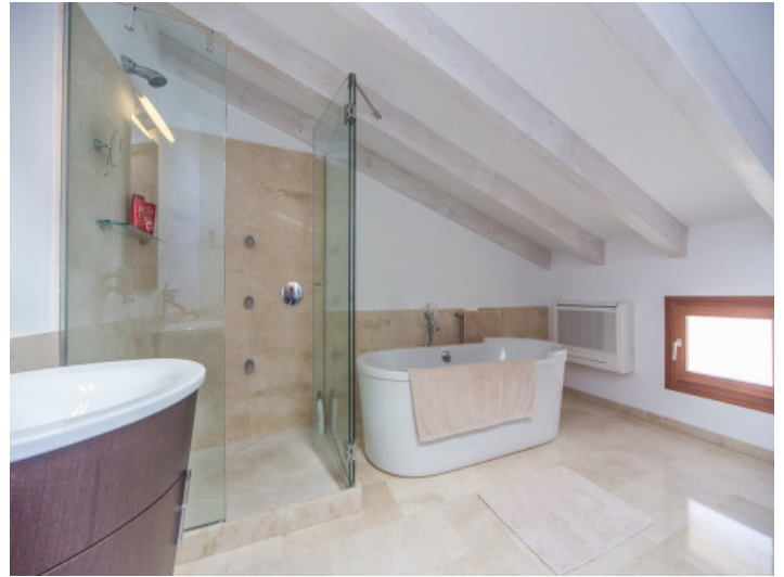
Baño principal con bañera y ducha