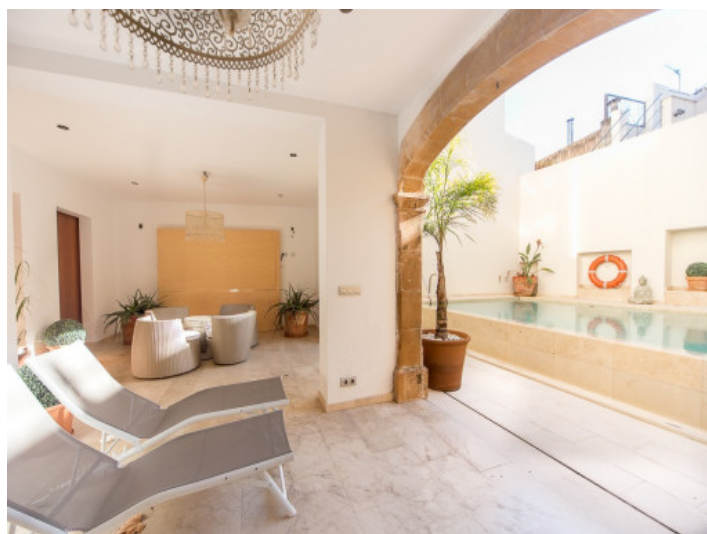
Terraza cubierta con zona de estar