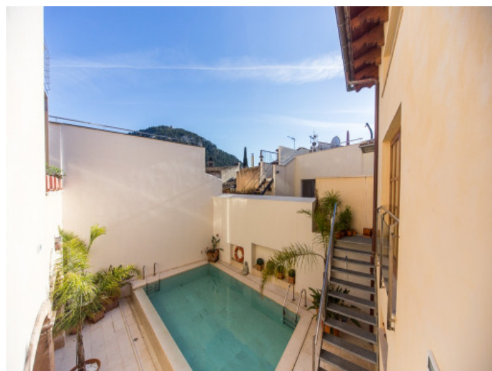
Vistas a la piscina