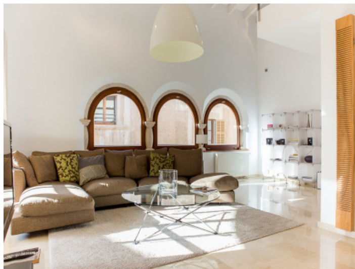
Vista alternativa del salón