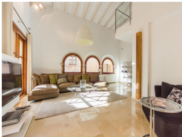
Acogedora zona de estar