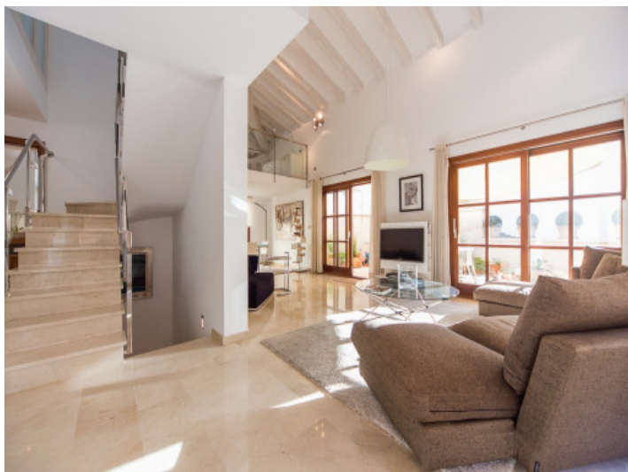
Salón abierto y espacioso