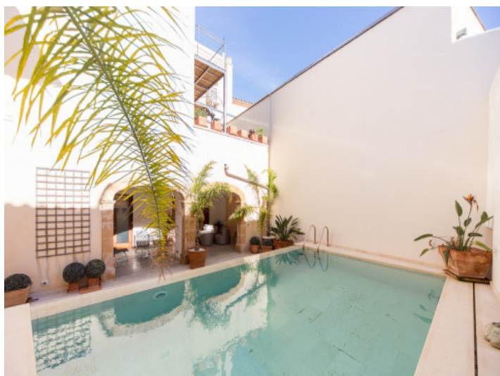
Patio de ensueño con piscina