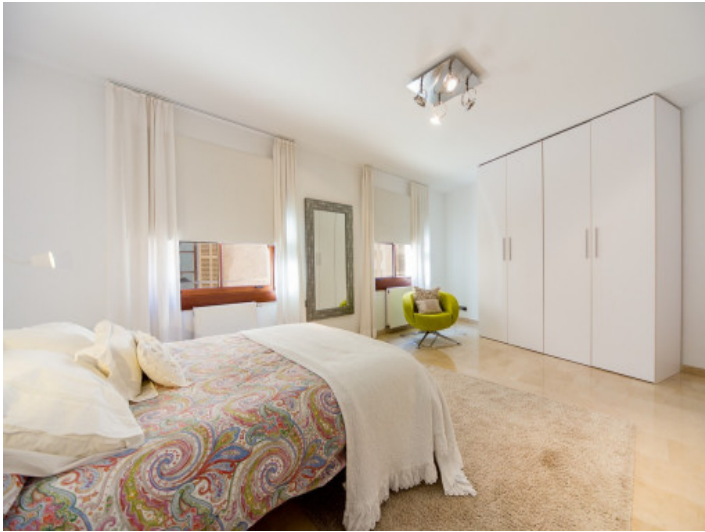
Muy espacioso y bonito dormitorio principal