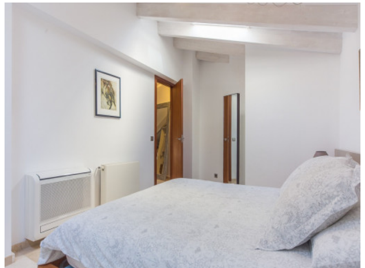
Uno de tres dormitorios