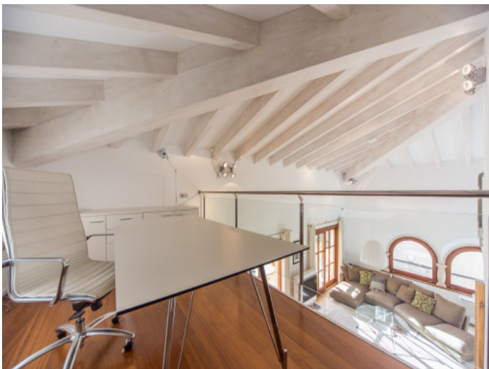
Perfecta zona de oficina