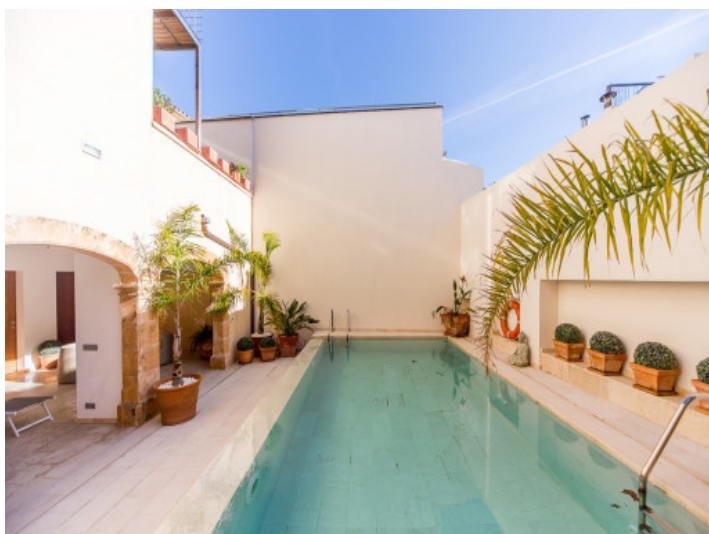
Preciosa zona de piscina, rodeada de terrazas