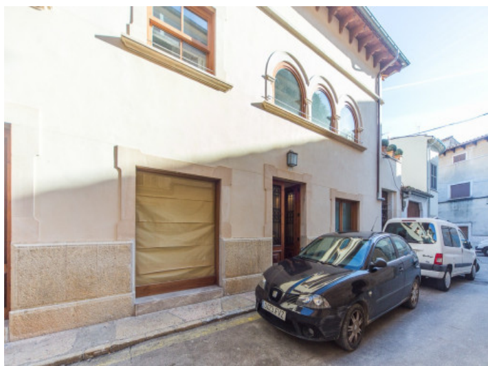
Vista exterior de la casa

Toda la información como mejor se puede saber, salvo por error durante el periodo de venta. Sirva este documento como un informe previo, las bases legales solo serán válidas a través de un contrato de compra acordado ante Notario.