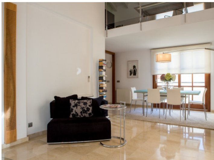
Entrada al salón