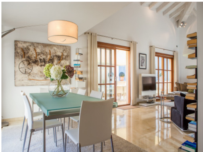
Comedor al lado del salón