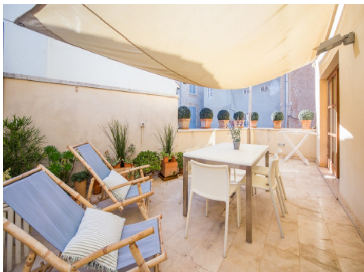
Fantástica zona de estar en la terraza