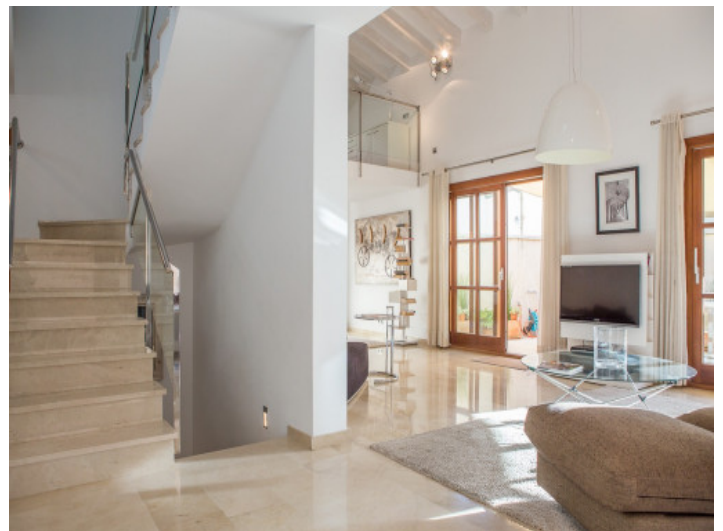
Acceso a la planta superior

Toda la información como mejor se puede saber, salvo por error durante el periodo de venta. Sirva este documento como un informe previo, las bases legales solo serán válidas a través de un contrato de compra acordado ante Notario.