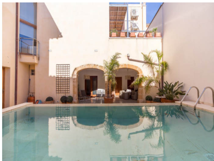
Propiedad exclusiva con piscina

Toda la información como mejor se puede saber, salvo por error durante el periodo de venta. Sirva este documento como un informe previo, las bases legales solo serán válidas a través de un contrato de compra acordado ante Notario.