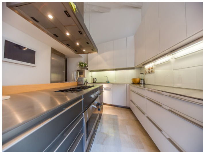
Cocina completamente equipada

Toda la información como mejor se puede saber, salvo por error durante el periodo de venta. Sirva este documento como un informe previo, las bases legales solo serán validas a traves de un contrato de compra acordado ante Notario.