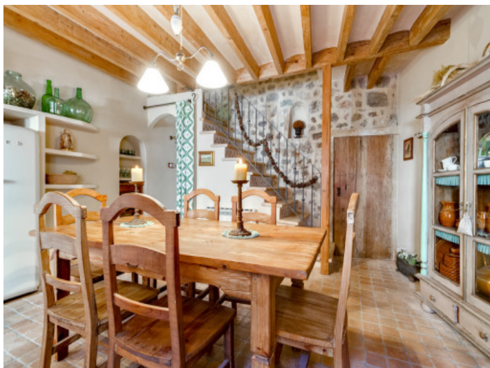
Vista alternativa del comedor con elementos de madera