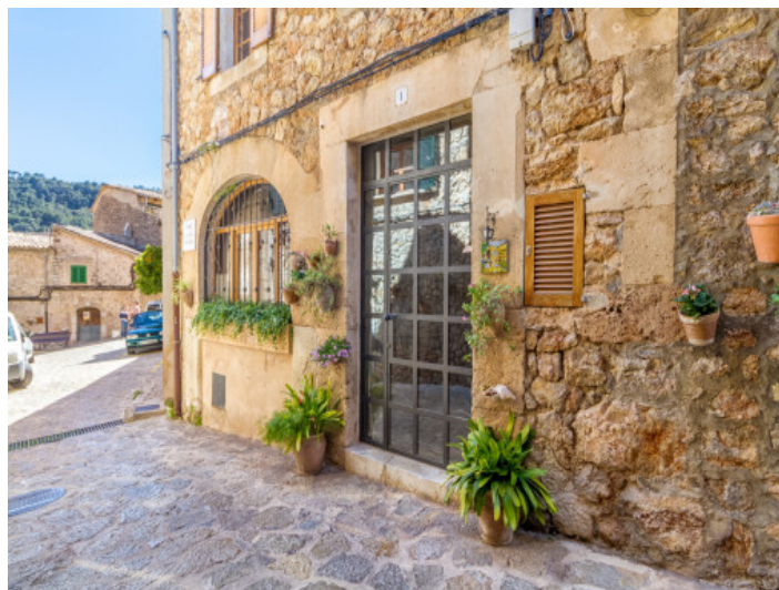
Vista exterior de la casa de pueblo