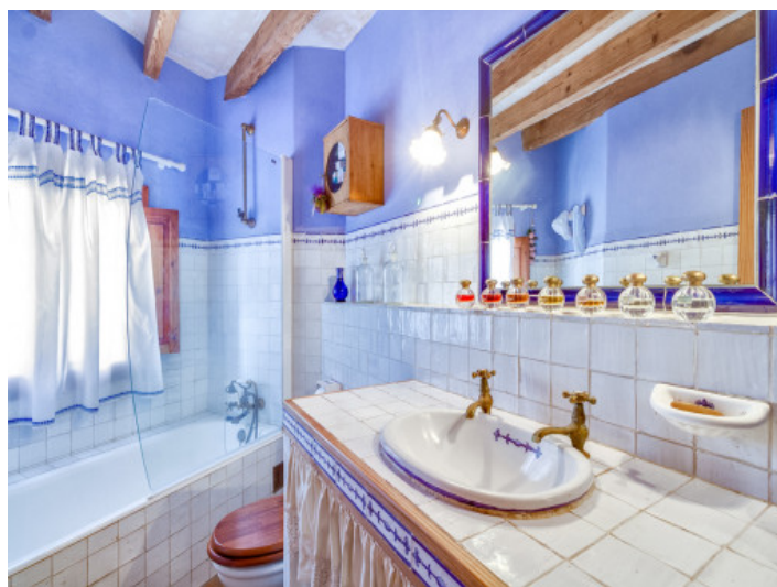
Hermoso baño con bañera