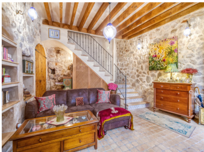
Vista alternativa de del área de estar