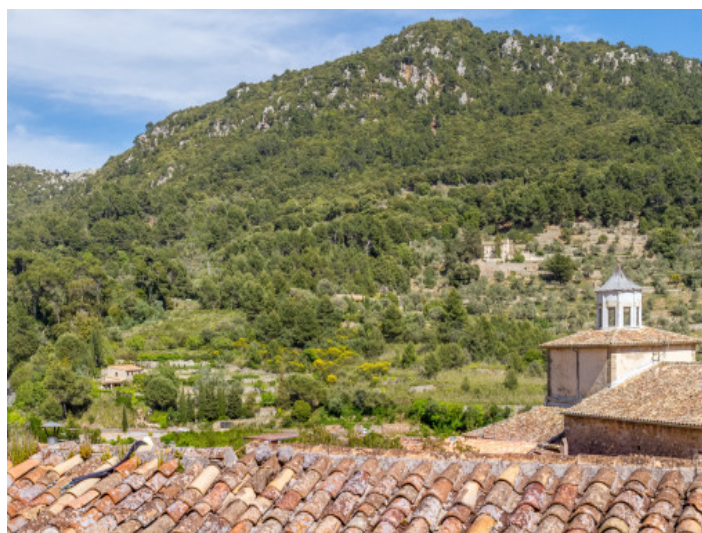
Vistas panorámicas de la montaña