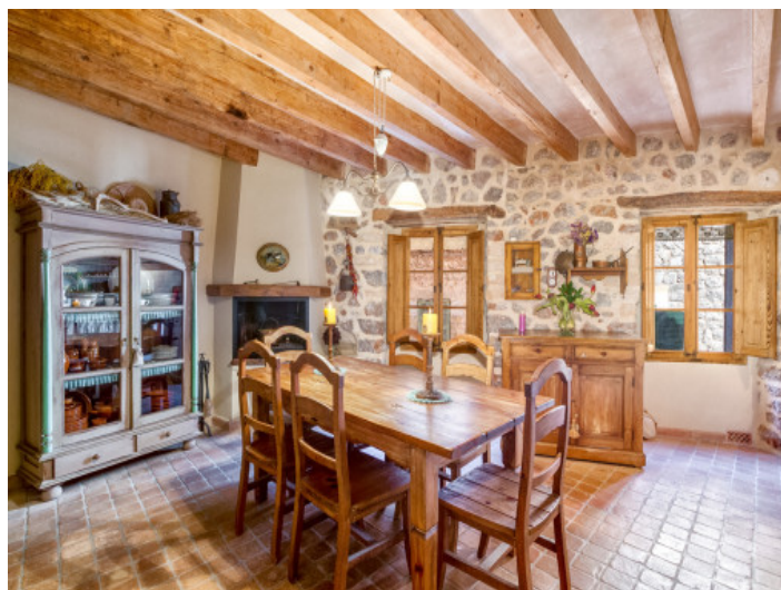
Auténtico comedor con chimenea y paredes de piedra

Toda la información como mejor se puede saber, salvo por error durante el periodo de venta. Sirva este documento como un informe previo, las bases legales solo serán válidas a través de un contrato de compra acordado ante Notario.