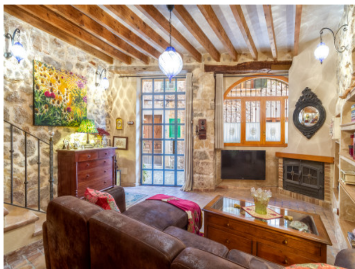
El área de estar ofrece una agradable chimenea