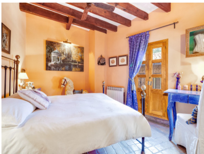
Maravilloso dormitorio con cama doble