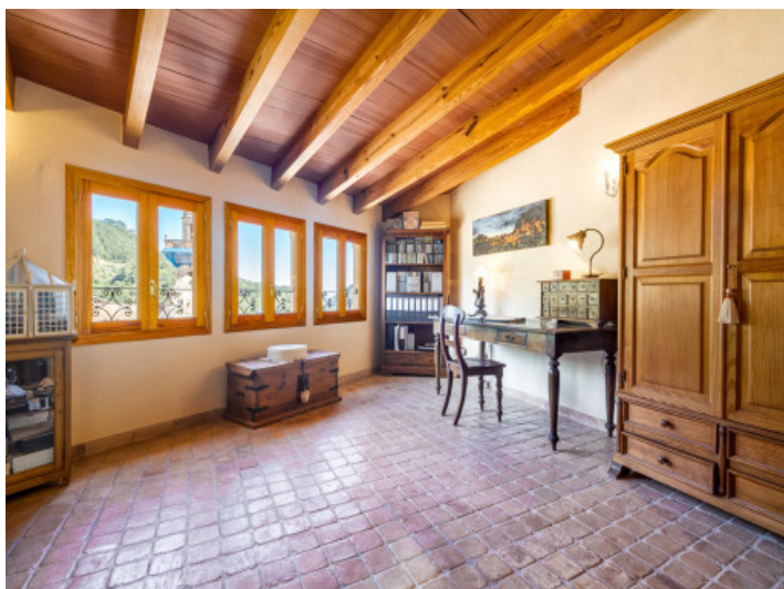
Único despacho con elementos de madera e inclinación del tejado