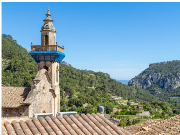
Vistas de la torre de la iglesia