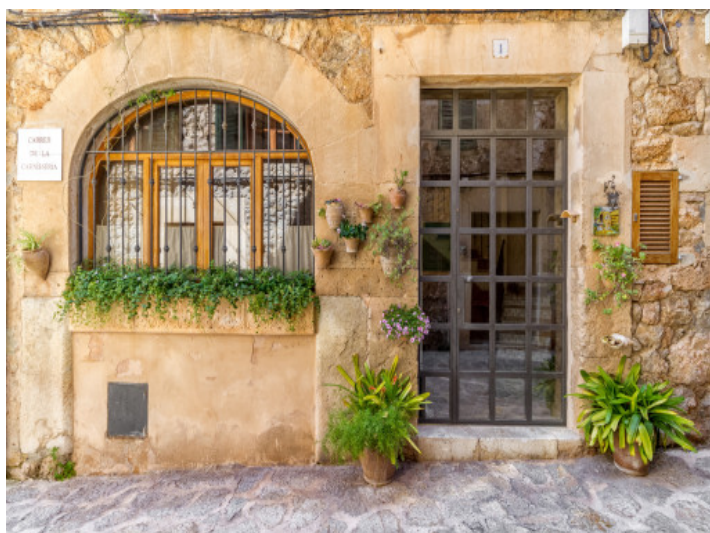
Entrada atractiva de la casa de pueblo