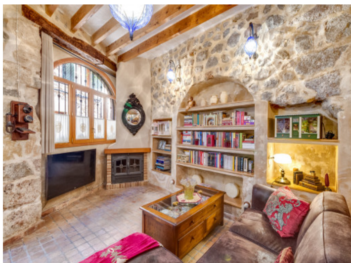
Espacioso área de estar con vigas de madera