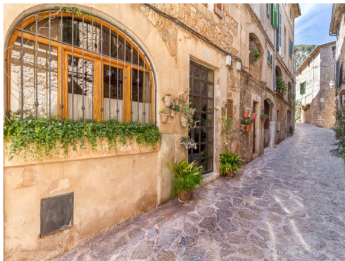
Encantadora casa de pueblo en Valldemossa