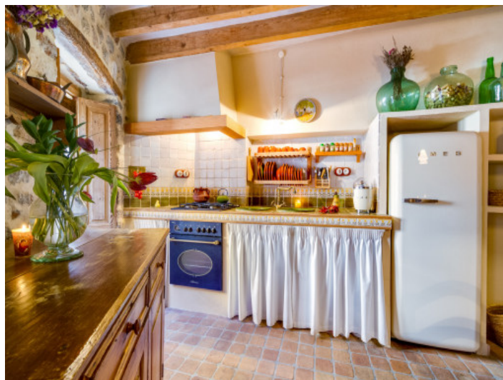
Tradicional cocina al estilo mallorquín