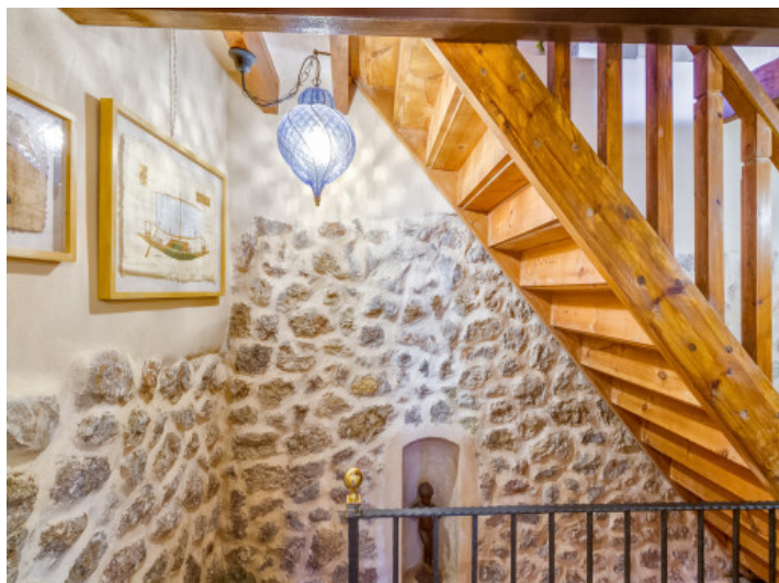
Vistas de las escaleras y de las paredes de piedra