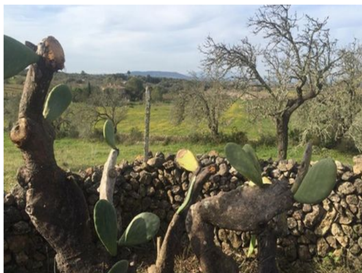
Vista a los alrededores