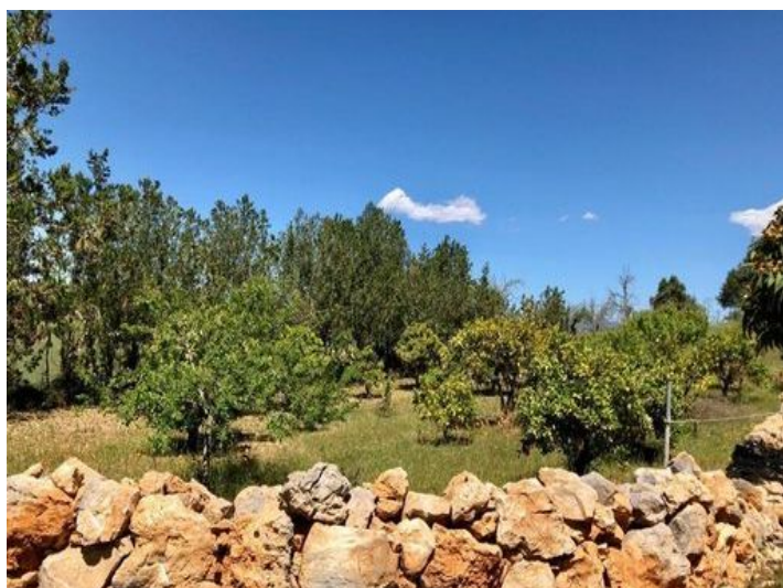
Vista a los alrededores