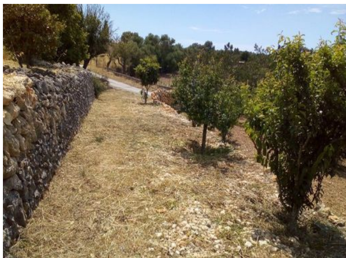
Vista a los alrededores