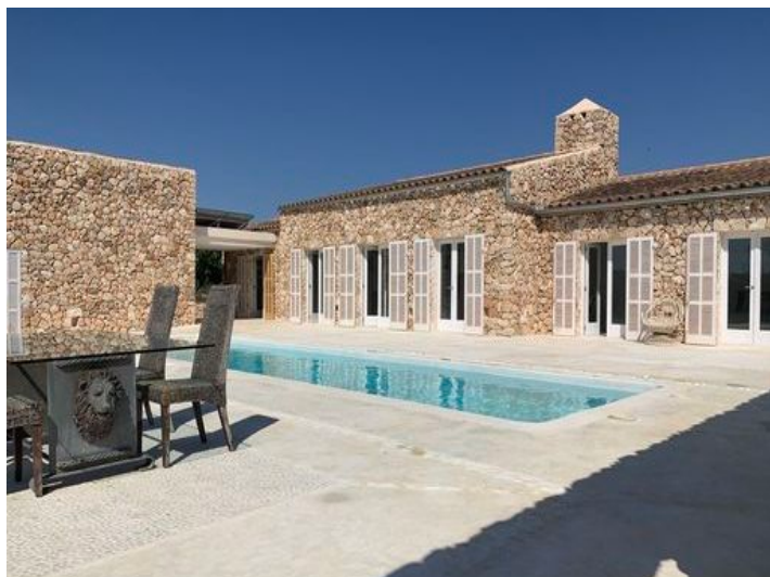
Zona de la piscina soleada