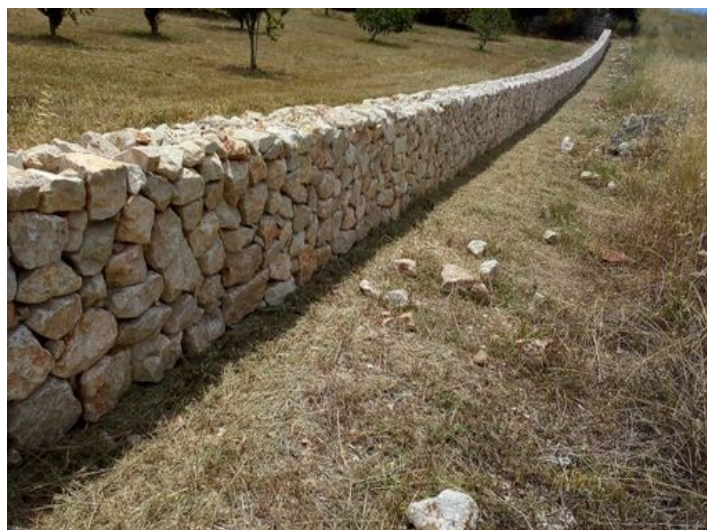
Vista a los alrededores

Toda la información como mejor se puede saber, salvo por error durante el periodo de venta. Sirva este documento como un informe previo, las bases legales solo serán válidas a través de un contrato de compra acordado ante Notario.