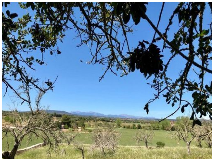
Vista a los alrededores