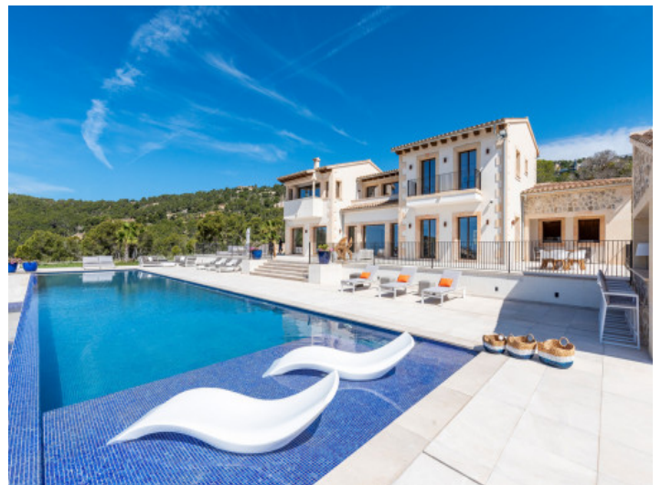
Vista alternativa a la villa

Toda la información como mejor se puede saber, salvo por error durante el periodo de venta. Sirva este documento como un informe previo, las bases legales solo serán válidas a través de un contrato de compra acordado ante Notario.