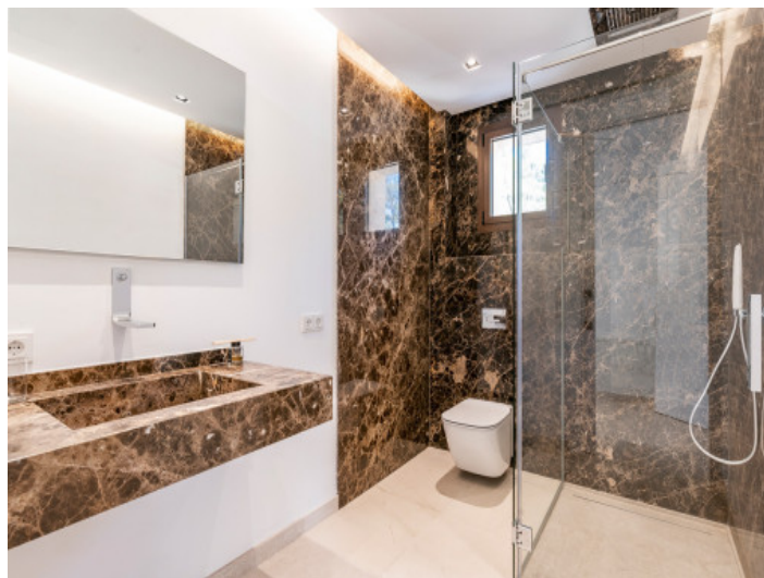
Baño con ducha