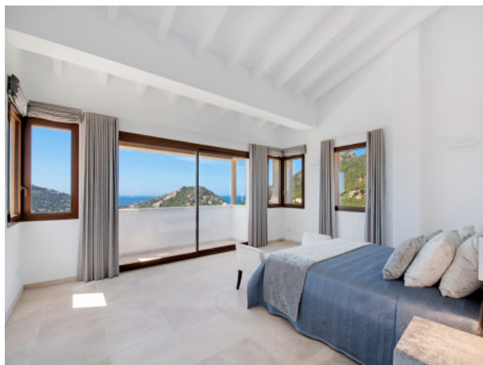
Suite grande con baño en suite

Toda la información como mejor se puede saber, salvo por error durante el periodo de venta. Sirva este documento como un informe previo, las bases legales solo serán válidas a través de un contrato de compra acordado ante Notario.