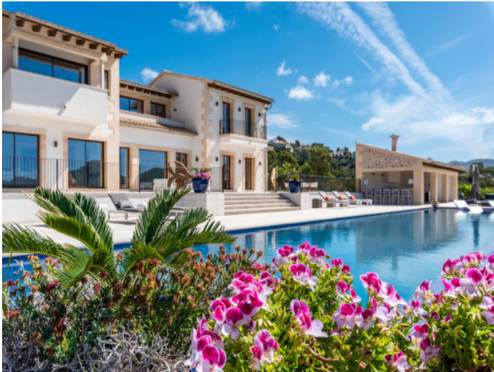
Zona de la piscina soleada