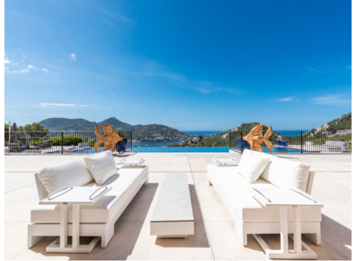
Zona de chill out en la piscina