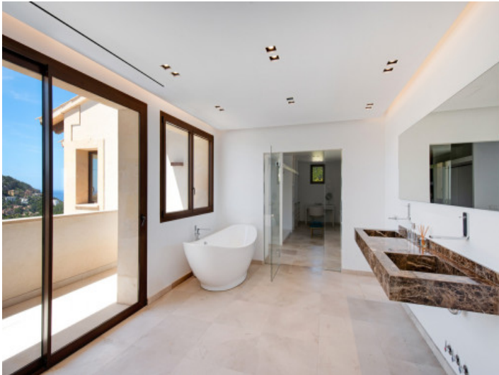
Vista alternativa al baño