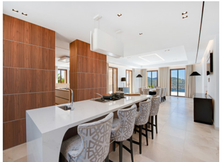
Cocina totalmente equipada

Toda la información como mejor se puede saber, salvo por error durante el periodo de venta. Sirva este documento como un informe previo, las bases legales solo serán válidas a través de un contrato de compra acordado ante Notario.