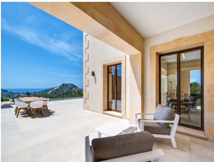
Zona de estar separada