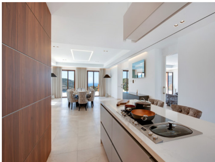
Cocina con isla central