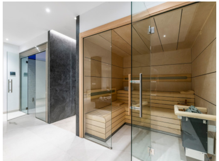
Vista a la sauna