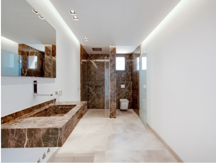
Baño con ducha