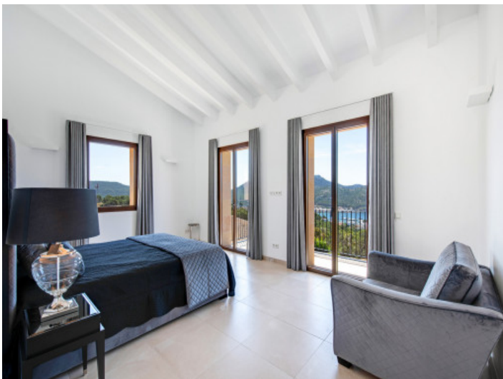
Otro dormitorio grande