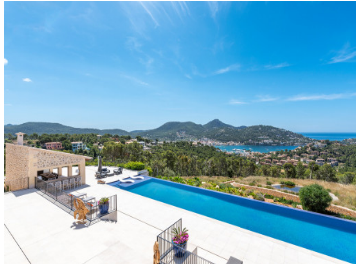
Vista a la terraza