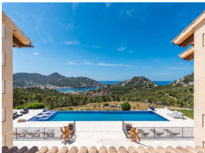
Vista a la piscina