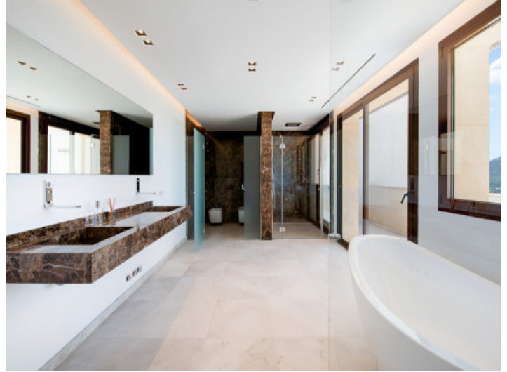
Baño en suite con ducha y bañera