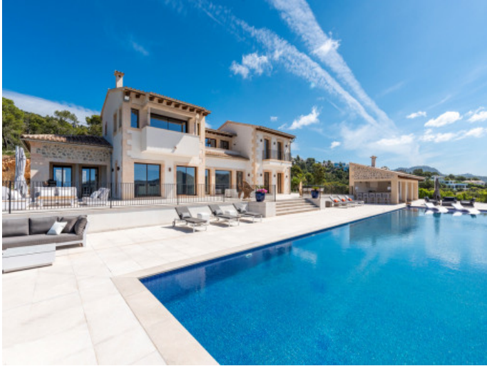
Vista exterior y piscina