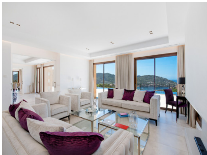
Sala de estar separada