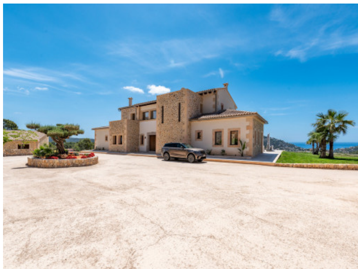
Vista exterior de la villa