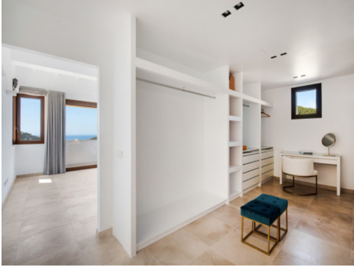
Vestidor del dormitorio