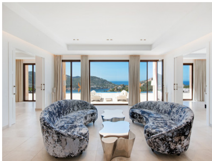
Salón luminoso con acceso a la terraza