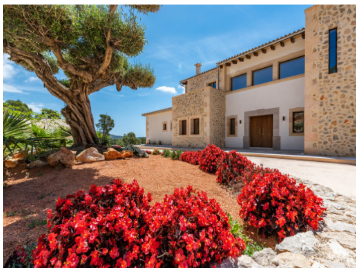
Vista alternativa a la villa

Toda la información como mejor se puede saber, salvo por error durante el periodo de venta. Sirva este documento como un informe previo, las bases legales solo serán válidas a través de un contrato de compra acordado ante Notario.