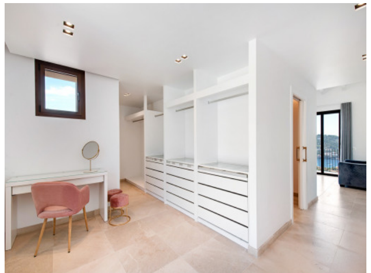
Vestidor del dormitorio

Toda la información como mejor se puede saber, salvo por error durante el periodo de venta. Sirva este documento como un informe previo, las bases legales solo serán válidas a través de un contrato de compra acordado ante Notario.