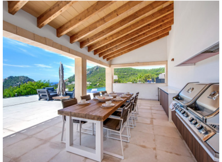
Cocina exterior cubierta