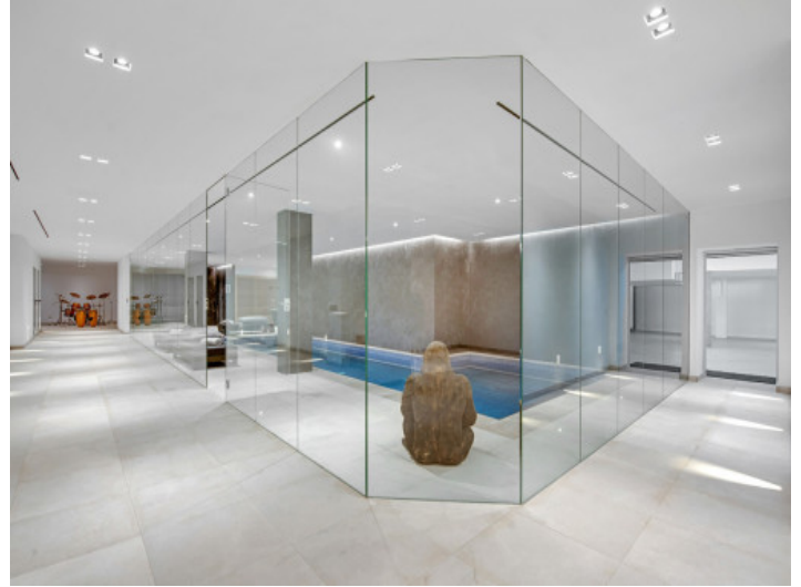
Spa y sauna y acceso al garaje