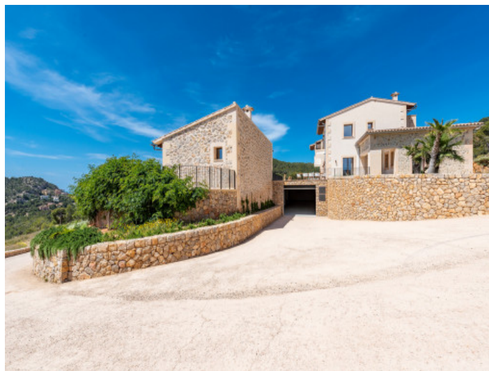
Acceso al garaje