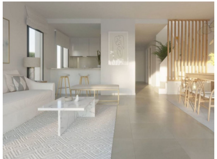
Vista alternativa al salón