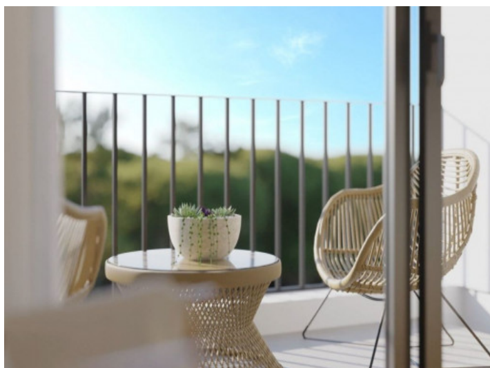
Vista al balcón