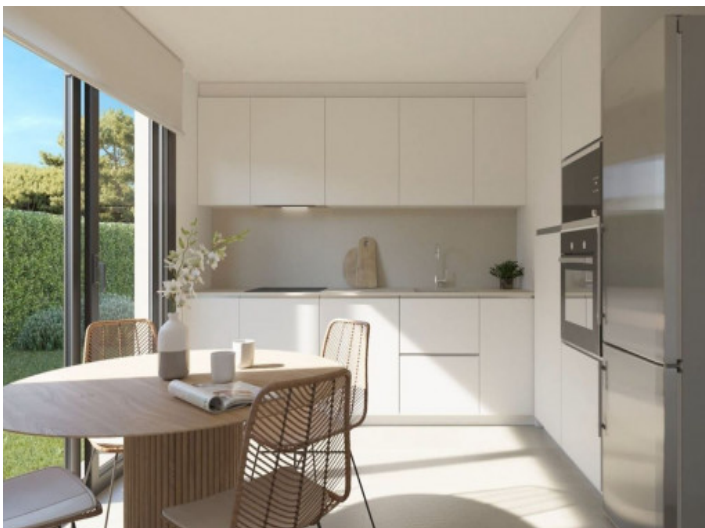
Cocina totalmente equipada