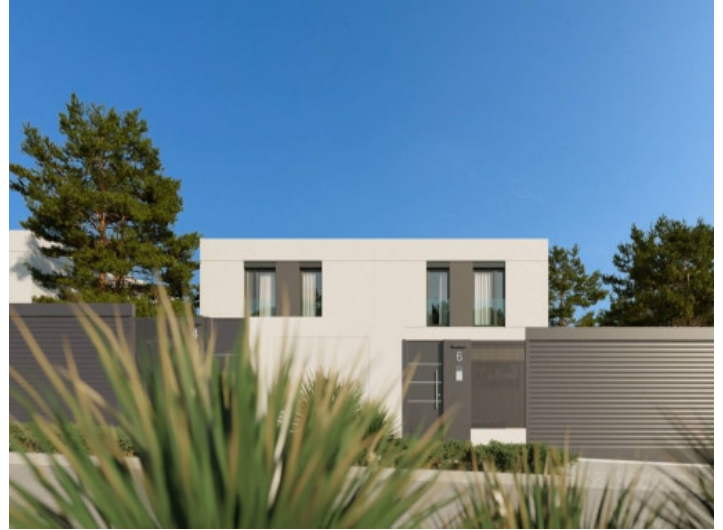
Vista exterior de la casa