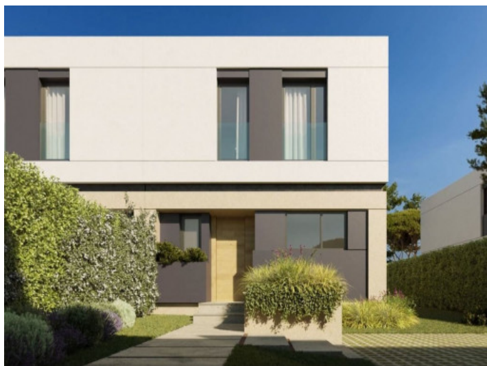
Entrada de la coasa