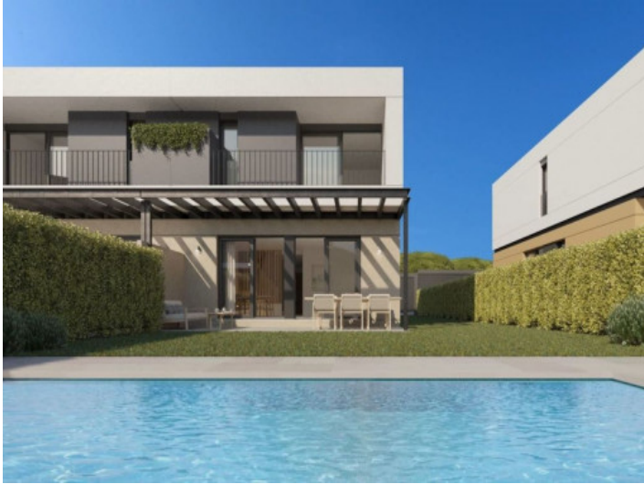
Vista desde la piscina