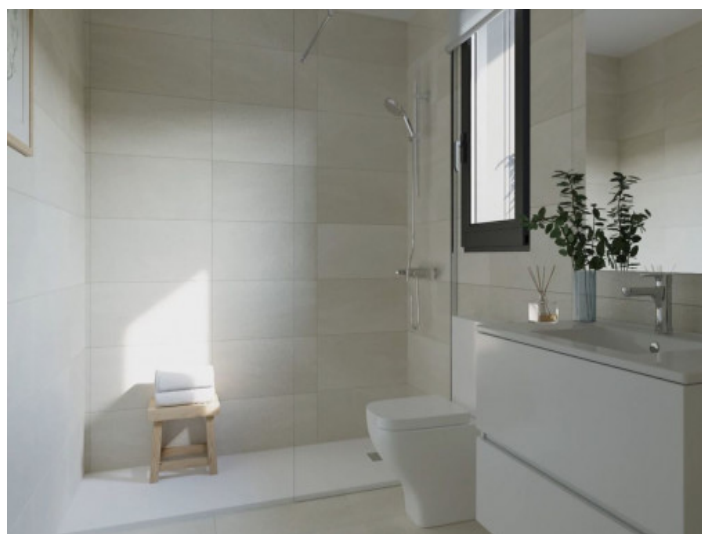
Baño elegante con ducha aa nivel del suelo