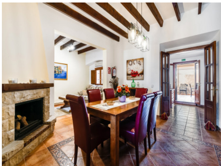
Salón-comedor en planta baja