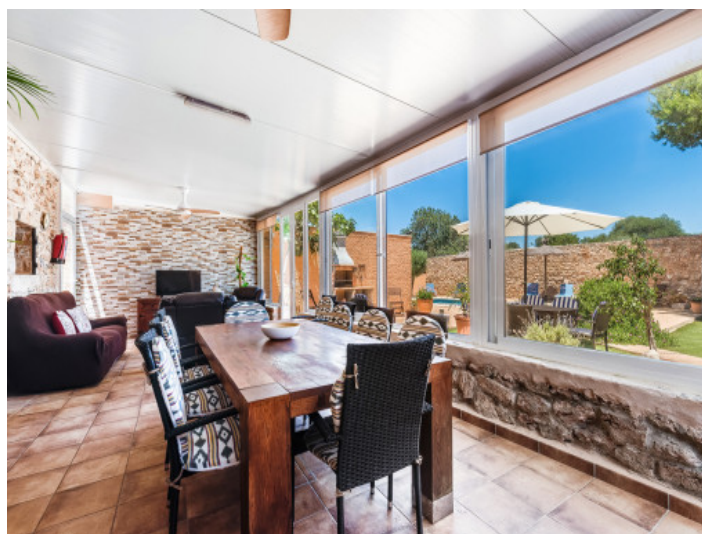
Jardín de invierno con comedor