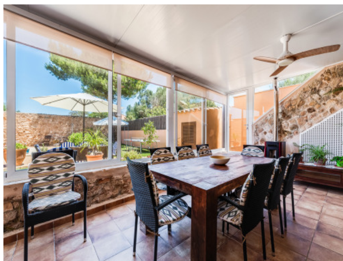
Jardín de invierno con comedor