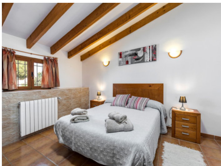
Uno de 5 dormitorios