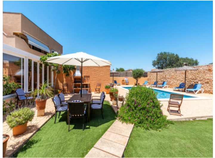
Jardín con piscina