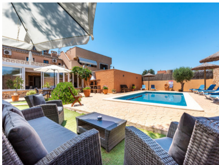
Hermosa área de piscina

Toda la información como mejor se puede saber, salvo por error durante el periodo de venta. Sirva este documento como un informe previo, las bases legales solo serán válidas a través de un contrato de compra acordado ante Notario.