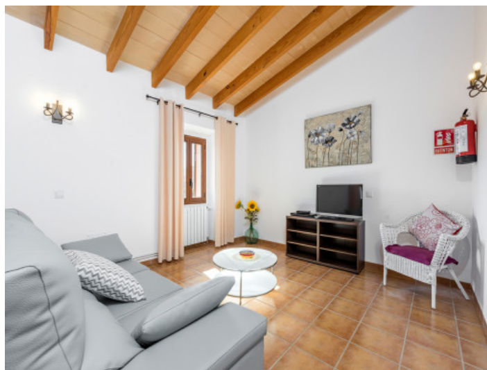
Área de estar inundada de luz en el primer piso

Toda la información como mejor se puede saber, salvo por error durante el periodo de venta. Sirva este documento como un informe previo, las bases legales solo serán válidas a través de un contrato de compra acordado ante Notario.