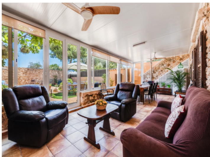
Jardín de invierno con comedor