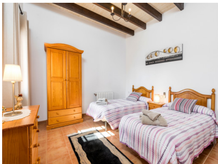
Dormitorio con 2 camas