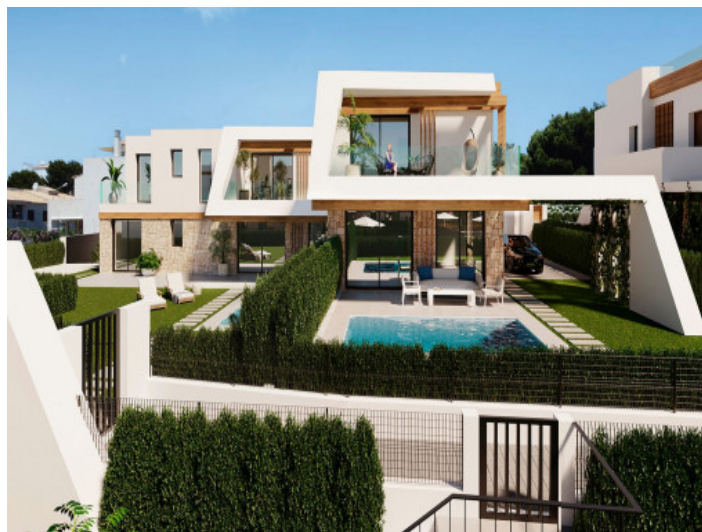
Villa con piscina