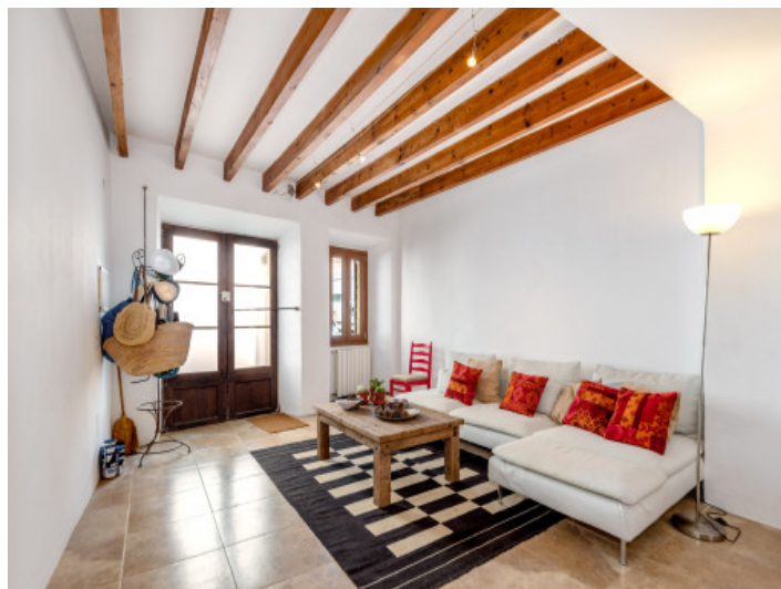
Salón y entrada