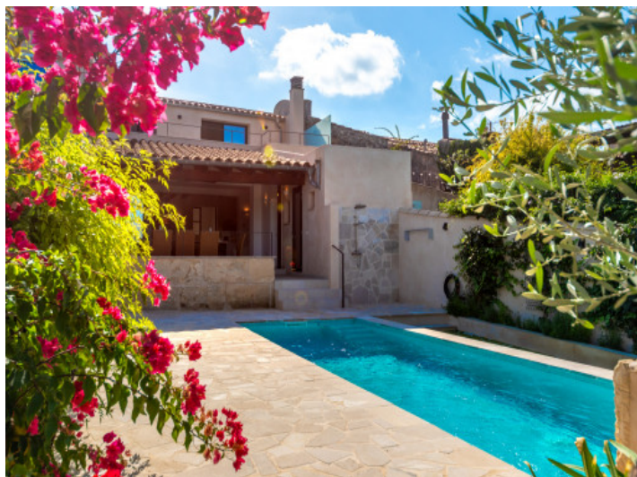
Casa de pueblo con piscina en Llubi