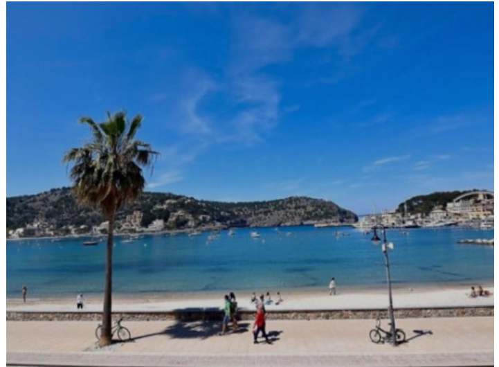
Port de Soller