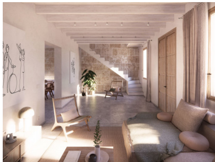
Hall y salón