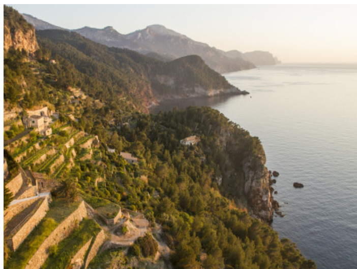
costa de Bañalbufar

Toda la información como mejor se puede saber, salvo por error durante el periodo de venta. Sirva este documento como un informe previo, las bases legales solo serán válidas a través de un contrato de compra acordado ante Notario.