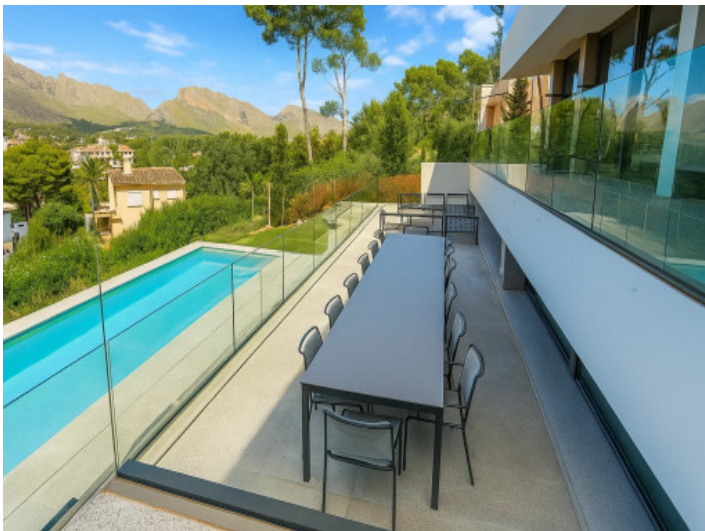
Comedor junto a la piscina