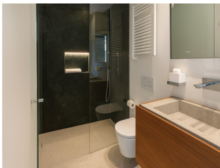
Baño del tercer dormitorio doble