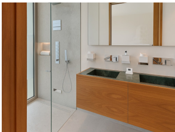
Baño del cuarto dormitorio doble

Toda la información como mejor se puede saber, salvo por error durante el periodo de venta. Sirva este documento como un informe previo, las bases legales solo serán válidas a través de un contrato de compra acordado ante Notario.