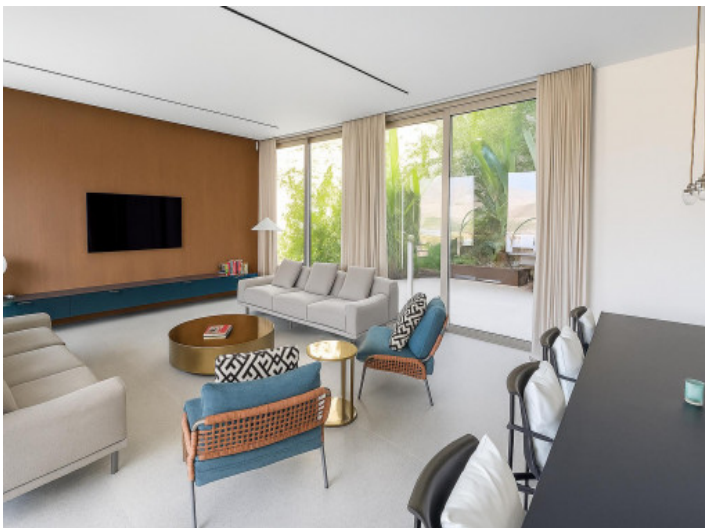
Salón en el nivel de entrada