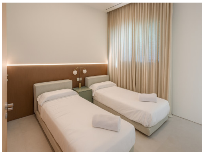
Segundo dormitorio doble en la planta superior