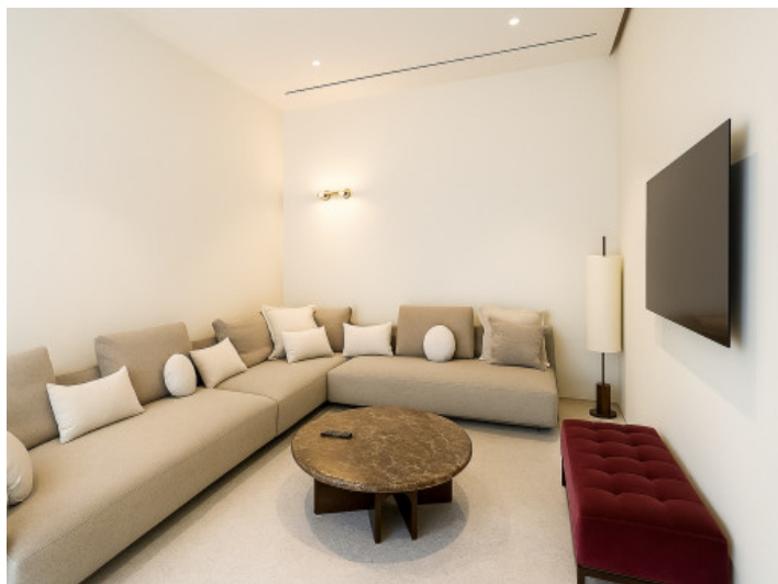
Sala de TV en el nivel de entrada