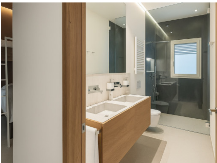
Baño en suite del dormitorio infantil