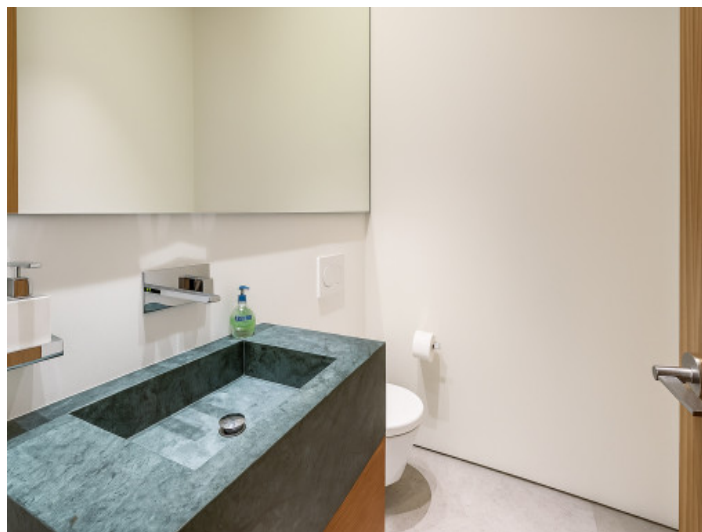
Aseo de cortesía en el nivel de entrada