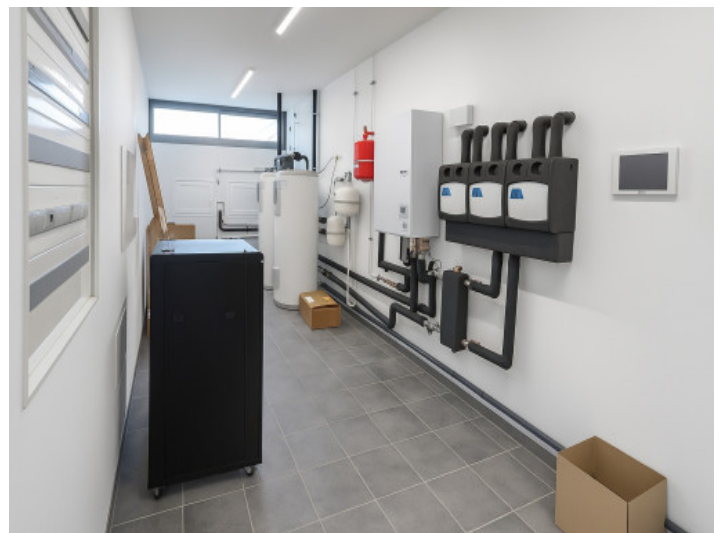
Cuarto de máquinas en la planta baja