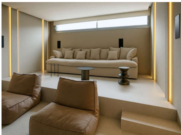
Cine en casa en la planta baja