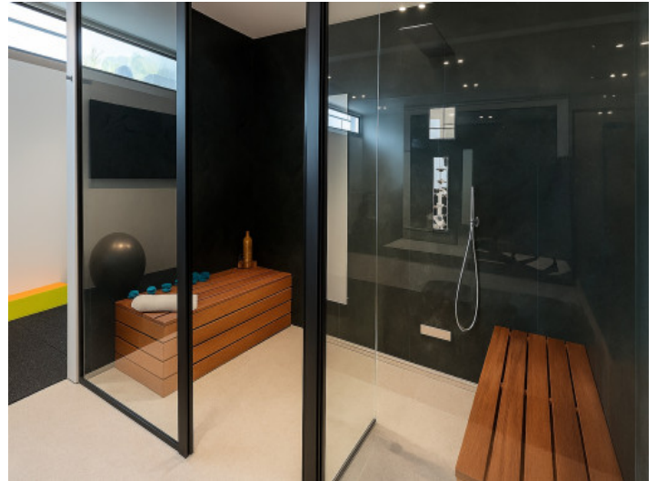
Sauna integrada en el gimnasio