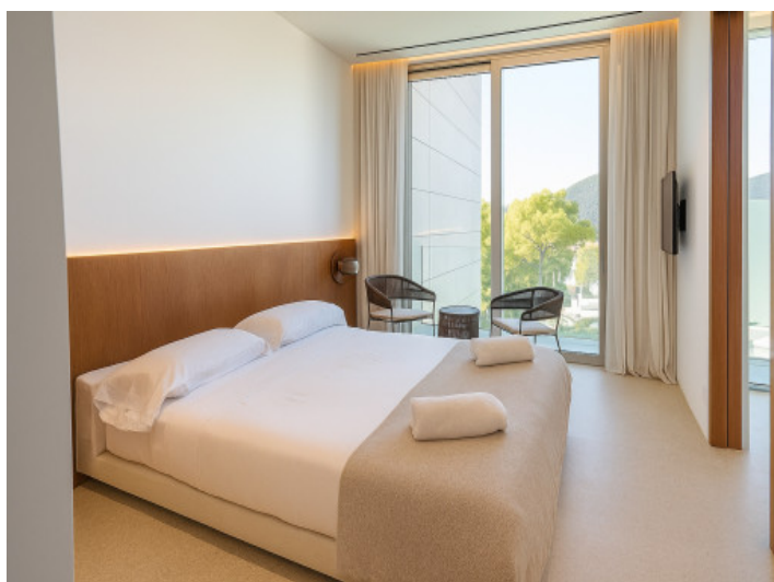
Cuarto dormitorio doble en la planta superior