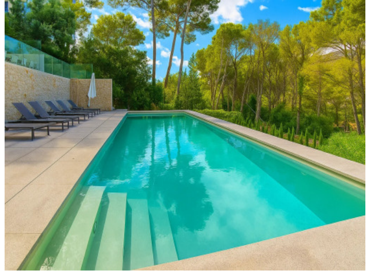
Piscina enmarcada por terrazas solárium