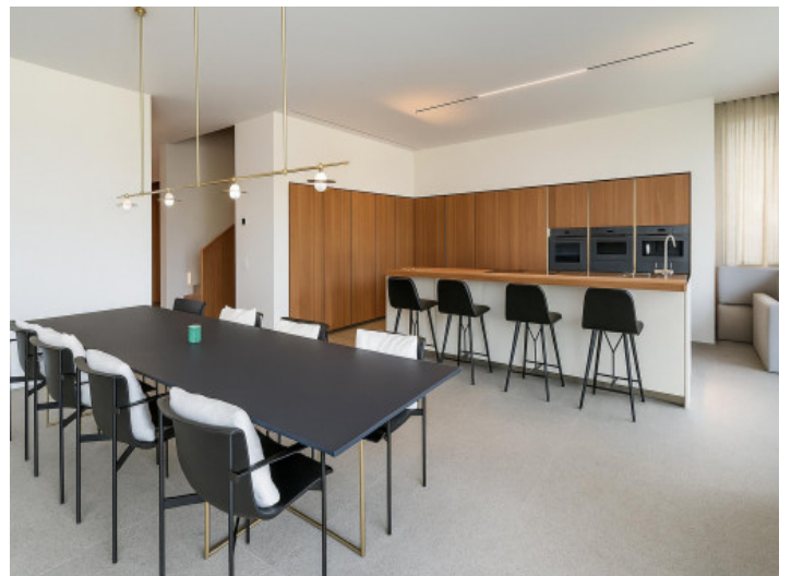
Comedor y cocina en el nivel de entrada

Toda la información como mejor se puede saber, salvo por error durante el periodo de venta. Sirva este documento como un informe previo, las bases legales solo serán válidas a través de un contrato de compra acordado ante Notario.