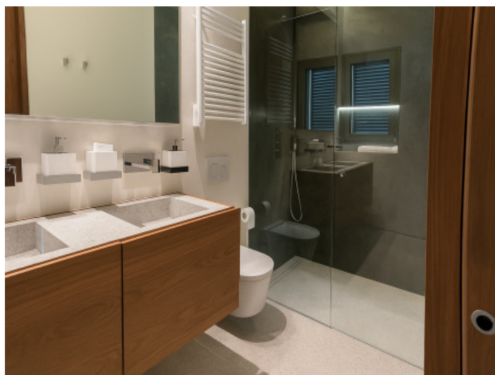
Baño del segundo dormitorio doble