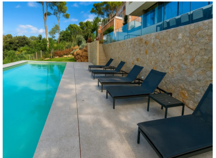
Terrazas solárium junto a la piscina