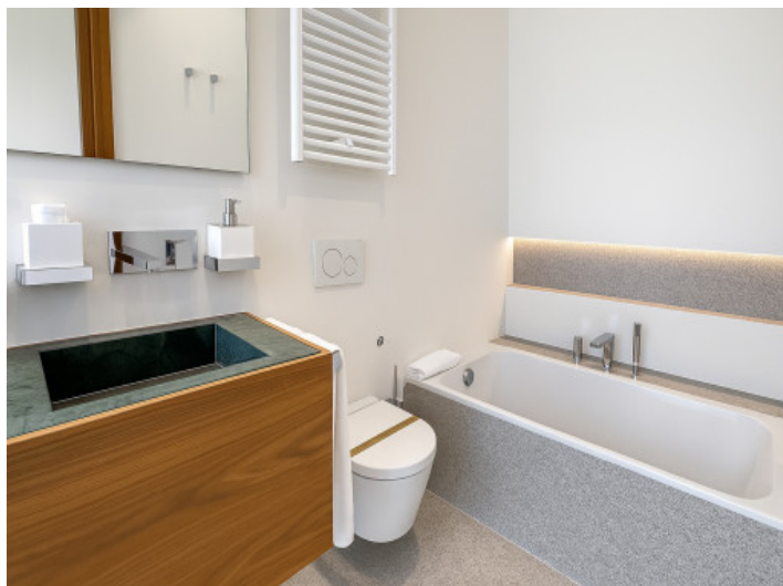
Baño del cuarto dormitorio doble