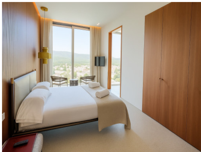
Quinto dormitorio doble en la planta superior