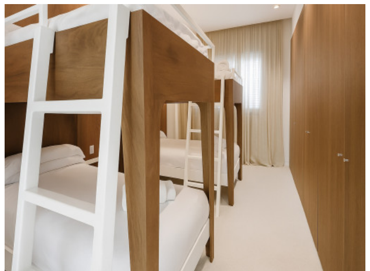
Dormitorio infantil en la planta superior

Toda la información como mejor se puede saber, salvo por error durante el periodo de venta. Sirva este documento como un informe previo, las bases legales solo serán válidas a través de un contrato de compra acordado ante Notario.