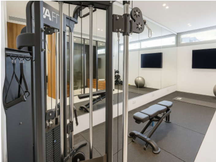
Gimnasio en la planta baja