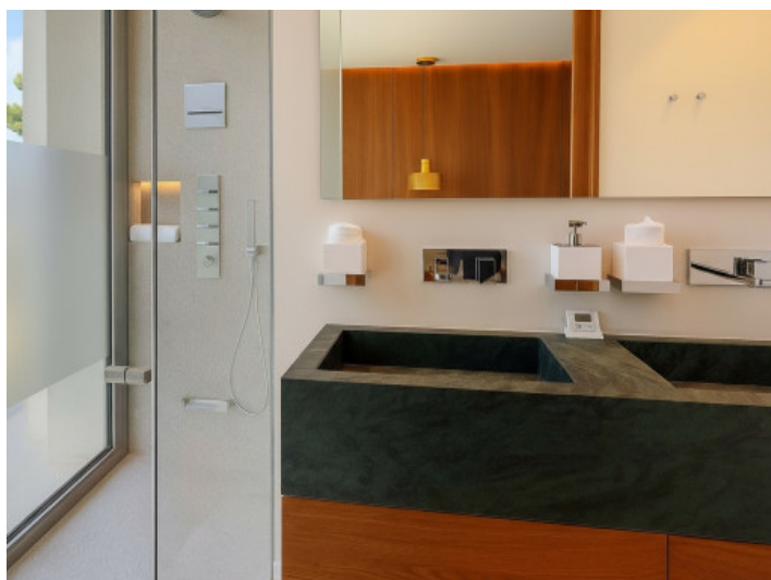
Baño del quinto dormitorio doble