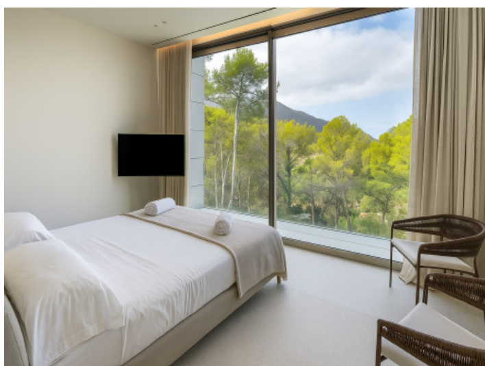
Tercer dormitorio doble en la planta superior