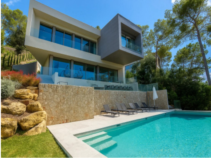
Villa minimalista en Gotmar