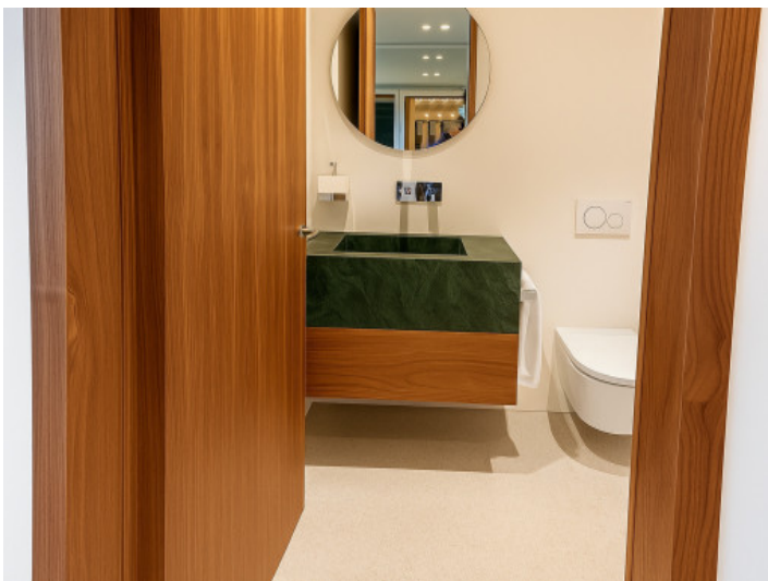
Baño en el gimnasio