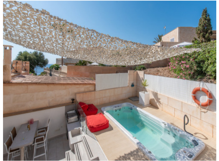
Patio con SWIM SPA