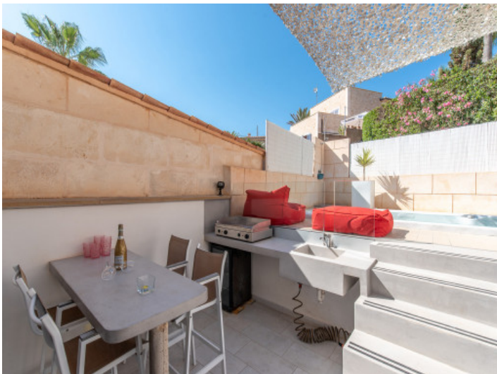
Zona de barbacoa