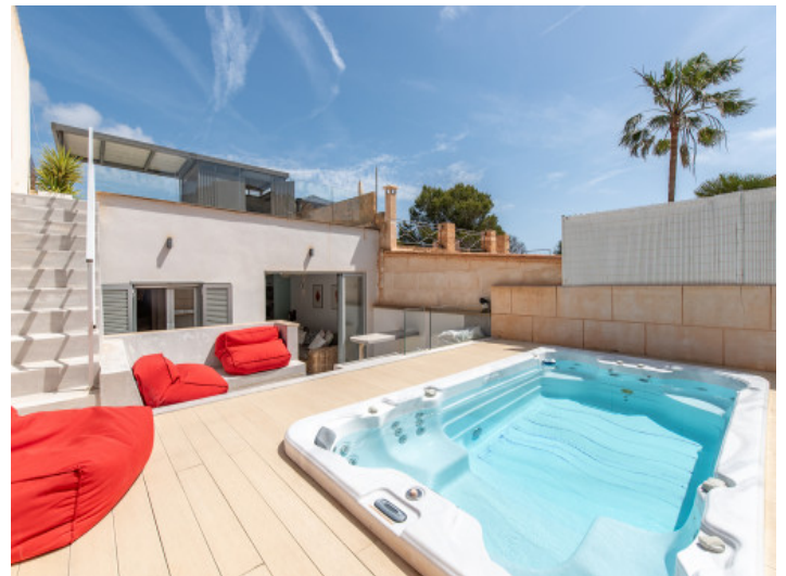
Patio grande con SPA y BBQ