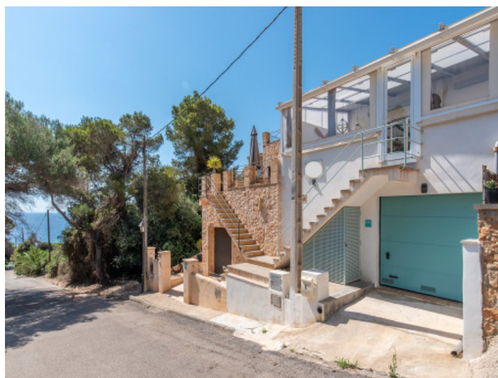
Oportunidad única - 2 casas con licencias de Alquiler