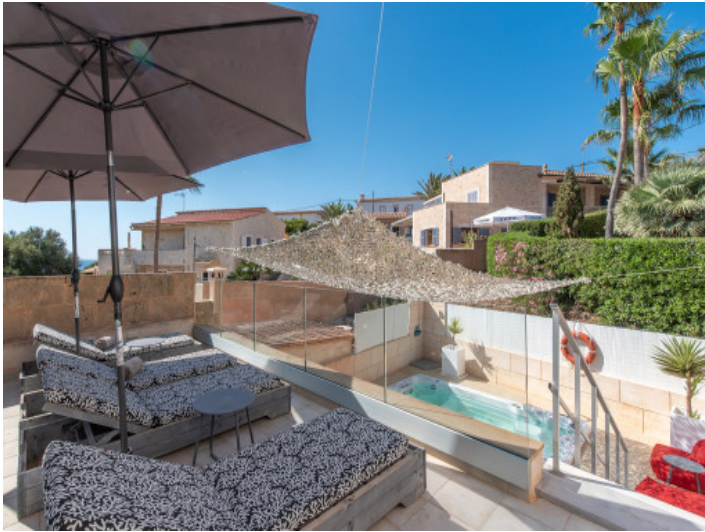
Azotea con vistas al mar