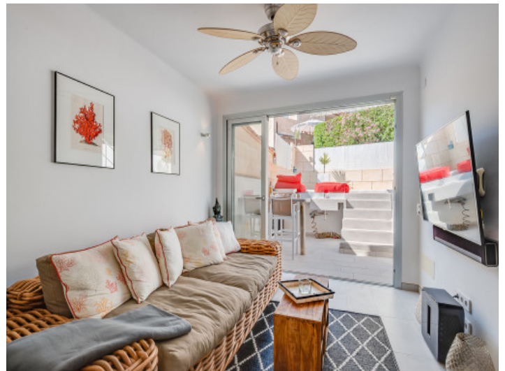
Salón luminoso Casa 1