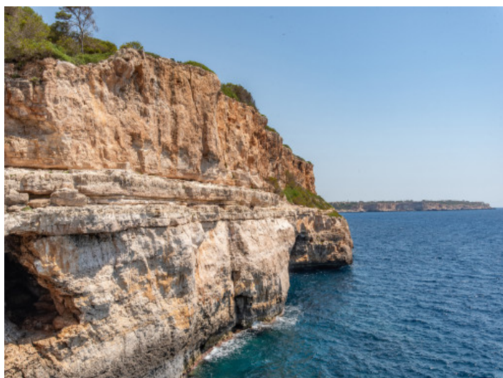
Costa Cala Llombards