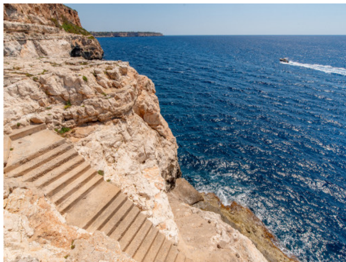
Costa Cala Llombards