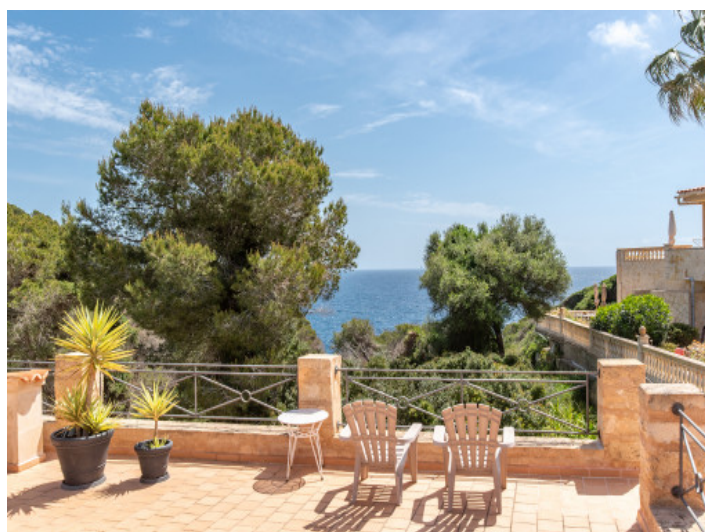
Vista al mar

Toda la información como mejor se puede saber, salvo por error durante el periodo de venta. Sirva este documento como un informe previo, las bases legales solo serán válidas a través de un contrato de compra acordado ante Notario.