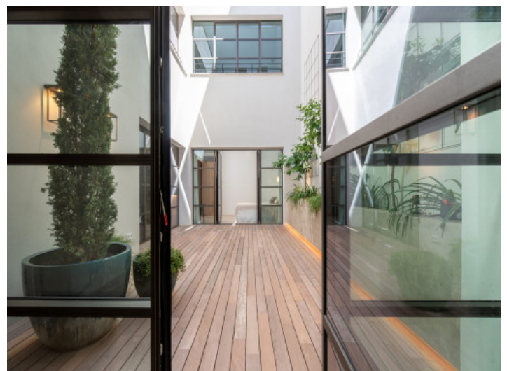
Patio con privacidad

Toda la información como mejor se puede saber, salvo por error durante el periodo de venta. Sirva este documento como un informe previo, las bases legales solo serán válidas a través de un contrato de compra acordado ante Notario.