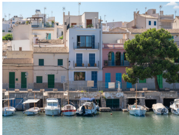
Casa de pueblo en el casco antiguo