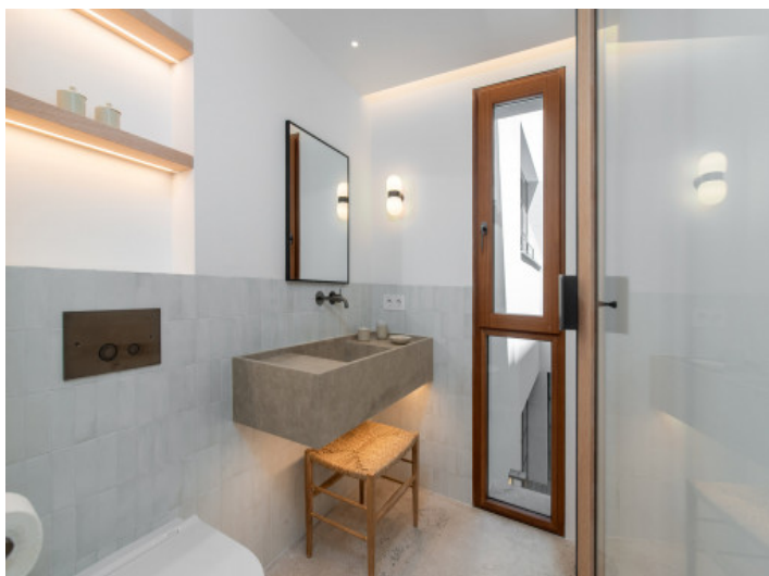
Uno de 4 baños