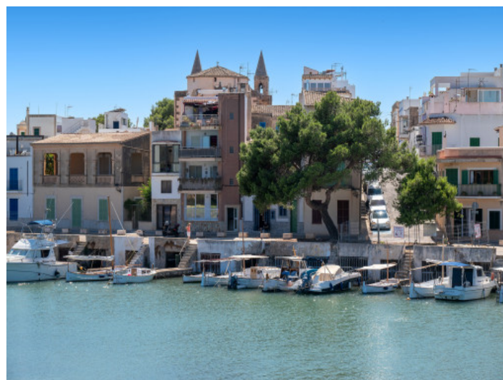
Casco antiguo de Portocolom