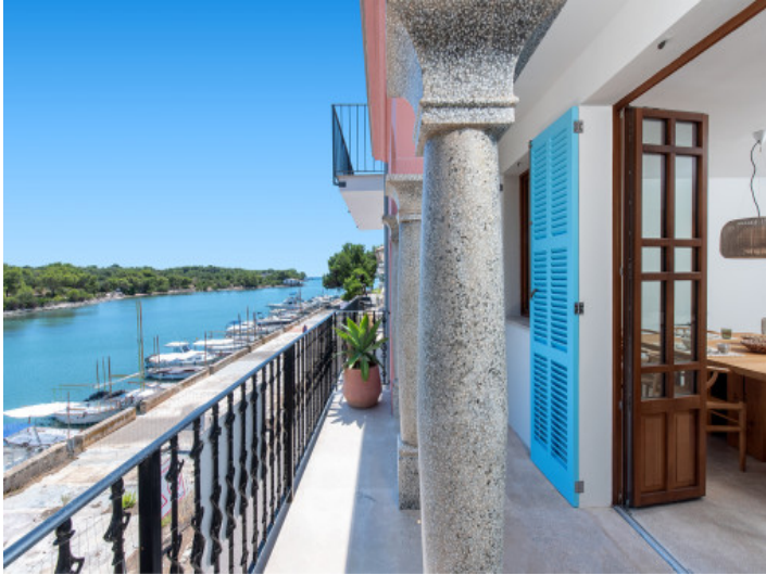
Maravillosas vistas al mar