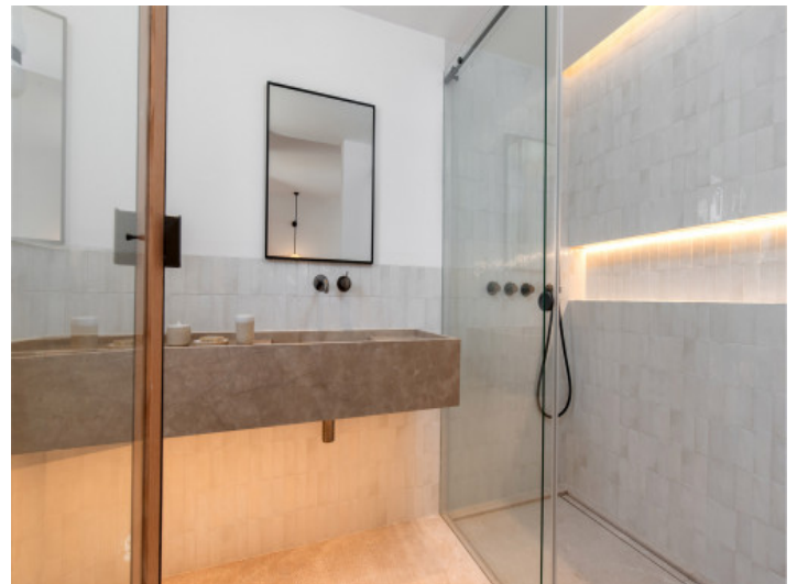
Uno de 4 baños