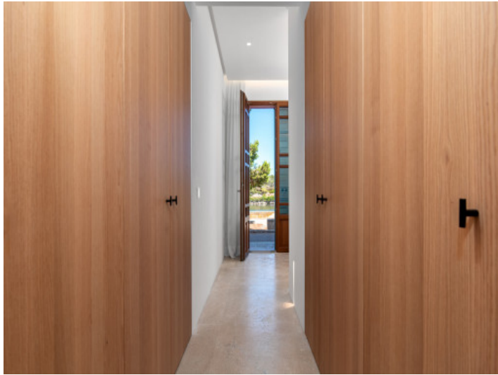
Zona de vestidor