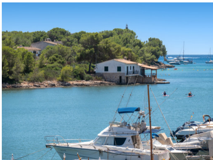
Hermosas vistas al mar

Toda la información como mejor se puede saber, salvo por error durante el periodo de venta. Sirva este documento como un informe previo, las bases legales solo serán validas a traves de un contrato de compra acordado ante Notario.