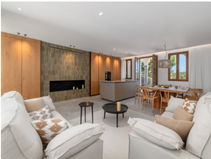
Elegante salón con chimenea