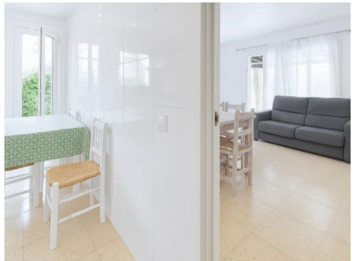
Cocina y salón-comedor