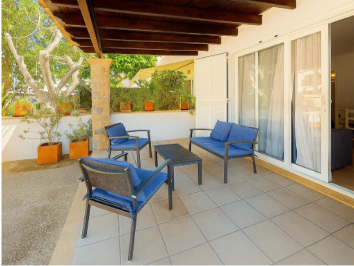
Porche y zona de entrada