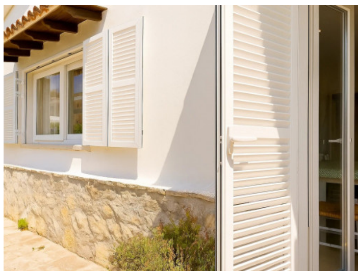
Acceso a la cocina

Toda la información como mejor se puede saber, salvo por error durante el periodo de venta. Sirva este documento como un informe previo, las bases legales solo serán válidas a través de un contrato de compra acordado ante Notario.