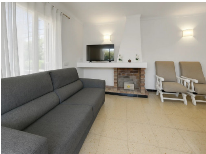
Salón con chimenea