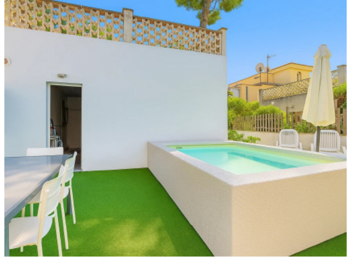
Piscina en la parte trasera de la propiedad