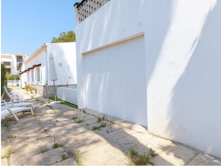
Garaje y entrada