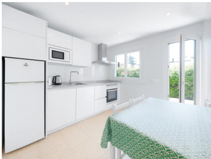
Cocina con comedor