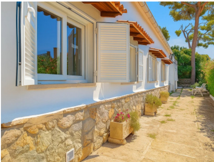
Vista lateral de la casa