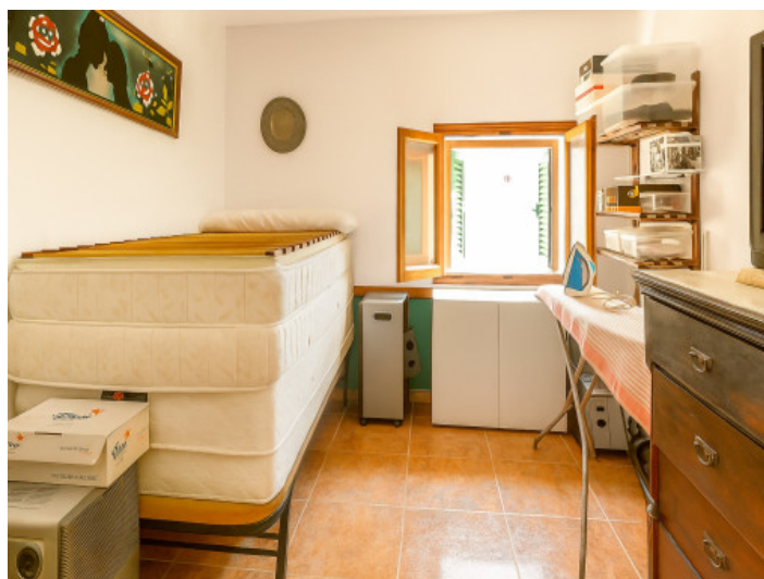
Tercer dormitorio de la vivienda inferior