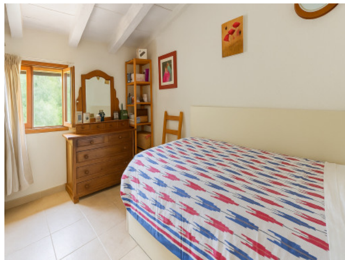
Segundo dormitorio de la vivienda inferior