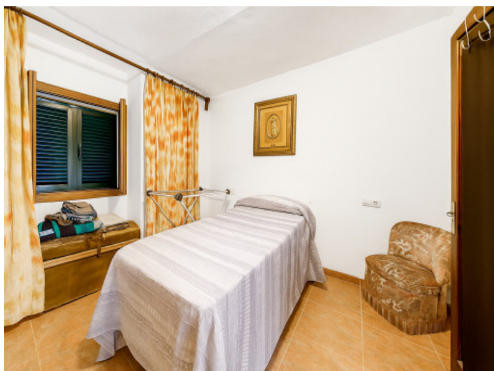
Segundo dormitorio de la vivienda inferior