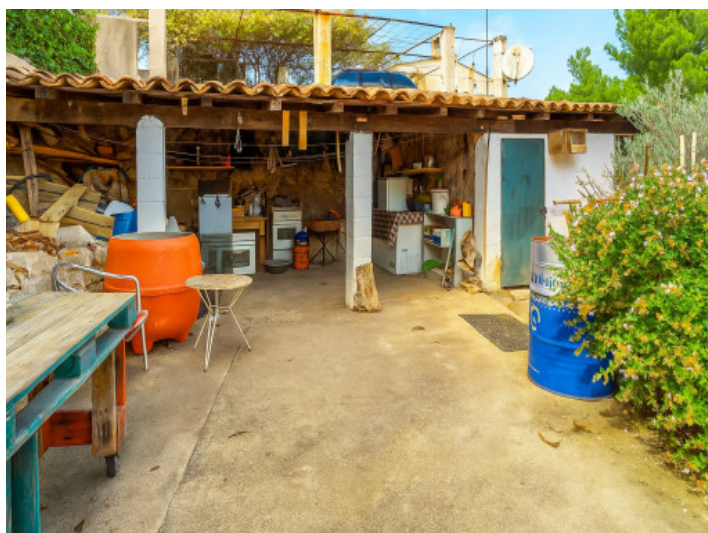
Terraza cubierta en el límite de la parcela