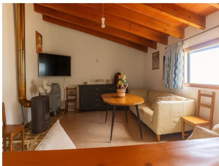
Salón de la vivienda inferior

Toda la información como mejor se puede saber, salvo por error durante el periodo de venta. Sirva este documento como un informe previo, las bases legales solo serán válidas a través de un contrato de compra acordado ante Notario.