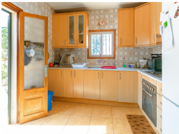
Cocina de la vivienda inferior