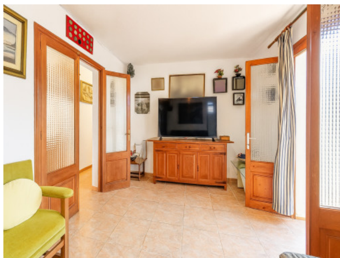
Salón de la vivienda inferior