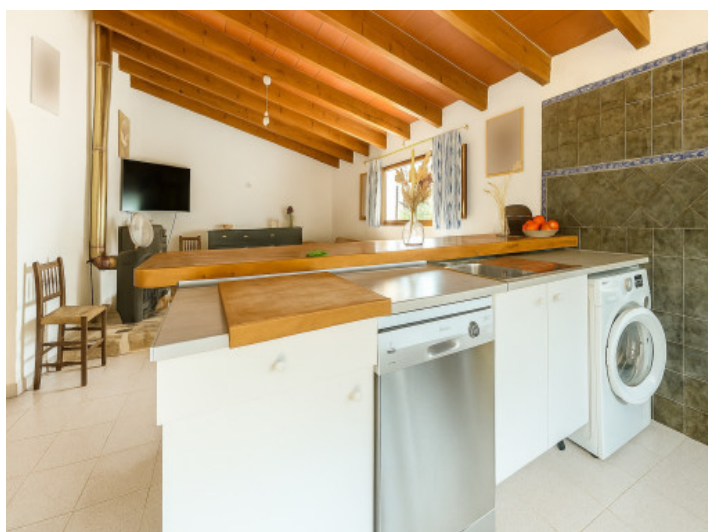
Cocina de la vivienda superior