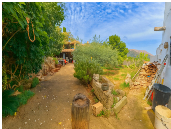
Zona ajardinada del nivel inferior