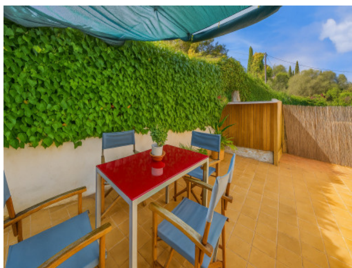
Terraza de la vivienda superior