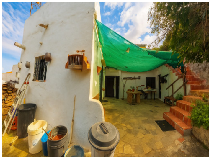
Patio del nivel inferior