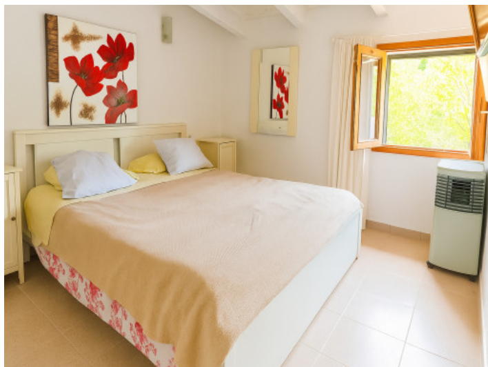
Primer dormitorio de la vivienda inferior