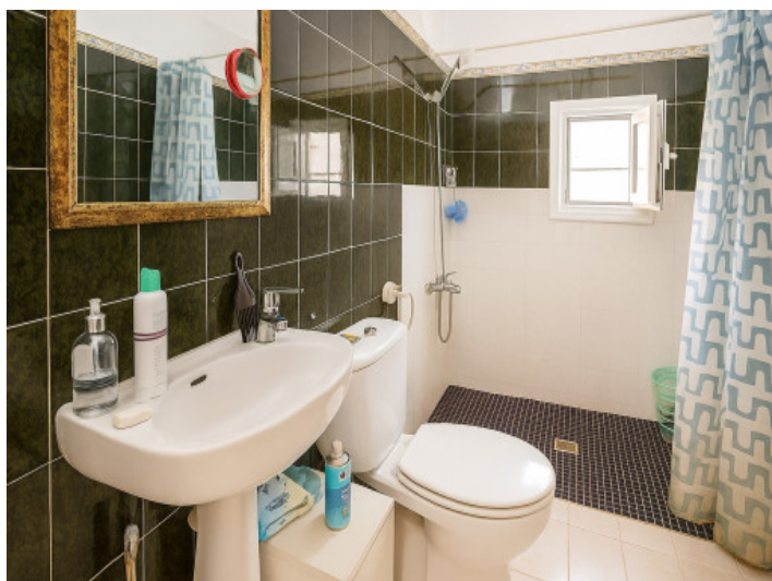
Baño de la vivienda inferior