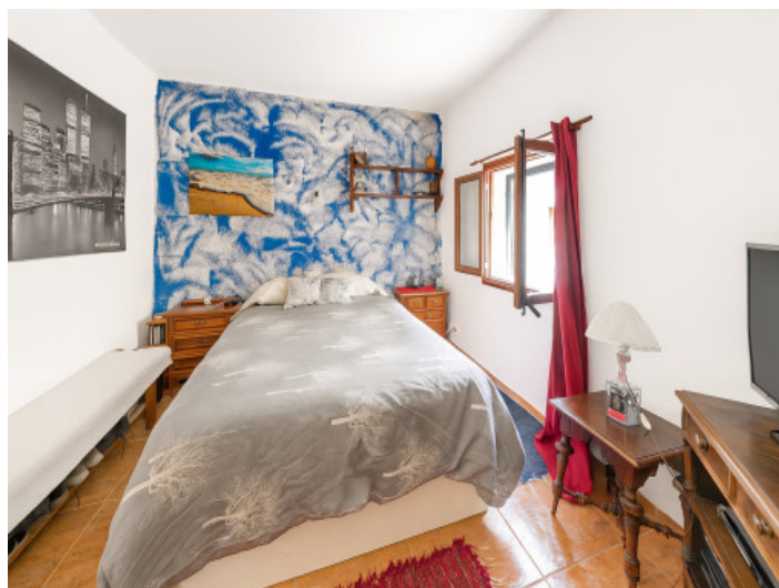
Primer dormitorio de la vivienda inferior

Toda la información como mejor se puede saber, salvo por error durante el periodo de venta. Sirva este documento como un informe previo, las bases legales solo serán válidas a través de un contrato de compra acordado ante Notario.