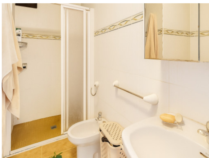
Baño de la vivienda inferior