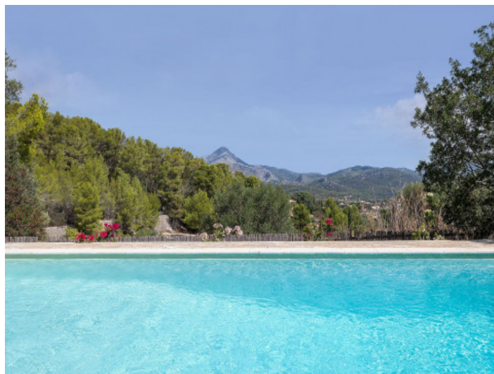
Piscina con vistas a las montañas