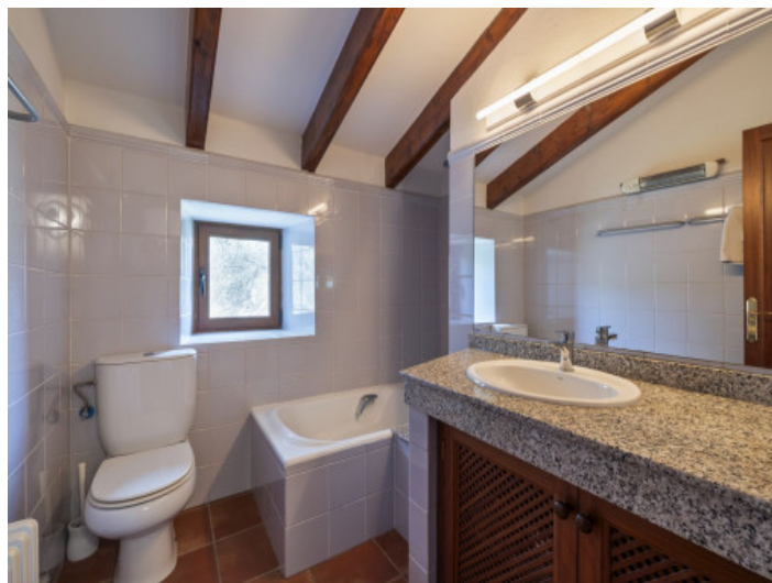
Baño planta piso