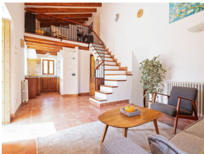
Cocina y atillo