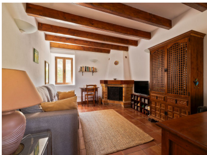
Salón con chimenea