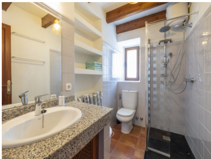
Baño con ducha