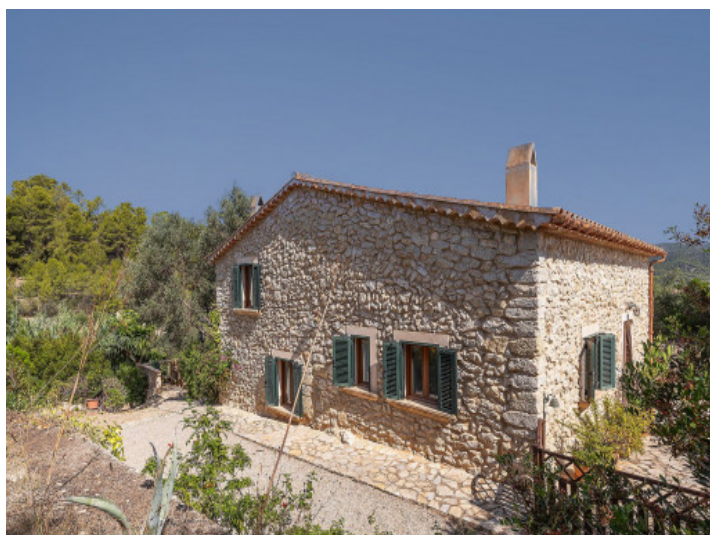
Fachada de piedra natural

Toda la información como mejor se puede saber, salvo por error durante el periodo de venta. Sirva este documento como un informe previo, las bases legales solo serán válidas a través de un contrato de compra acordado ante Notario.