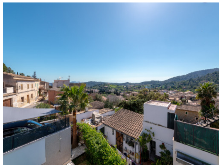
Vistas abiertas al paisaje

Toda la información como mejor se puede saber, salvo por error durante el periodo de venta. Sirva este documento como un informe previo, las bases legales solo serán válidas a través de un contrato de compra acordado ante Notario.