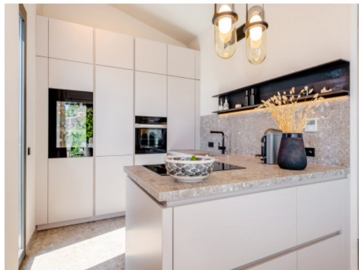
Cocina moderna y salón en planta superior