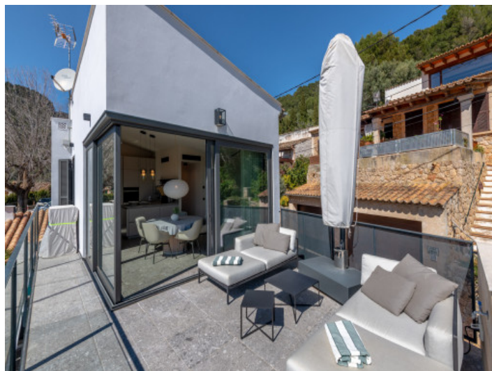
Terraza en la azotea moderna con zona de estar y acceso a la cocina