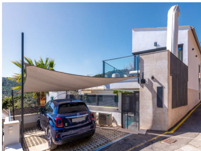
Plaza de aparcamiento para un vehículo

Toda la información como mejor se puede saber, salvo por error durante el periodo de venta. Sirva este documento como un informe previo, las bases legales solo serán válidas a través de un contrato de compra acordado ante Notario.