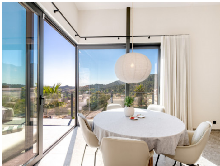
Comedor con ventanales panorámicos y vistas

Toda la información como mejor se puede saber, salvo por error durante el periodo de venta. Sirva este documento como un informe previo, las bases legales solo serán válidas a través de un contrato de compra acordado ante Notario.