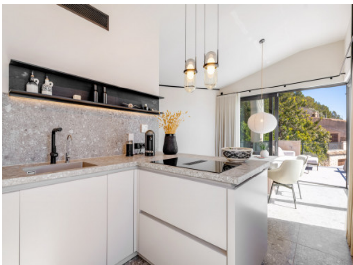
Cocina moderna con electrodomésticos de alta calidad