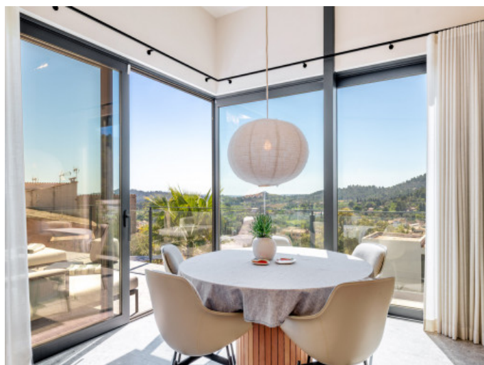
Comedor con ventanales panorámicos y vistas