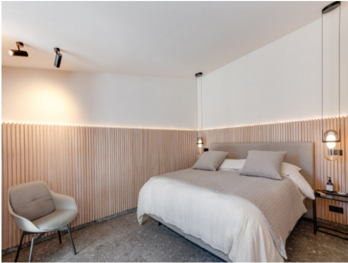
Dormitorio en planta baja