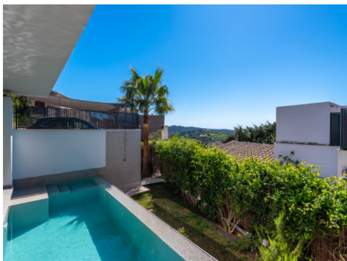
Zona de piscina con solárium