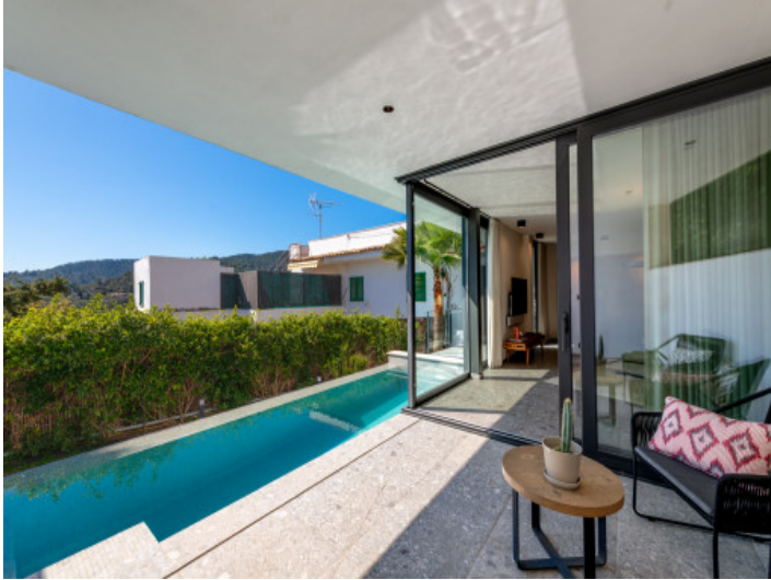
Piscina y jardín