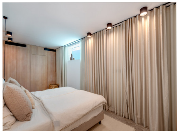
Dormitorio en sótano

Toda la información como mejor se puede saber, salvo por error durante el periodo de venta. Sirva este documento como un informe previo, las bases legales solo serán válidas a través de un contrato de compra acordado ante Notario.