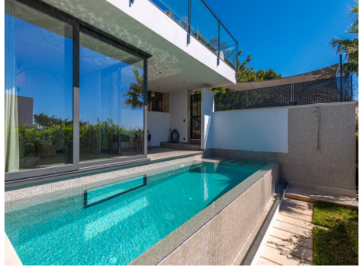
Piscina de sal