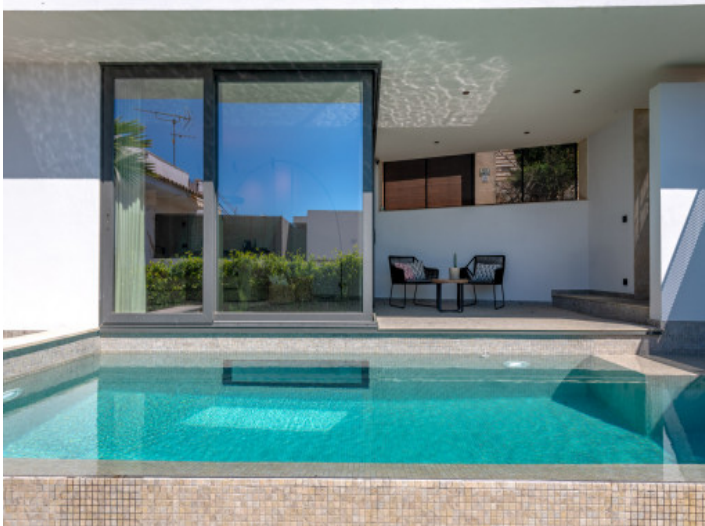
Vista a la terraza de la piscina