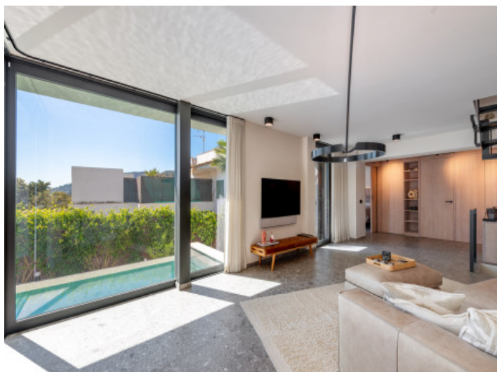
Salón luminoso con grandes ventanales