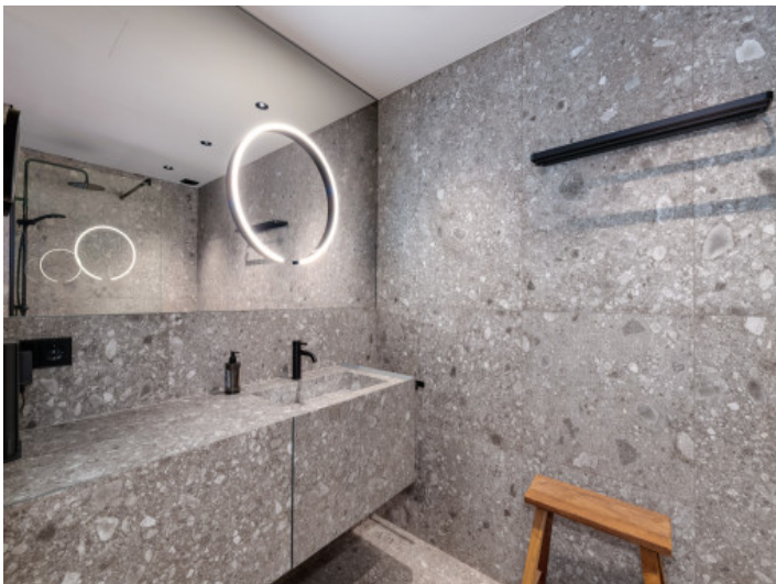
Uno de los dos baños