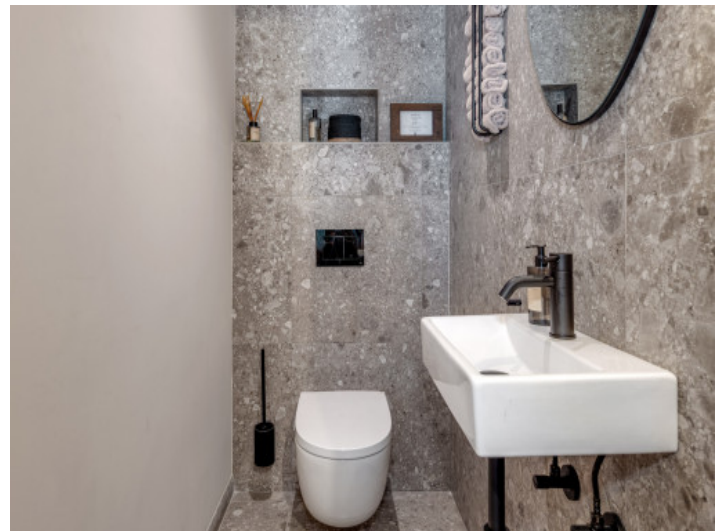
Aseo de invitados