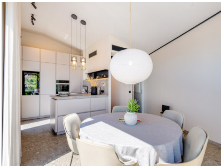
Dining area with panoramic windows and views