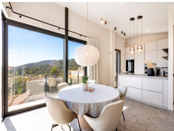
Comedor con ventanales panorámicos y vistas