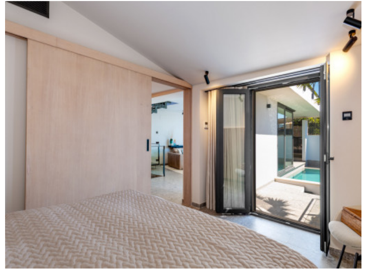
Dormitorio luminoso con acceso al exterior