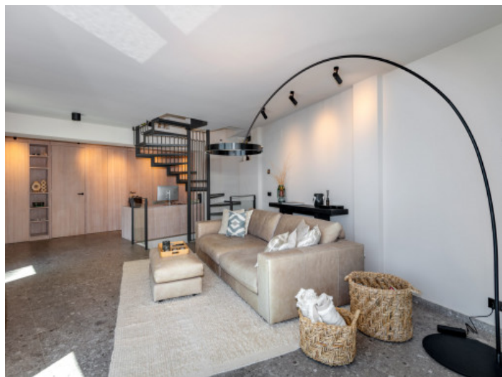
Salón abierto en planta baja