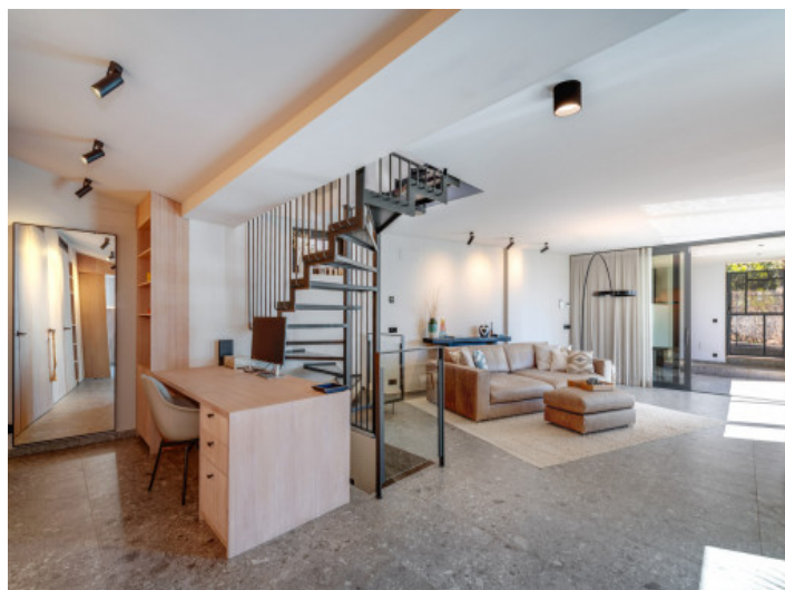
Salón abierto en planta baja

Toda la información como mejor se puede saber, salvo por error durante el periodo de venta. Sirva este documento como un informe previo, las bases legales solo serán válidas a través de un contrato de compra acordado ante Notario.