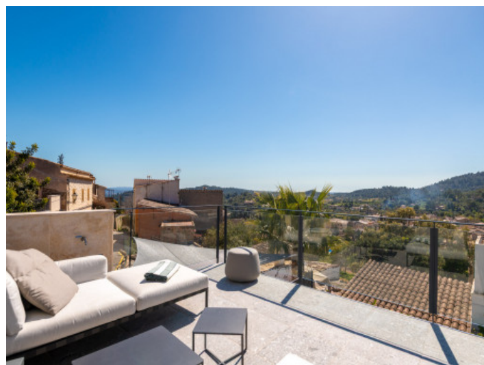
Terraza soleada con zona lounge