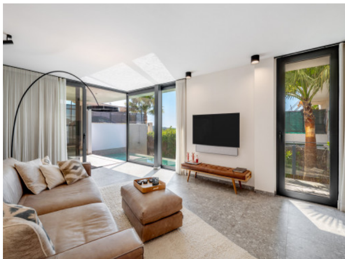
Salón abierto en planta baja