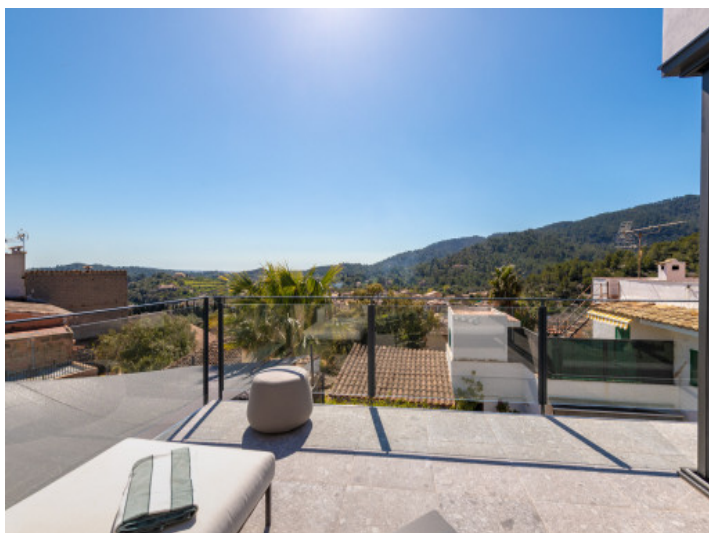
Vistas abiertas al paisaje