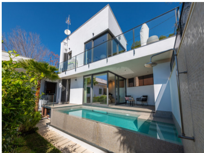
Vista exterior de la villa moderna con piscina