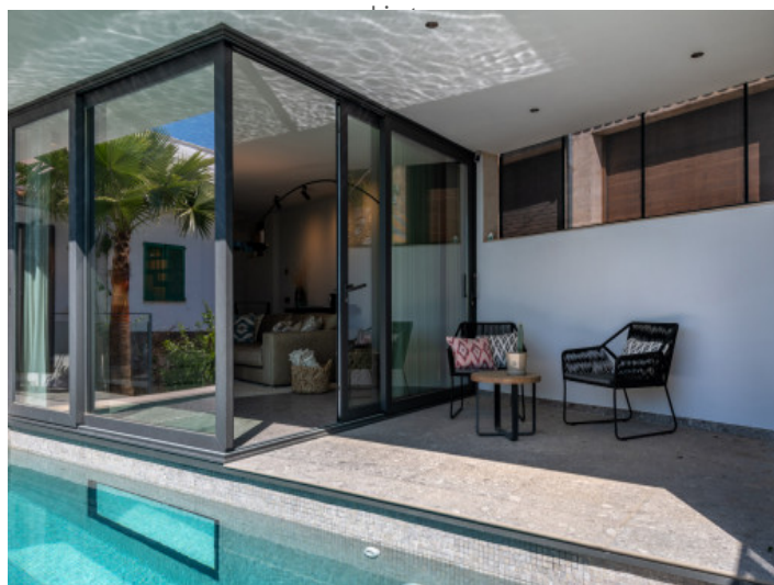
Salón abierto con transición fluida hacia la zona de piscina