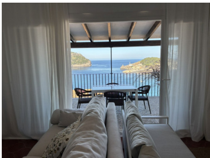
Salón con vistas al mar