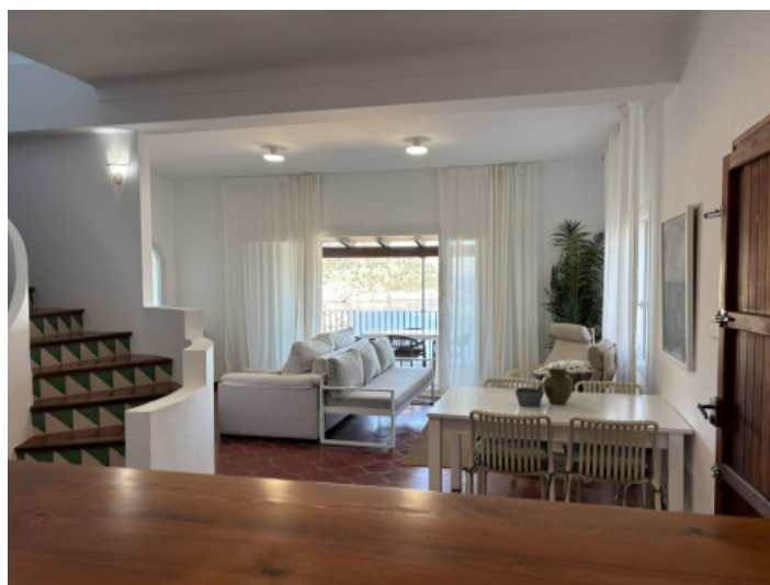
Salón comedor de concepto abierto