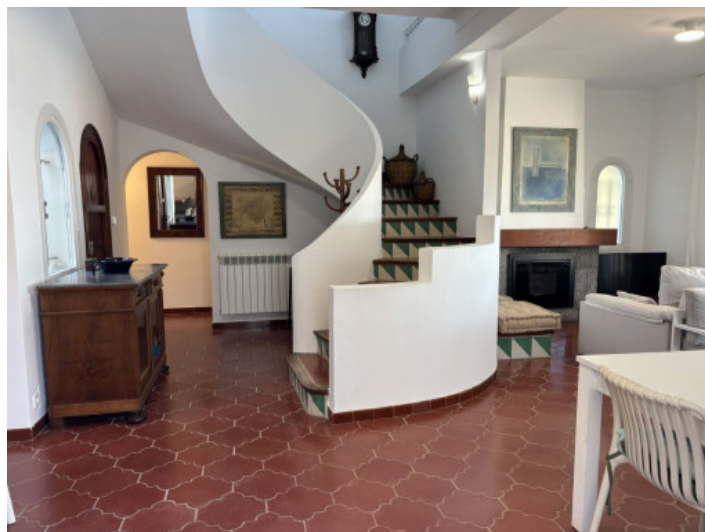
Entrada con escalera