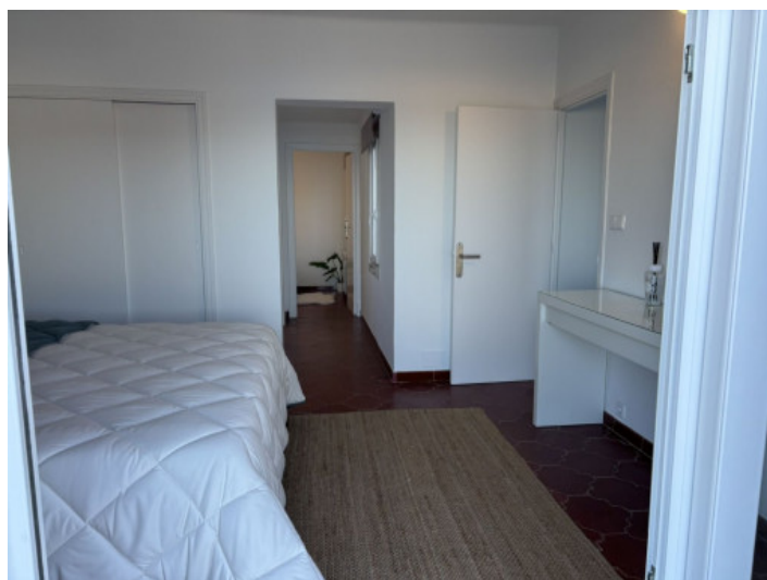
Dormitorio con acceso desde el pasillo