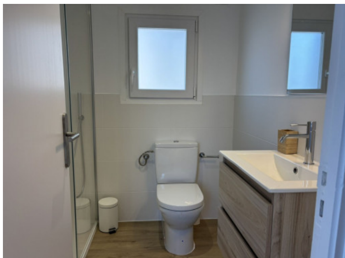
Baño moderno con ducha