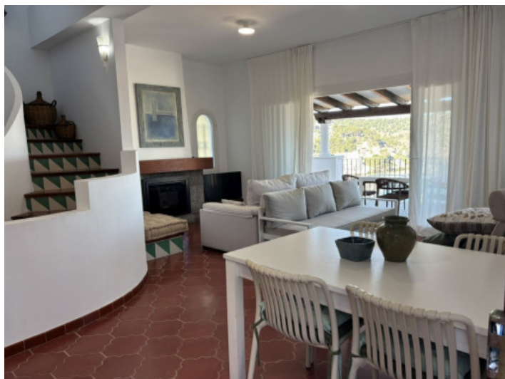
Zona de estar con chimenea de pellets