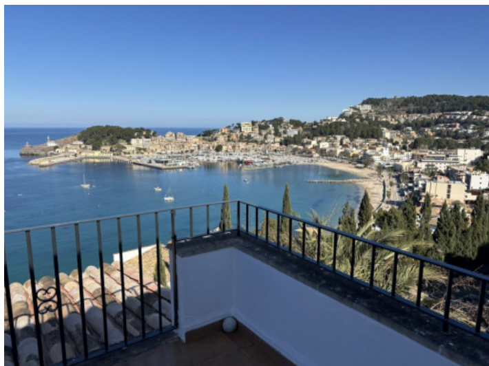
Vistas panorámicas desde el balcón