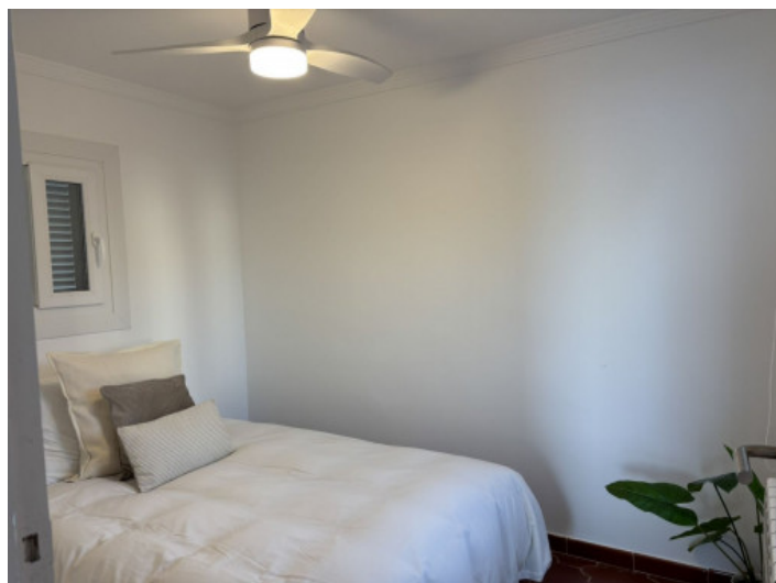
Dormitorio acogedor con ventilador

Toda la información como mejor se puede saber, salvo por error durante el periodo de venta. Sirva este documento como un informe previo, las bases legales solo serán válidas a través de un contrato de compra acordado ante Notario.