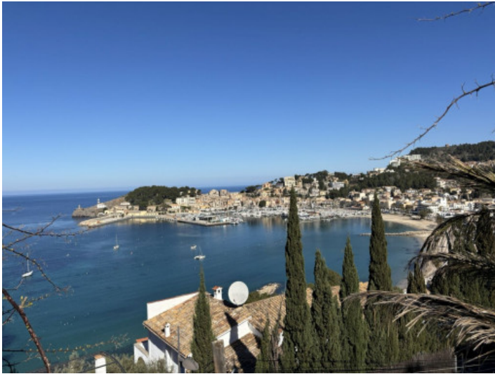
Vistas panorámicas a la bahía