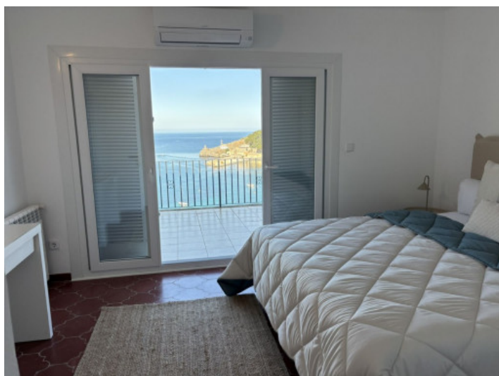
Dormitorio con vistas al mar