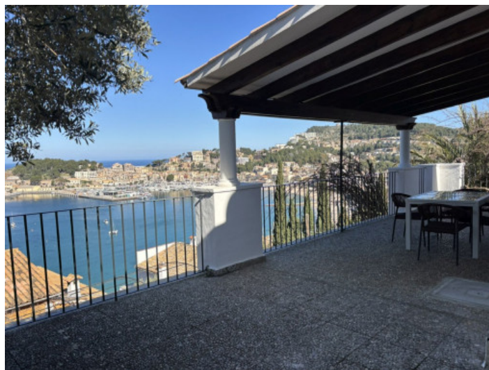
Terraza cubierta con vistas