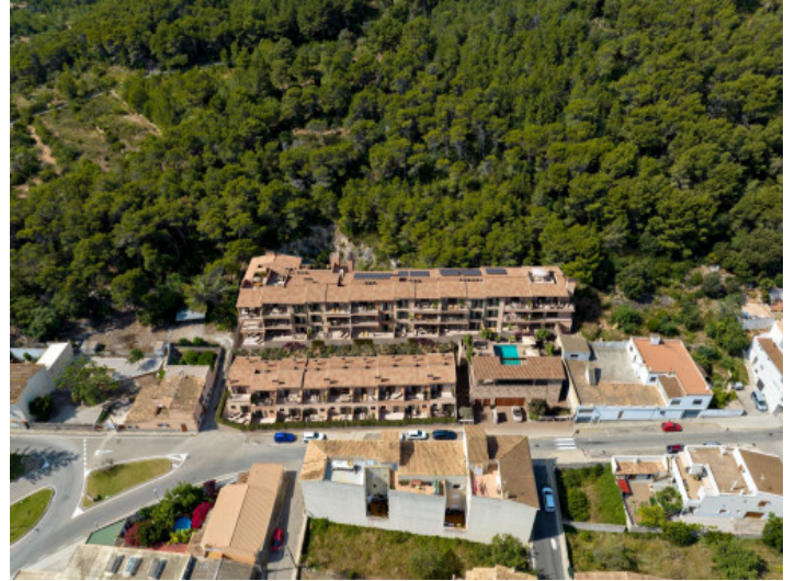
Complejo vista exterior