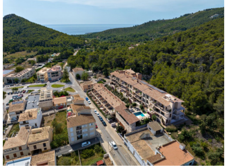
Ubicacion de complejo