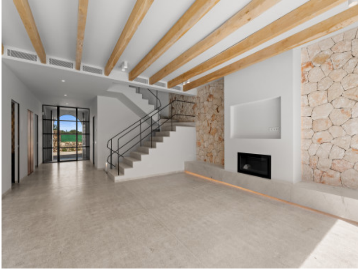
Salon grande con chimenea