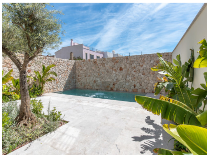
Patio con piscina