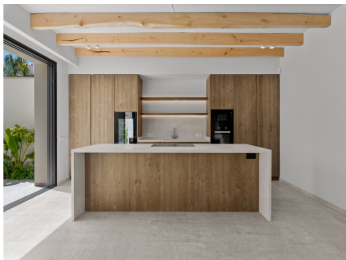
Cocina de diseño

Toda la información como mejor se puede saber, salvo por error durante el periodo de venta. Sirva este documento como un informe previo, las bases legales solo serán válidas a través de un contrato de compra acordado ante Notario.