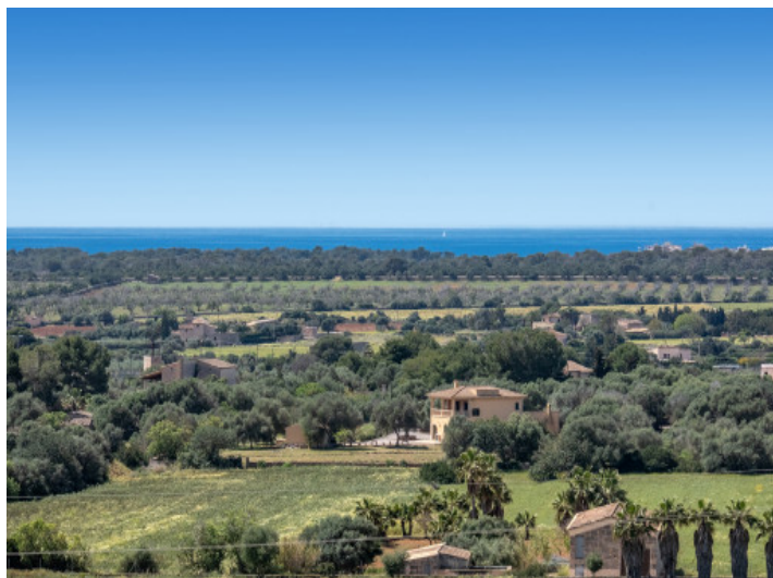
Vista al mar