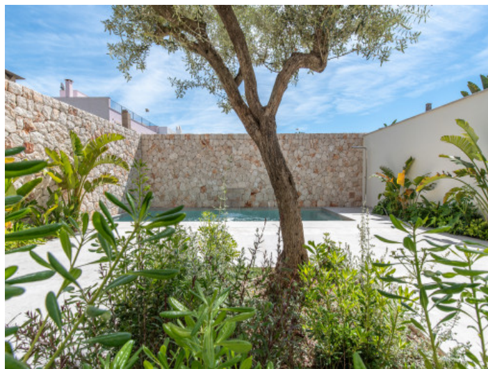
Patio con plantas