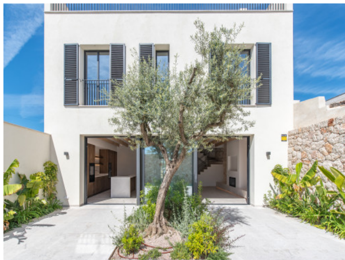
Patio con varios plantas