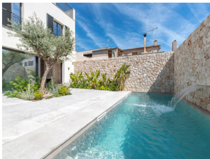
terrazza de piscina