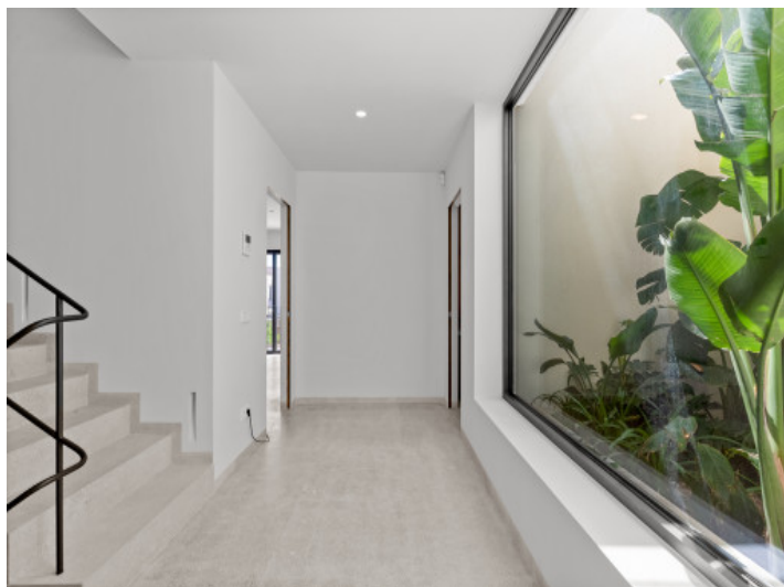
Patio de luces