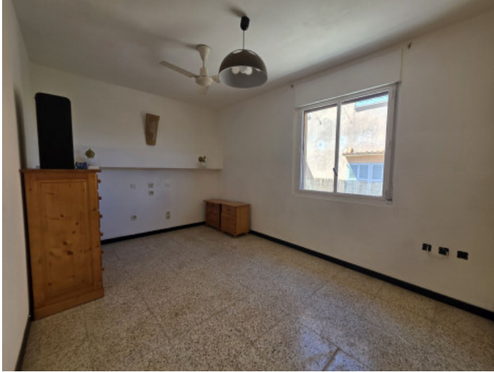
Uno de tres dormitorios