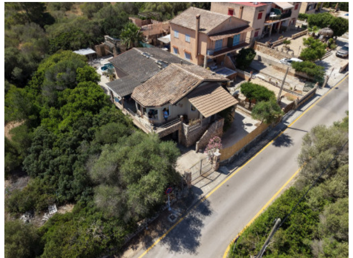
Chalet unifamiliar en buena ubicacion

Toda la información como mejor se puede saber, salvo por error durante el periodo de venta. Sirva este documento como un informe previo, las bases legales solo serán validas a traves de un contrato de compra acordado ante Notario.