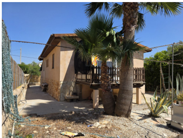
Chalet unifamiliar con piscina

Toda la información como mejor se puede saber, salvo por error durante el periodo de venta. Sirva este documento como un informe previo, las bases legales solo serán validas a traves de un contrato de compra acordado ante Notario.