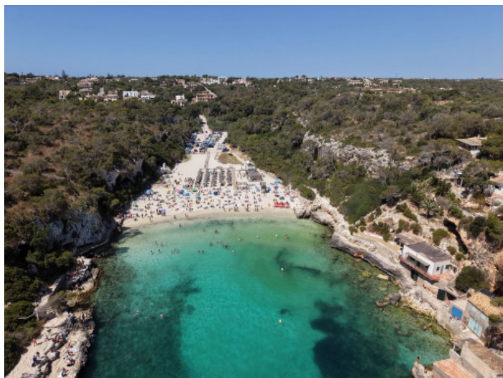
Playa de Cala Llombards