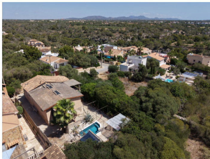
just a few meters from the beach