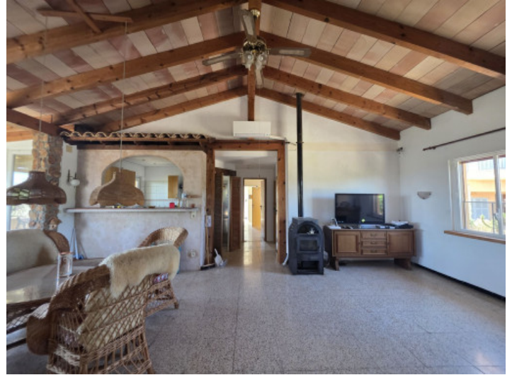
Salon y cocina abierto