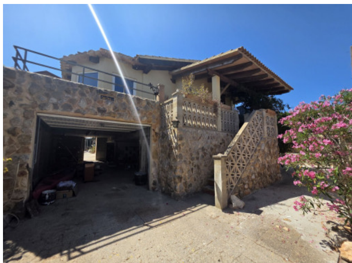
Garage y patio delantero