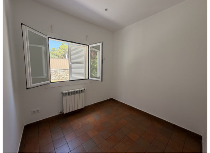
Uno de los tres dormitorios