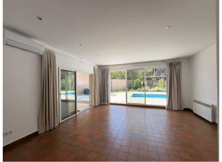
Salón con acceso directo a la terraza