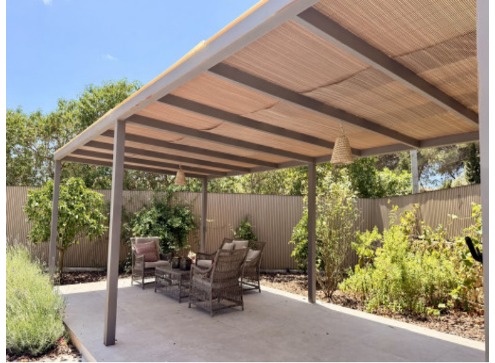
Zona lounge cubierta