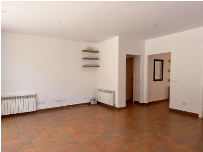
Amplia zona de estar