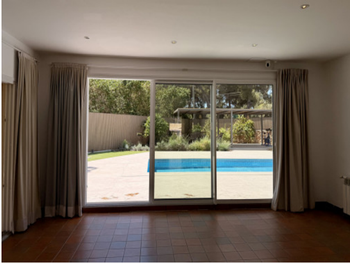
Salón con acceso directo a la terraza