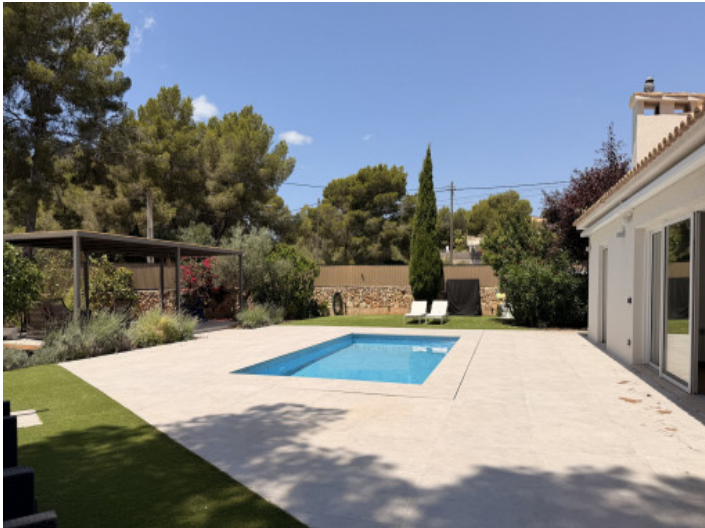
Amplia zona de estar