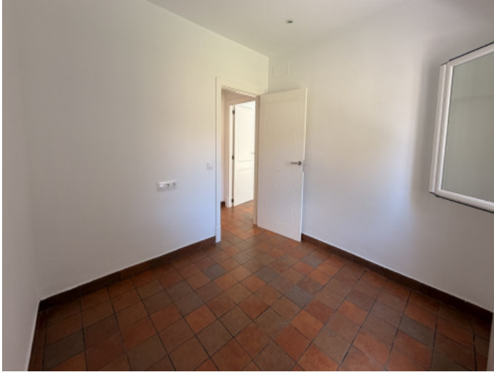
Uno de los tres dormitorios