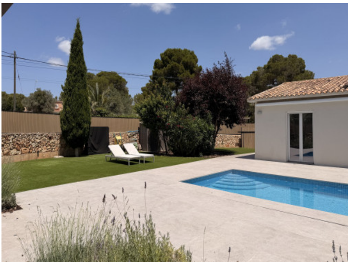
Zona exterior bien cuidada