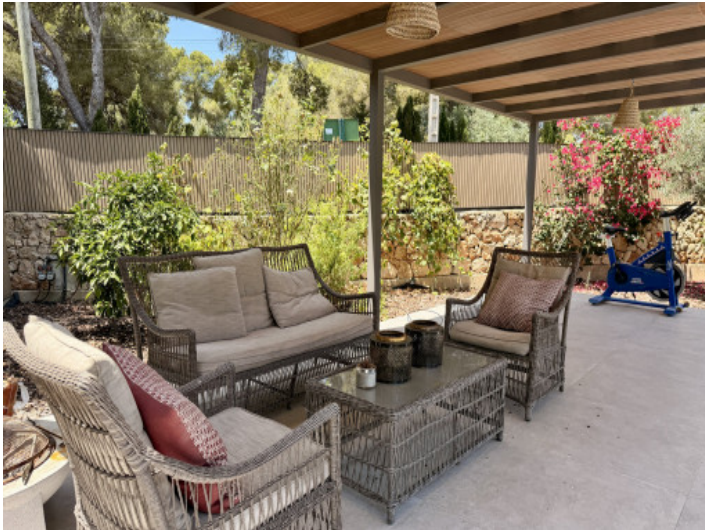
Zona lounge cubierta