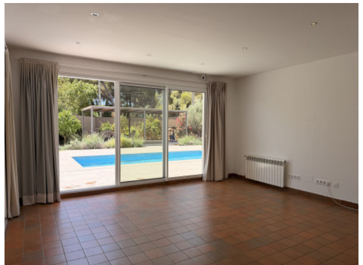
Salón con acceso directo a la terraza

Toda la información como mejor se puede saber, salvo por error durante el periodo de venta. Sirva este documento como un informe previo, las bases legales solo serán válidas a través de un contrato de compra acordado ante Notario.