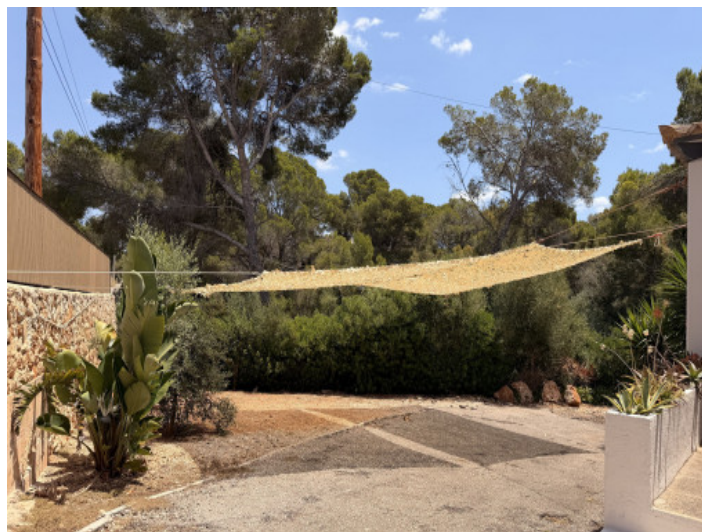
Plaza de aparcamiento exterior