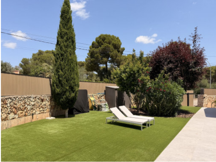
Jardín bien cuidado