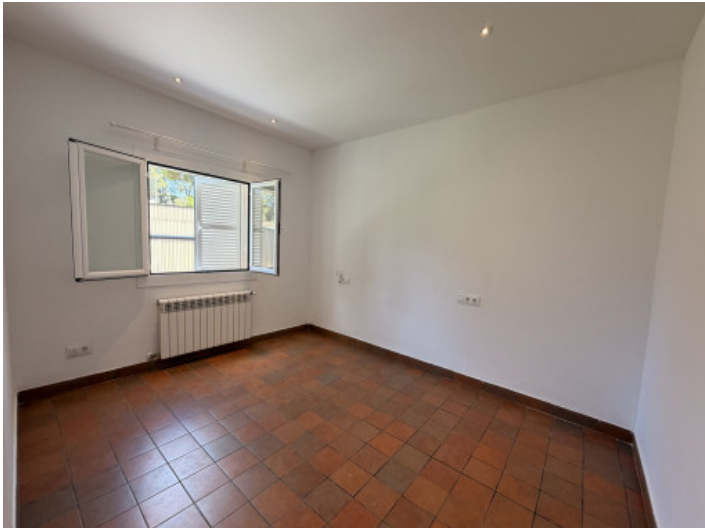
Uno de los tres dormitorios