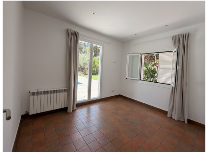
Dormitorio principal con acceso a la terraza