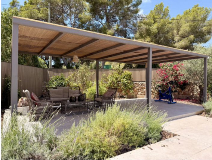
Acogedora zona de estar