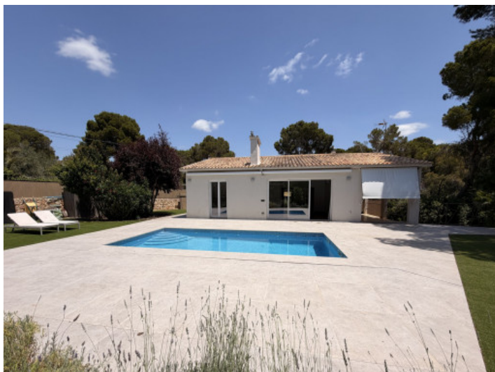
Zona de piscina y terraza