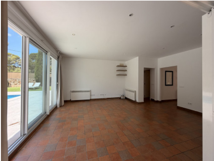
Salón con acceso directo a la terraza