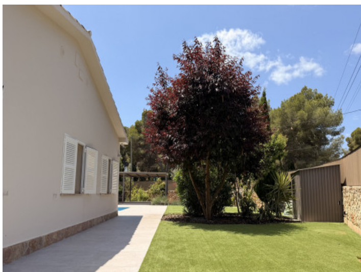
Zona exterior bien cuidada