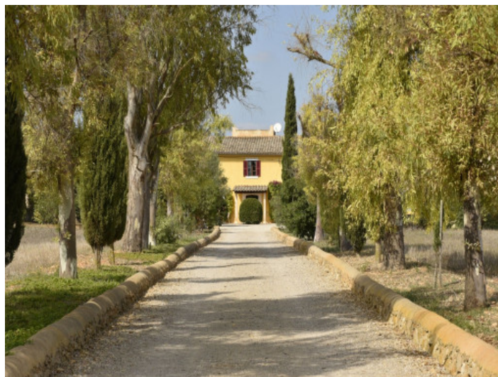
Camino de entrada a la propiedad