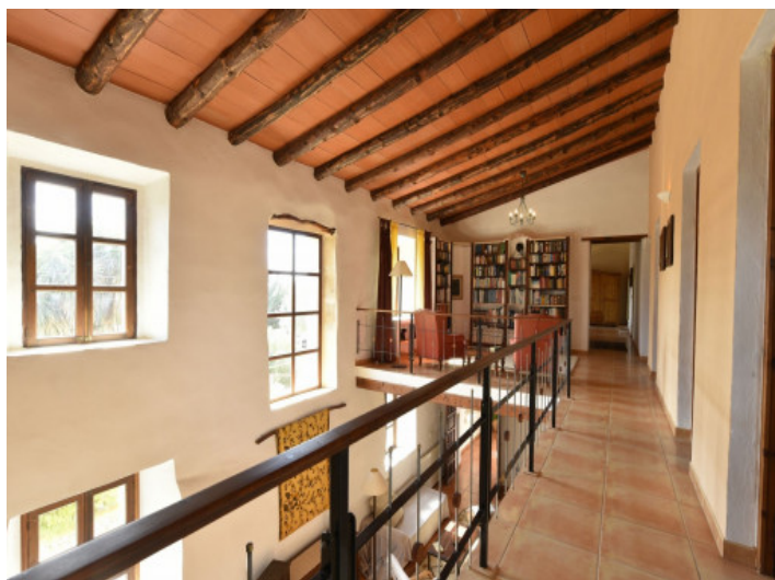
Pasillo primer piso