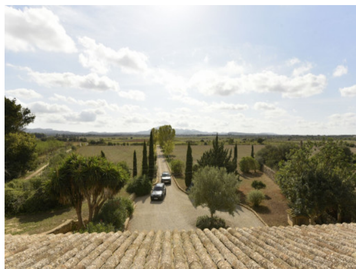
Camino a la finca

Toda la información como mejor se puede saber, salvo por error durante el periodo de venta. Sirva este documento como un informe previo, las bases legales solo serán válidas a través de un contrato de compra acordado ante Notario.