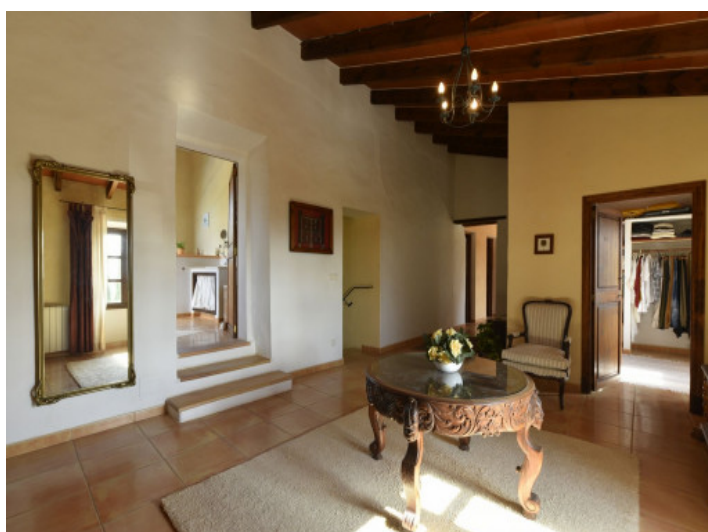
Distribuidor primera planta