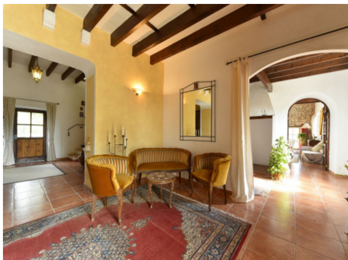
Hall de entrada