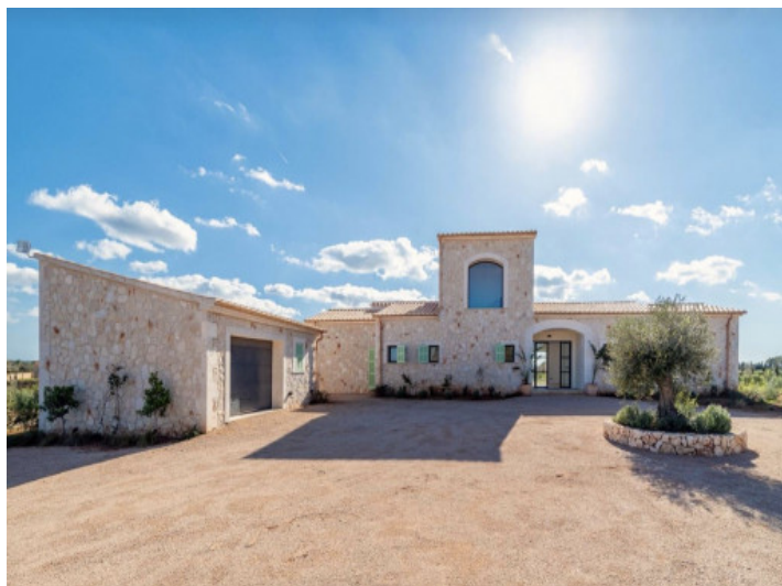
Zona de recepción