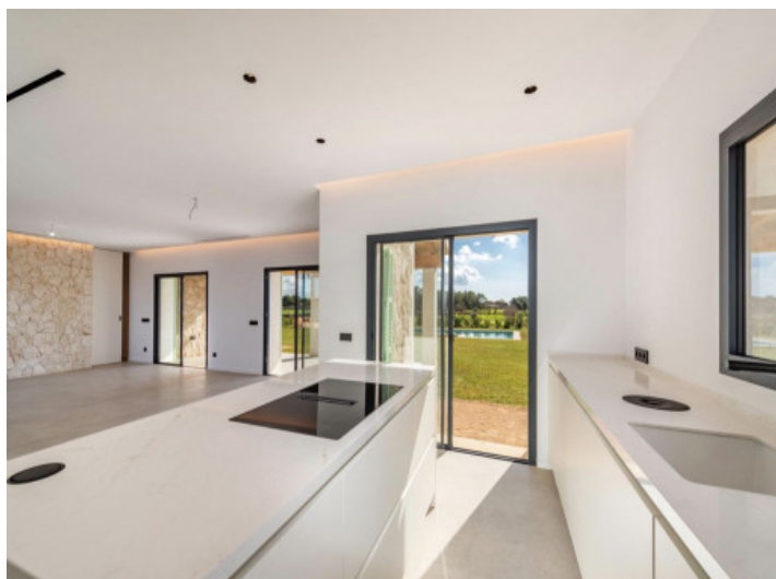
Cocina con vistas al salón y al comedor