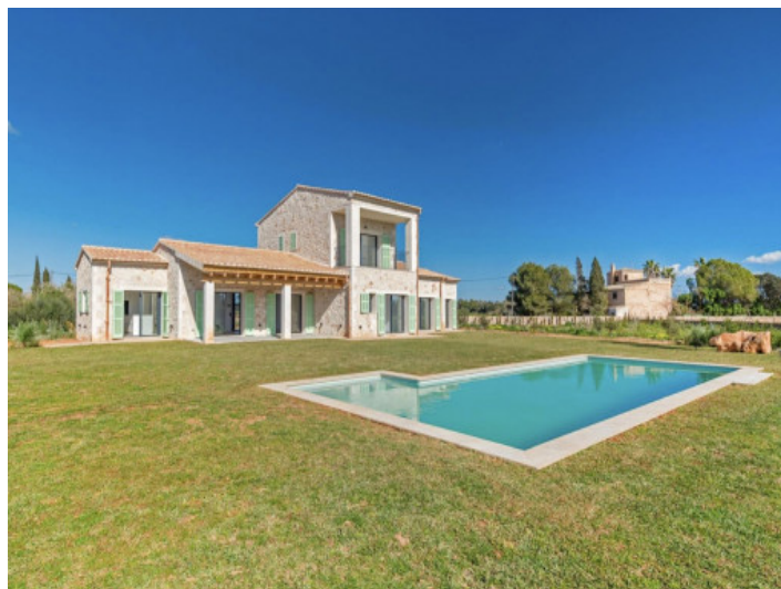
Vista al jardín y la piscina