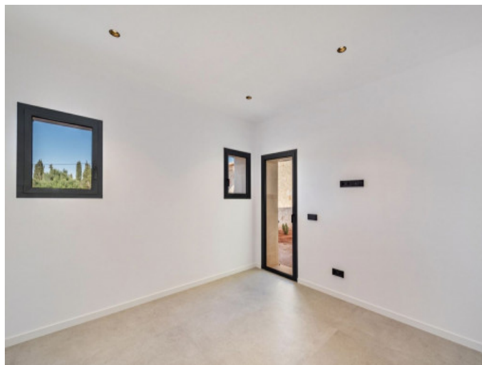
Oficina / 5º dormitorio en la planta baja con salida al patio