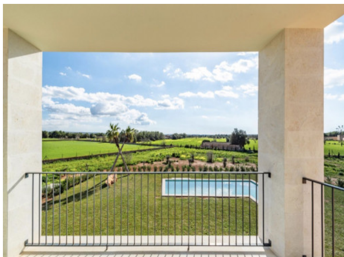
Terraza del dormitorio principal en la primera planta

Toda la información como mejor se puede saber, salvo por error durante el periodo de venta. Sirva este documento como un informe previo, las bases legales solo serán válidas a través de un contrato de compra acordado ante Notario.