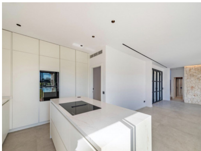
Cocina con vistas al trastero a la izquierda y al acceso principal a la derecha

Toda la información como mejor se puede saber, salvo por error durante el periodo de venta. Sirva este documento como un informe previo, las bases legales solo serán válidas a partir de un contrato de compra acordado ante Notario.