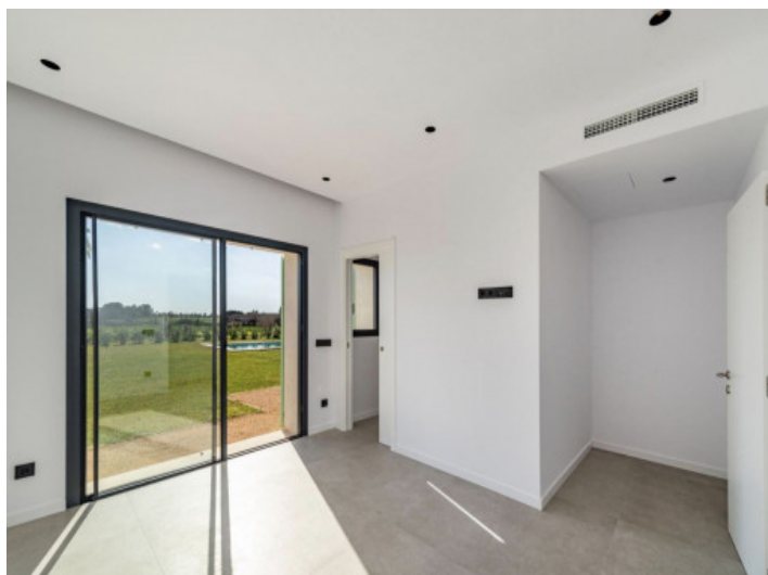
Segundo dormitorio en la planta baja a la derecha, con nicho para armario