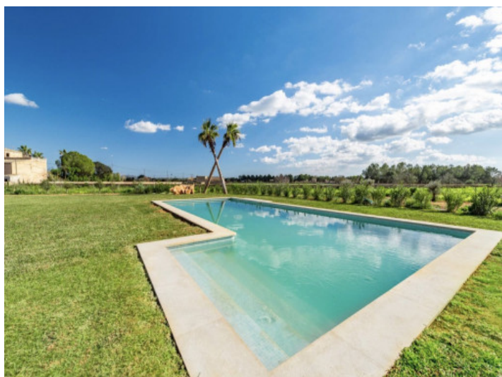
Piscina de 64 m 2 con acceso mediante escalera