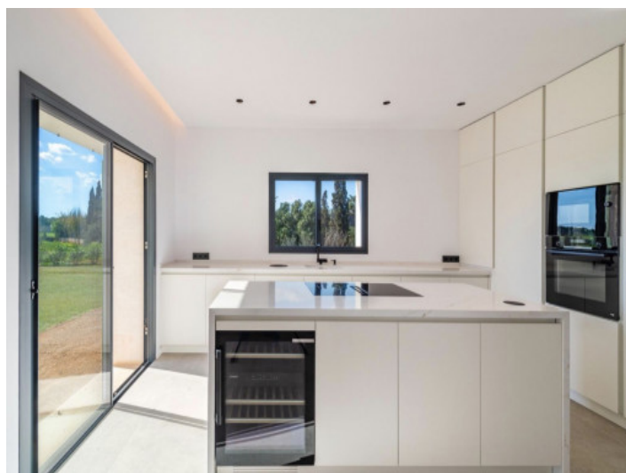
Cocina equipada con isla central