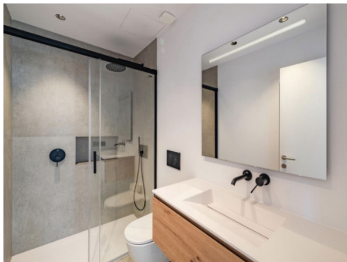
Baño en suite del dormitorio principal