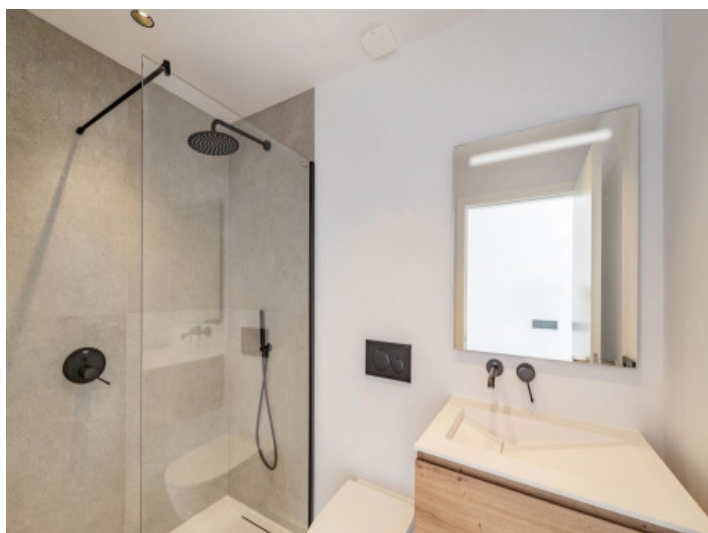
Quinto baño en la planta baja