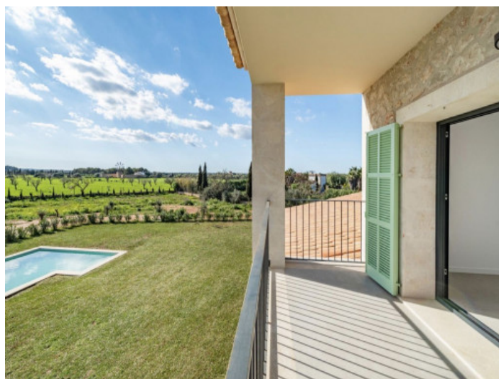
Terraza del dormitorio principal en la primera planta