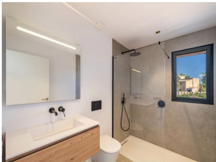
Baño en suite del tercer dormitorio