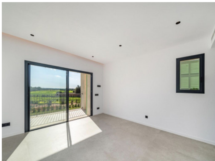
Suite principal en la planta superior