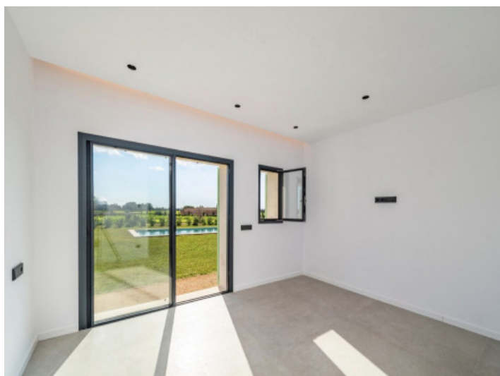
Primer dormitorio en la planta baja