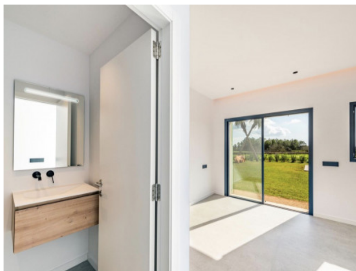
Baño en suite del primer dormitorio