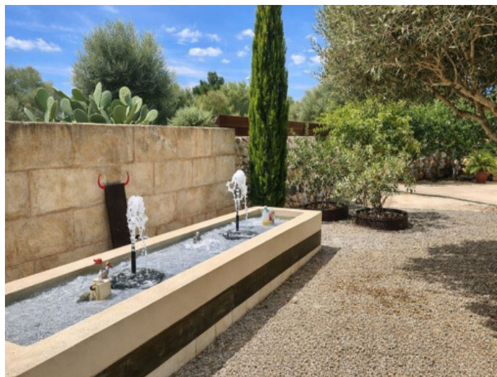
Fuente en el jardín