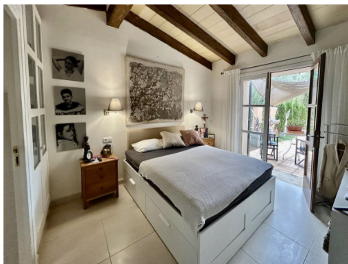
Dormitorio en la planta baja