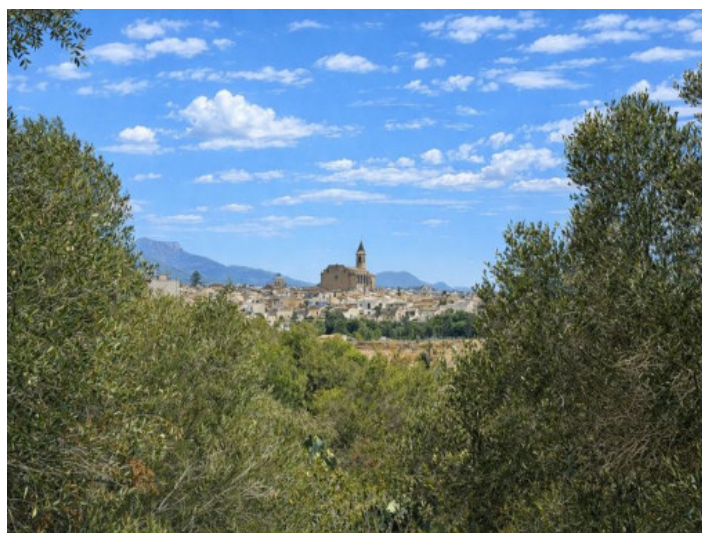
Vista hacia Santanyi