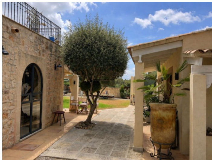
Zona de entrada