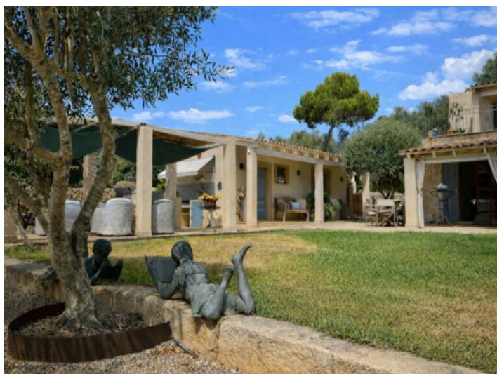
Vista de la casa de huéspedes