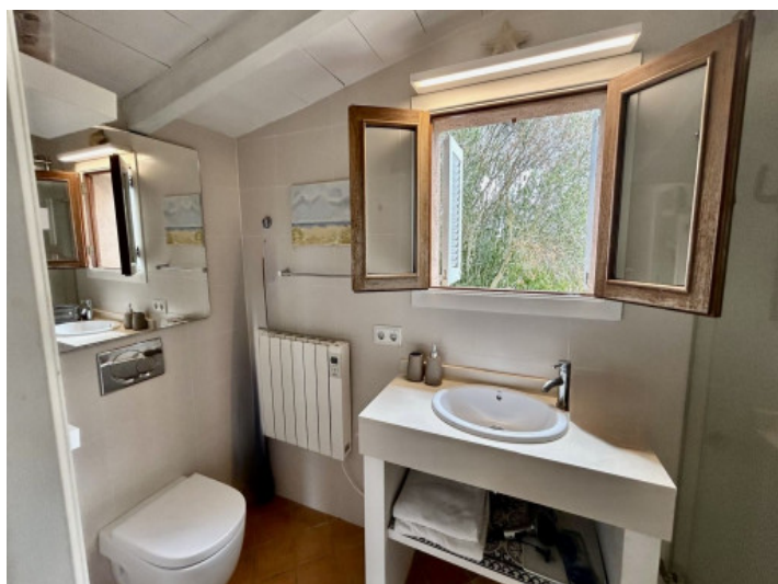
Baño en suite en el primer piso