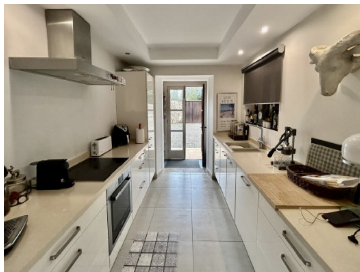
Cocina totalmente equipada

Toda la información como mejor se puede saber, salvo por error durante el periodo de venta. Sirva este documento como un informe previo, las bases legales solo serán validas a traves de un contrato de compra acordado ante Notario.