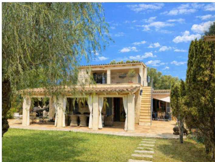
Vista al jardín