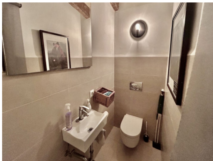
Aseo de invitados

Toda la información como mejor se puede saber, salvo por error durante el periodo de venta. Sirva este documento como un informe previo, las bases legales solo serán válidas a través de un contrato de compra acordado ante Notario.