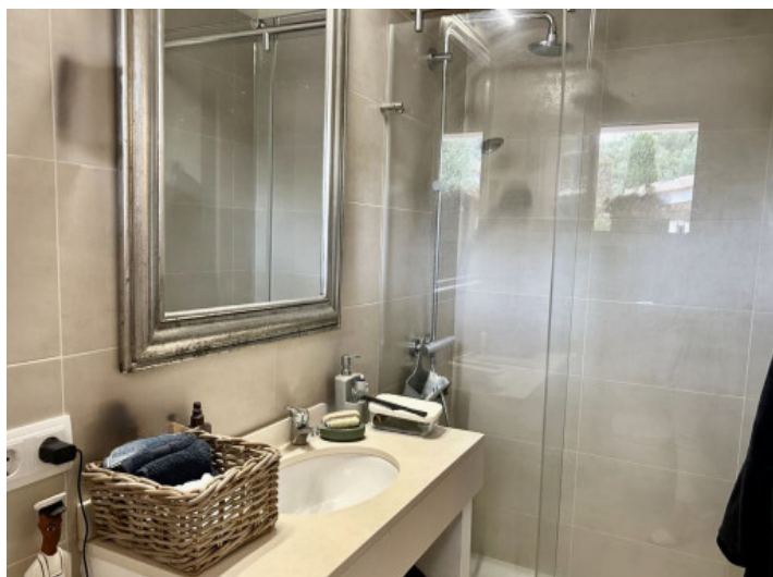
Baño en suite en la planta baja.