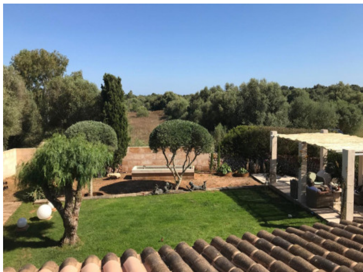
Vista desde el balcón