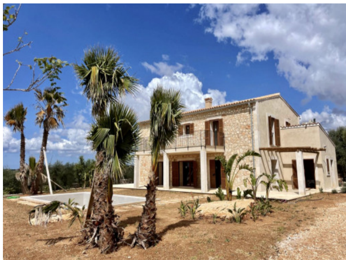
Vista al jardín