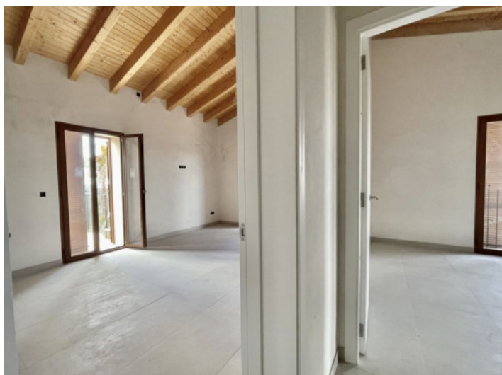
Dormitorio principal a la izquierda y tercer dormitorio a la derecha