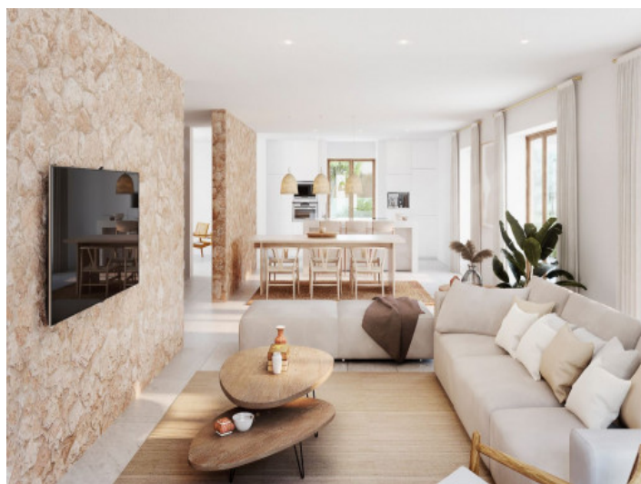
Sala y comedor