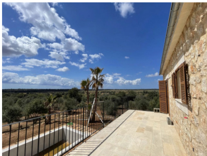
Vista desde la terraza

Toda la información como mejor se puede saber, salvo por error durante el periodo de venta. Sirva este documento como un informe previo, las bases legales solo serán válidas a través de un contrato de compra acordado ante Notario.