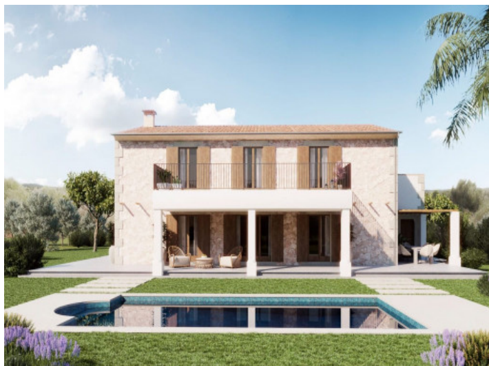
Vista al jardín