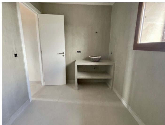
Baño en suite, segundo dormitorio