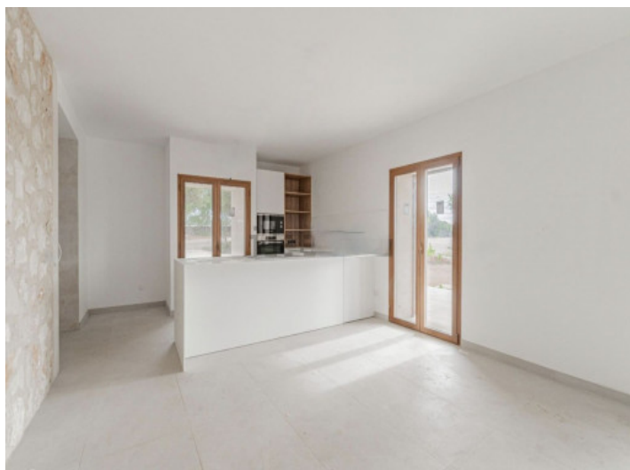
Cocina con isla de cocina