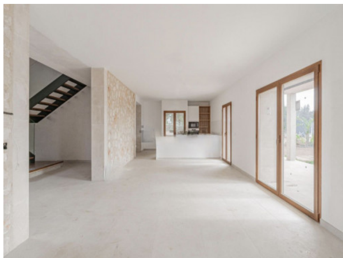
Sala y comedor

Toda la información como mejor se puede saber, salvo por error durante el periodo de venta. Sirva este documento como un informe previo, las bases legales solo serán validas a traves de un contrato de compra acordado ante Notario.