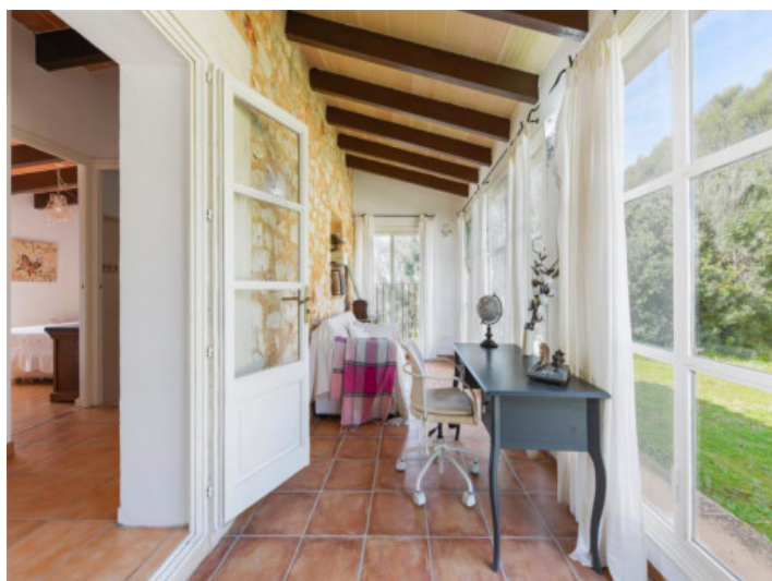
Jardín de invierno