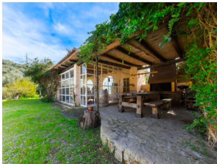
Casa de invitados