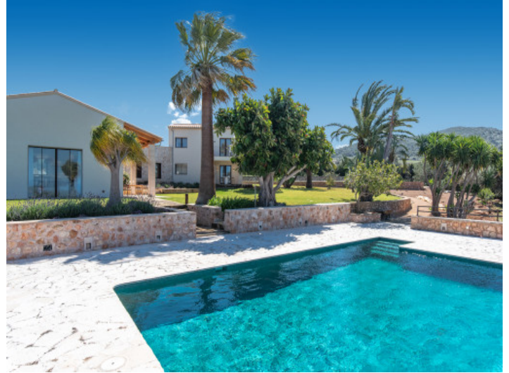
Amplia piscina de agua salada con terraza solárium