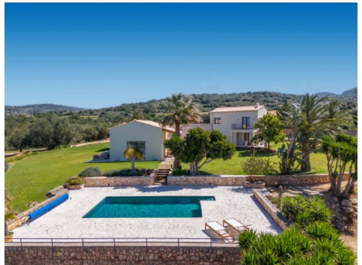
Finca de lujo con pista de tenis, vistas al mar y absoluta privacidad en una