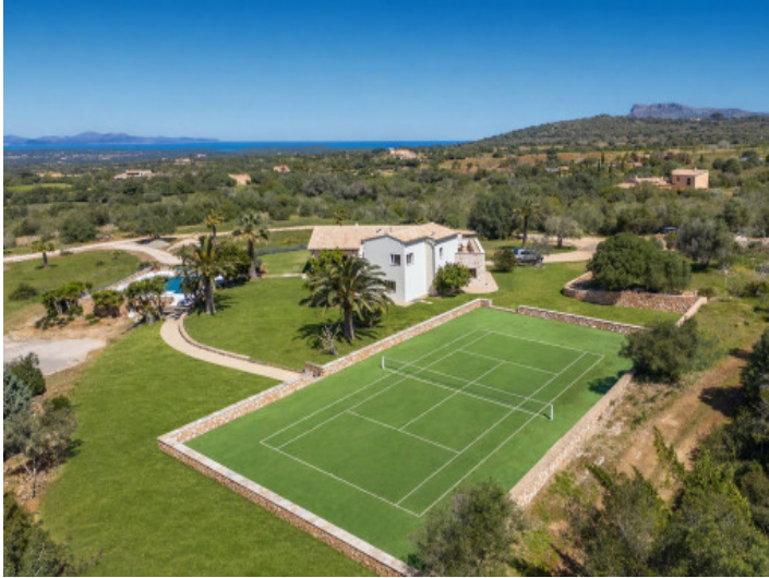
Finca con pista de tenis y vistas al mar entre Manacor y Colònia de Sant