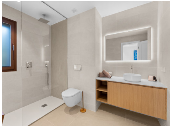
Baño moderno en suite