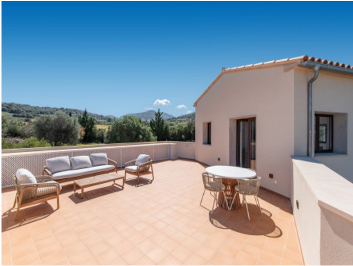
...y terraza privada con vistas panorámicas