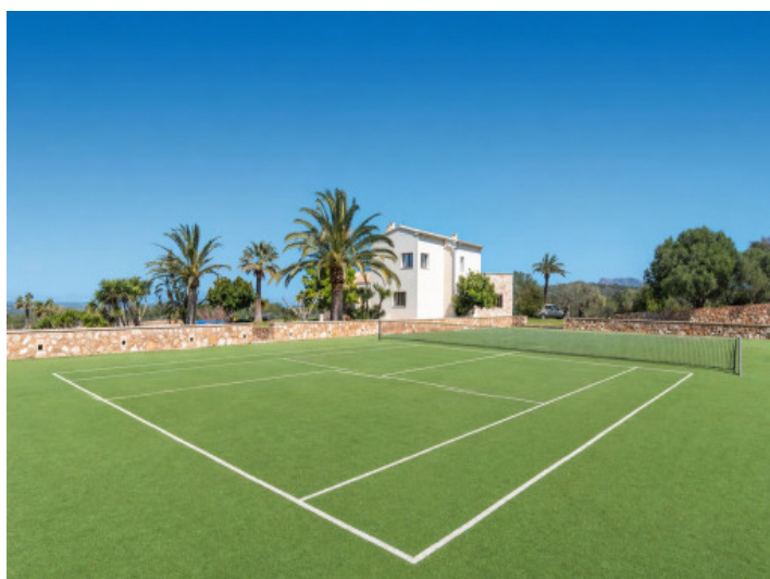
Finca con pista de tenis y vistas al mar entre Manacor y Colònia de Sant

Toda la información como mejor se puede saber, salvo por error durante el periodo de venta. Sirva este documento como un informe previo, las bases legales solo serán válidas a través de un contrato de compra acordado ante Notario.