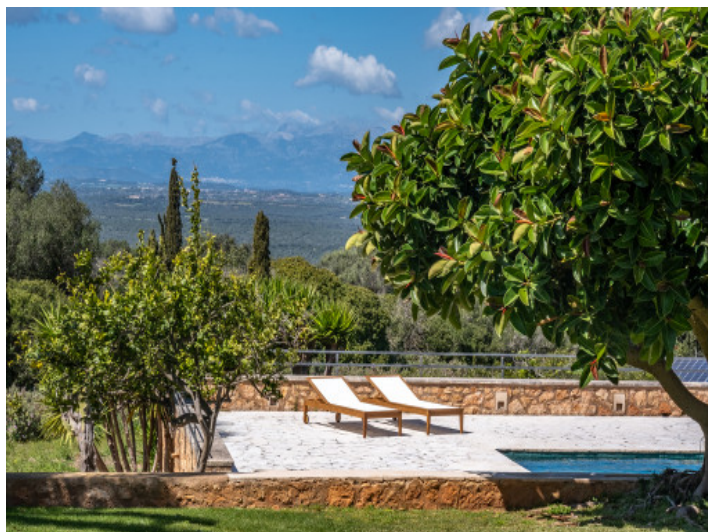
Jardín mediterráneo con total privacidad