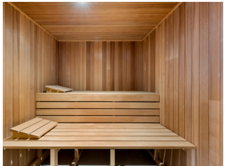
Zona wellness con sauna

Toda la información como mejor se puede saber, salvo por error durante el periodo de venta. Sirva este documento como un informe previo, las bases legales solo serán válidas a través de un contrato de compra acordado ante Notario.