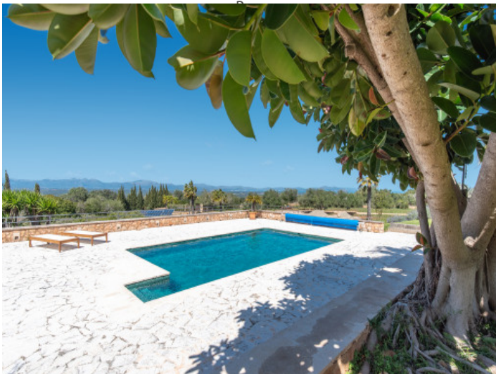
Finca mediterránea de lujo con pista de tenis, zona wellness y