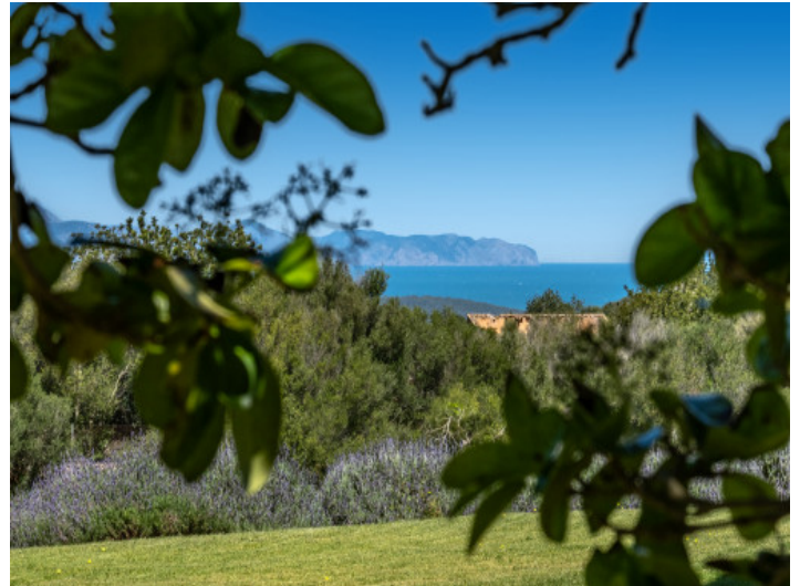
Naturaleza y vistas abiertas