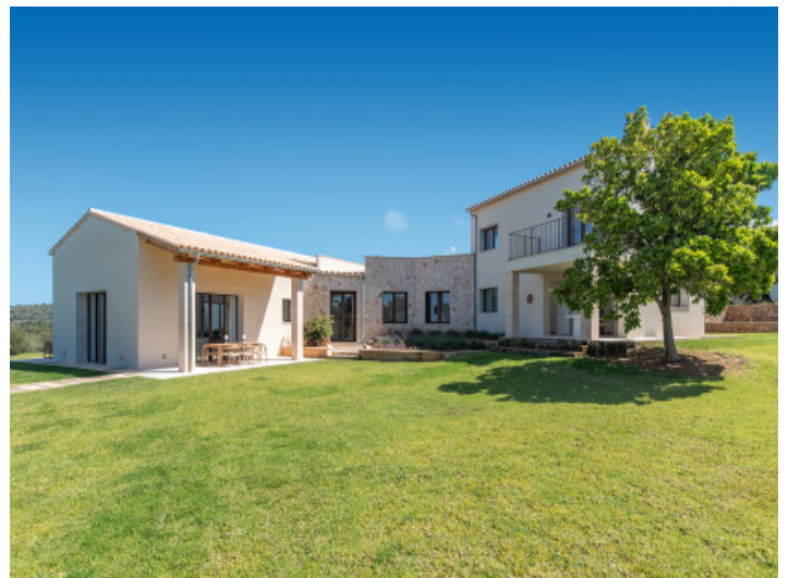
Zonas exteriores ideales para el descanso y reuniones sociales

Toda la información como mejor se puede saber, salvo por error durante el periodo de venta. Sirva este documento como un informe previo, las bases legales solo serán válidas a través de un contrato de compra acordado ante Notario.