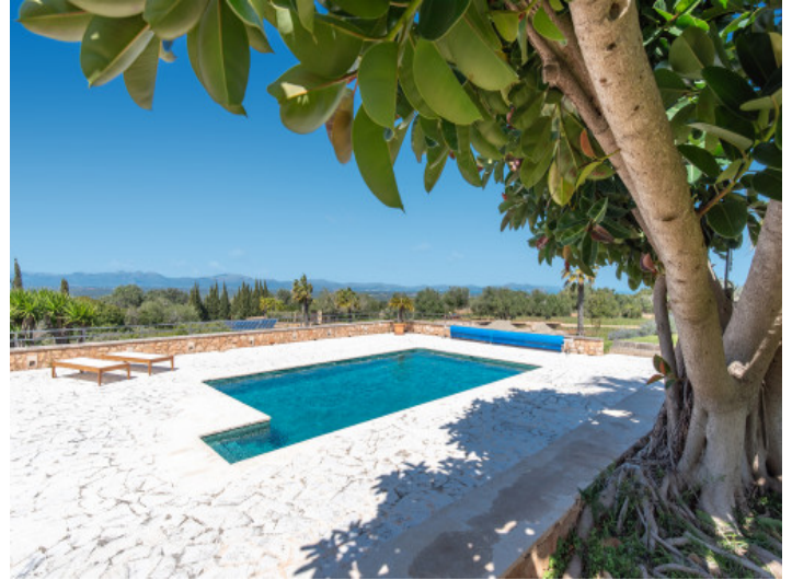
Finca mediterránea de lujo con pista de tenis, zona wellness y