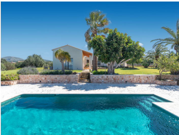
Amplia piscina de agua salada con terraza