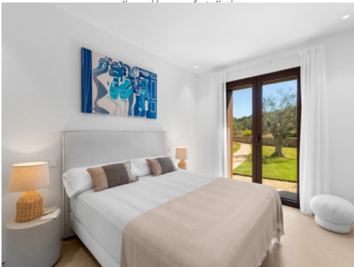
Uno de los 4 dormitorios con baño en suite y acceso al jardín