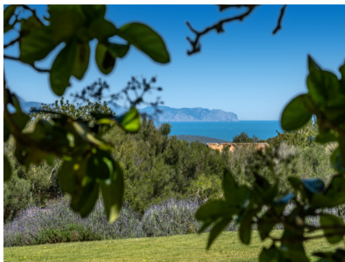
Naturaleza y vistas abiertas