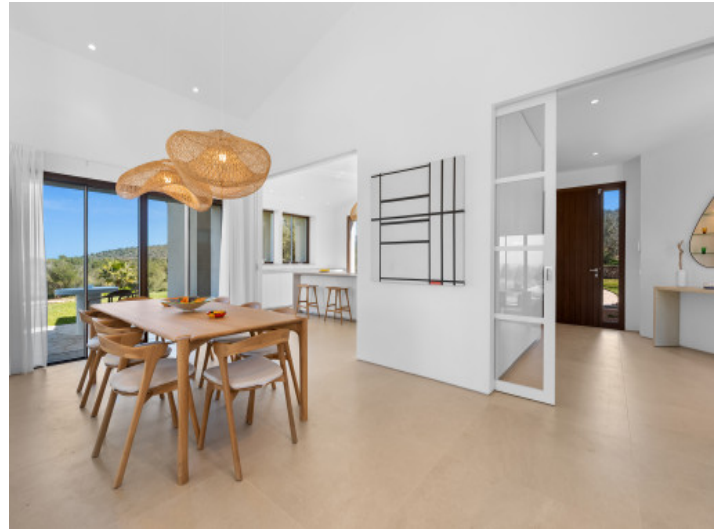
Comedor con acceso directo a la terraza