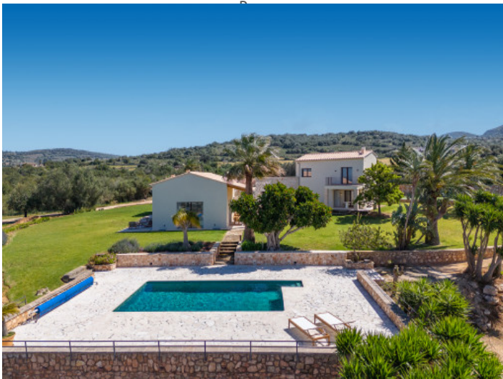
Finca de lujo con pista de tenis, vistas al mar y absoluta privacidad en una