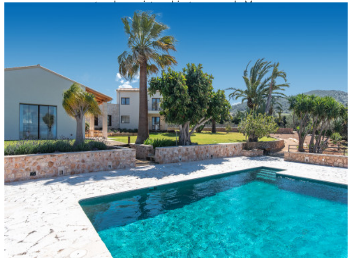
Amplia piscina de agua salada con terraza solárium