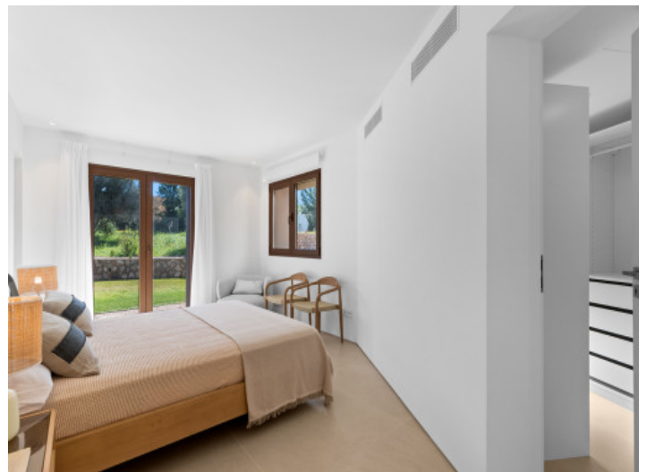
Uno de los 4 dormitorios con baño en suite y vestidor

Toda la información como mejor se puede saber, salvo por error durante el periodo de venta. Sirva este documento como un informe previo, las bases legales solo serán válidas a través de un contrato de compra acordado ante Notario.