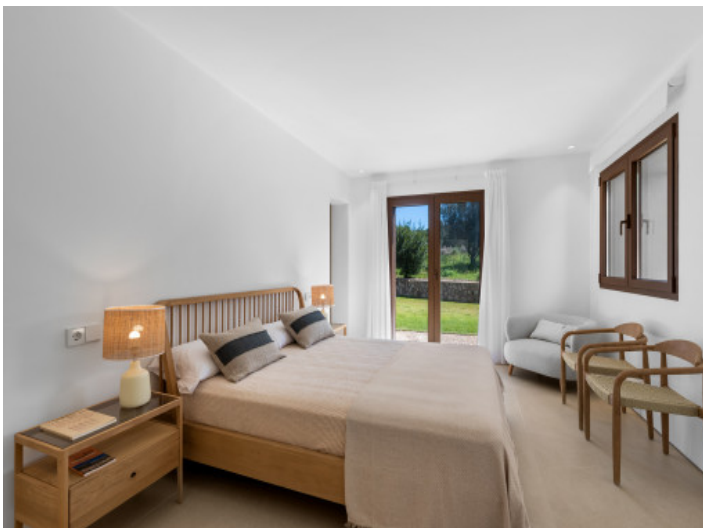
Uno de los 4 dormitorios con baño en suite y acceso al jardín