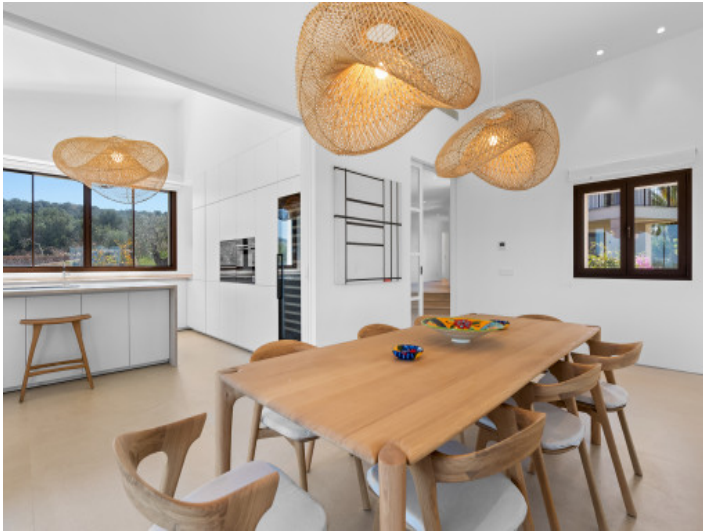
Cocina independiente y cerrable de alta gama, ideal para máxima