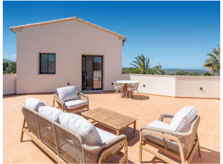
Terraza privada de la suite principal