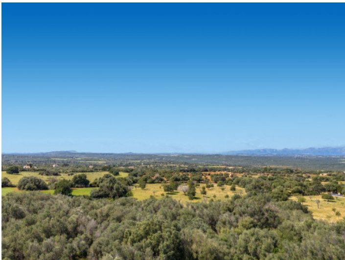
Impresionantes vistas panorámicas