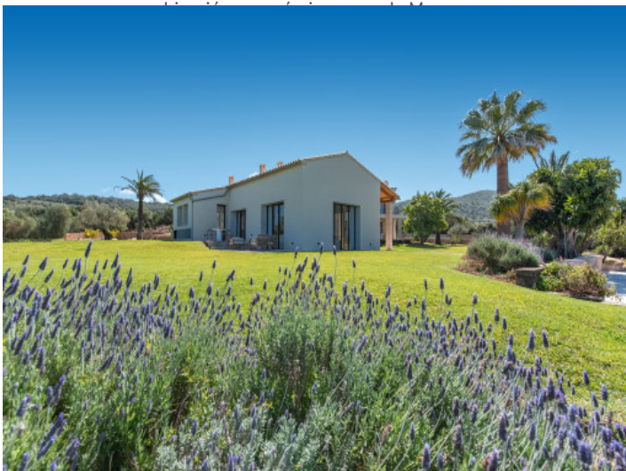
Jardín mediterráneo con total privacidad