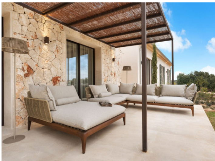
Terraza mediterránea con vistas a la naturaleza