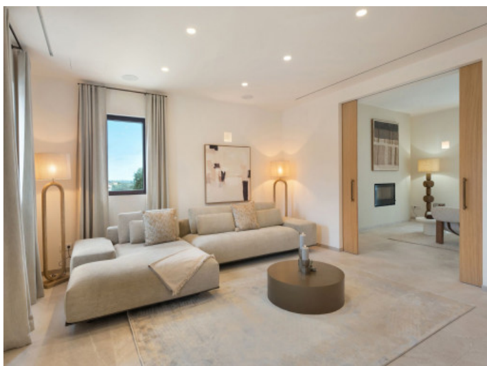
Salón mediterráneo con vistas a la chimenea