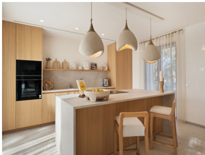
Amplia cocina moderna y luminosa