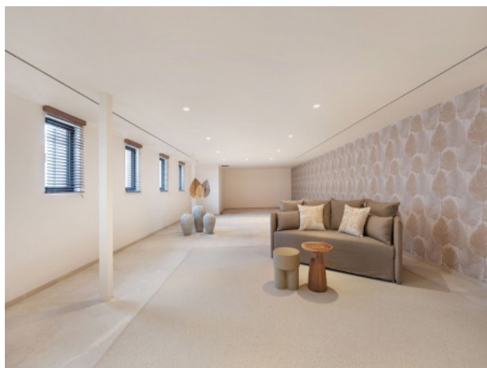
Sala en el sótano ideal para gimnasio o sauna