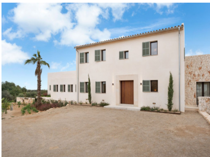
Elegante vista frontal