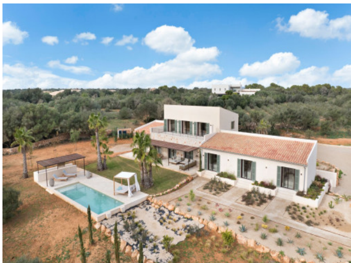
Vista aérea del jardín y la piscina