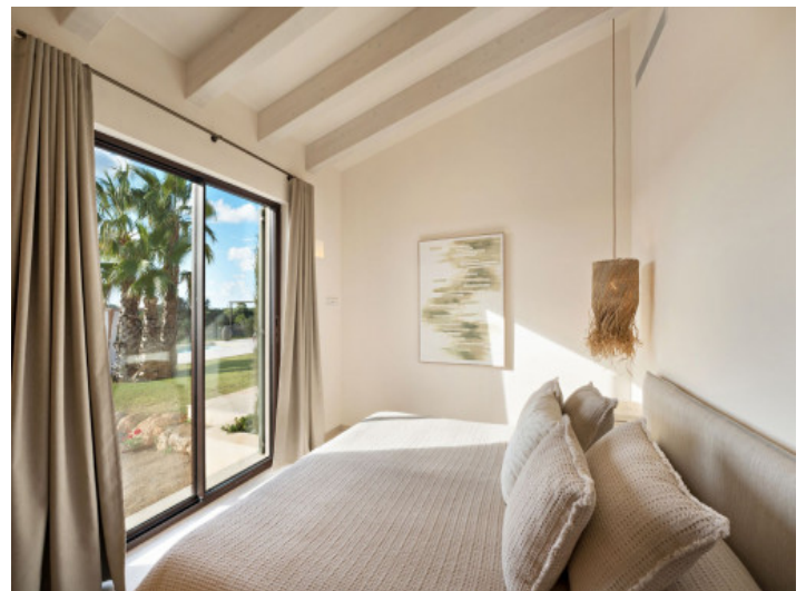
Cómodo dormitorio con acceso fácil en planta baja

Toda la información como mejor se puede saber, salvo por error durante el periodo de venta. Sirva este documento como un informe previo, las bases legales solo serán válidas a través de un contrato de compra acordado ante Notario.