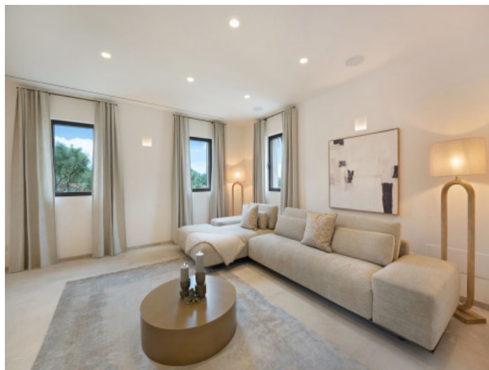
Espacioso salón con carácter mediterráneo