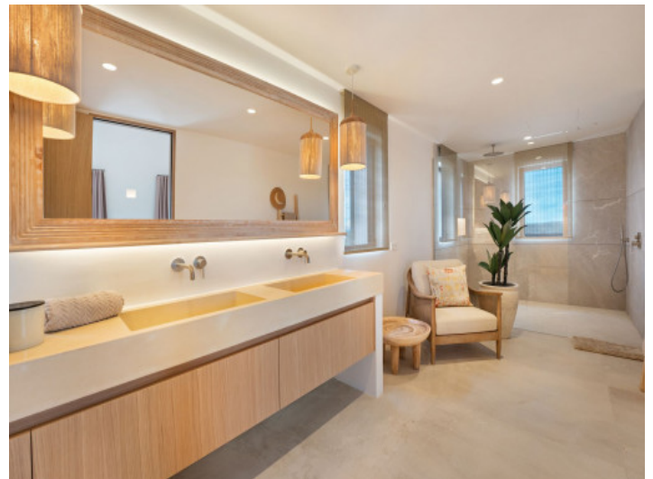
Elegante baño en suite principal