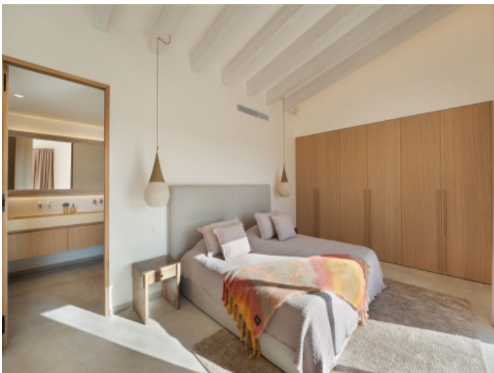
Cómodo dormitorio con acceso fácil en planta baja