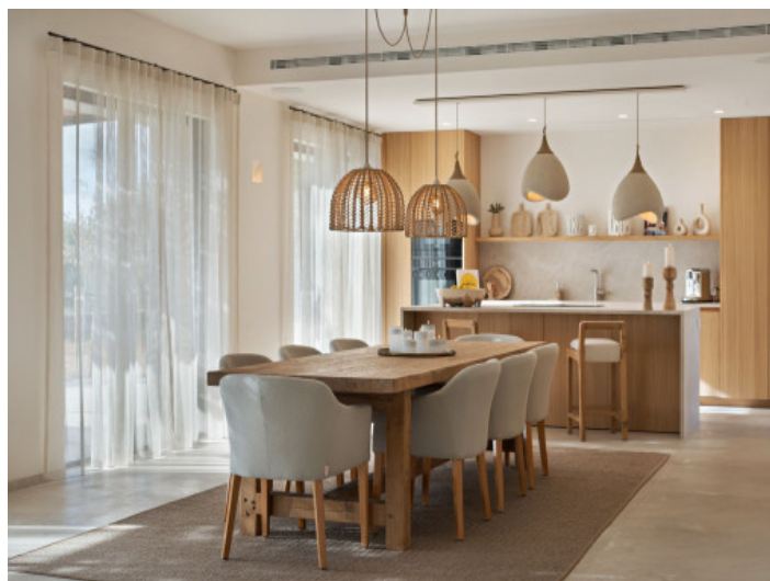
Espacioso comedor con elegante cocinan

Toda la información como mejor se puede saber, salvo por error durante el periodo de venta. Sirva este documento como un informe previo, las bases legales solo serán válidas a través de un contrato de compra acordado ante Notario.