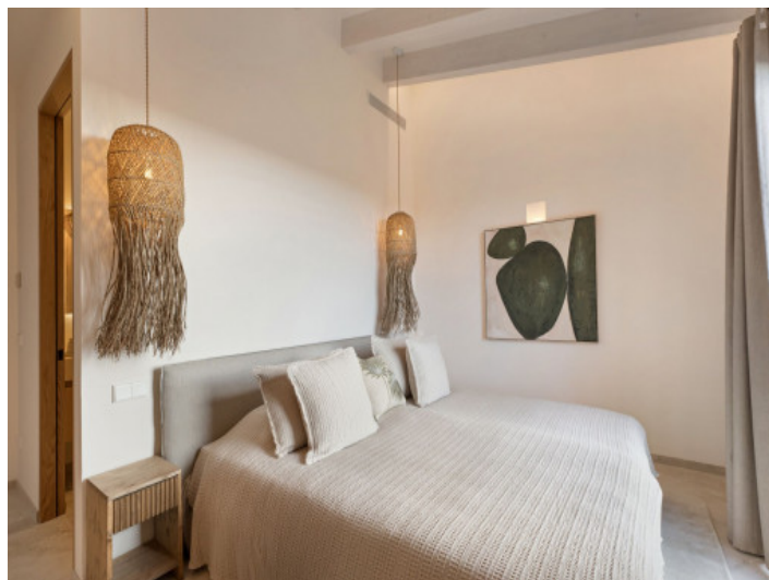
Exclusivo dormitorio en la planta baja