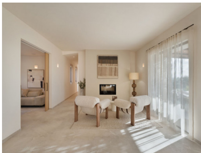
Espaciosa sala de estar con chimenea