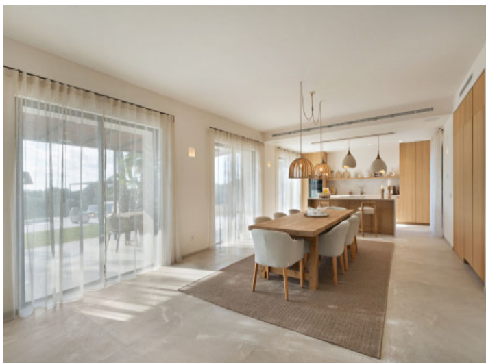
Comedor con cocina abierta