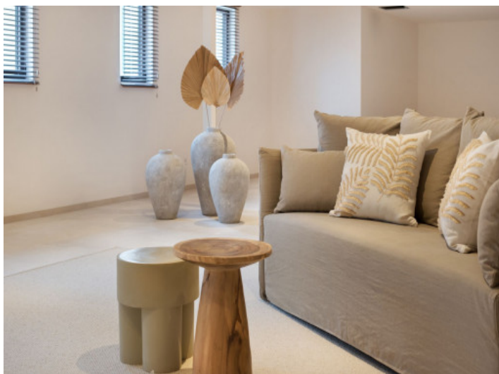
Habitación con calefacción y aire acondicionado