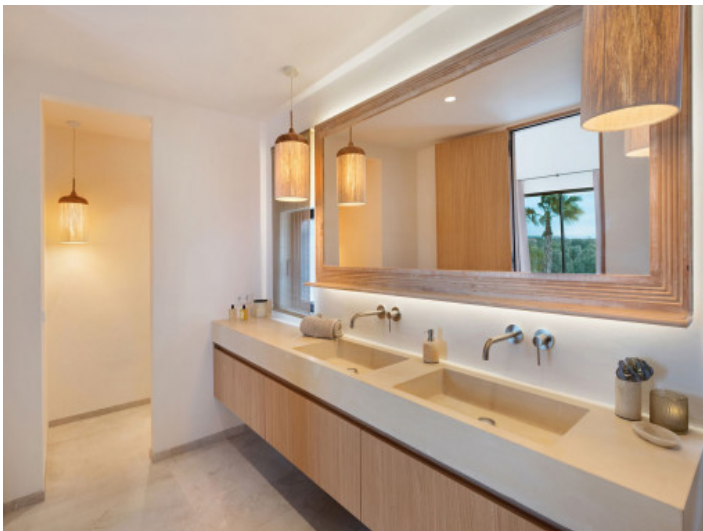
Elegante baño en suite principal