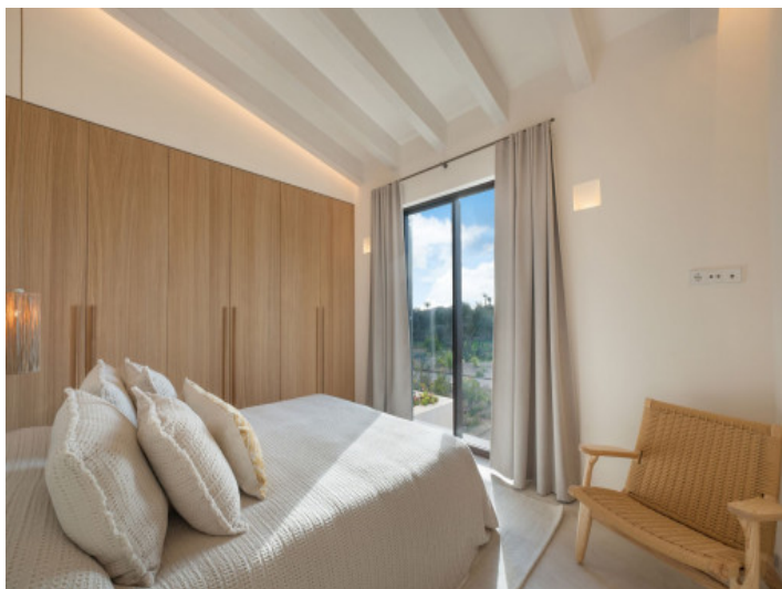
Exclusivo dormitorio en la planta baja