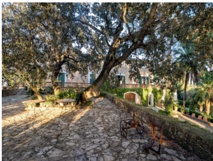
Acogedora terraza de la casa principal