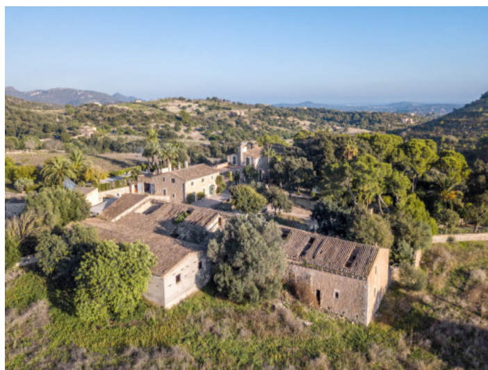
Vista aérea de los alrededores