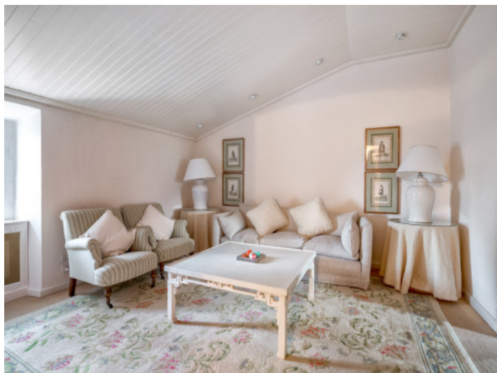
Encantadora y pequeña área de estar