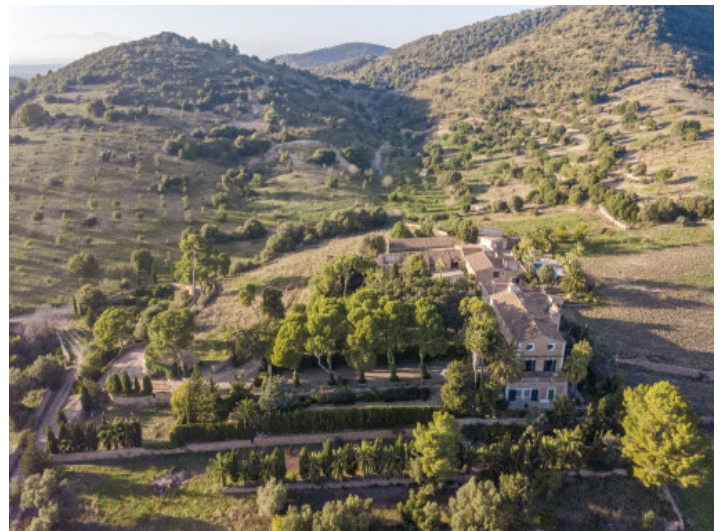
Vista aérea de la propiedad