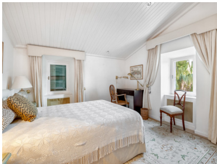
Uno de 10 dormitorios