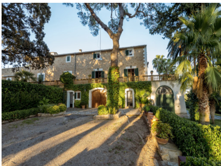
Entrada rústica de la casa principal