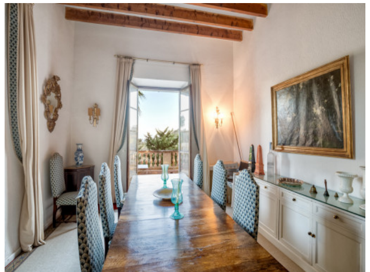
Comedor con muebles de madera

Toda la información como mejor se puede saber, salvo por error durante el periodo de venta. Sirva este documento como un informe previo, las bases legales solo serán válidas a través de un contrato de compra acordado ante Notario.