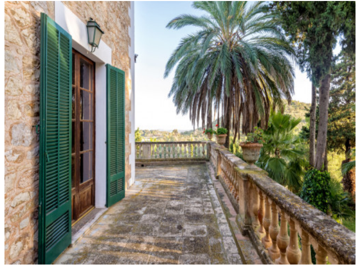
Una amplia terraza rodea la casa principal