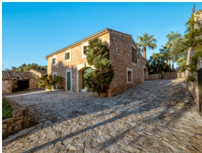
Vista exterior de un edificio lateral