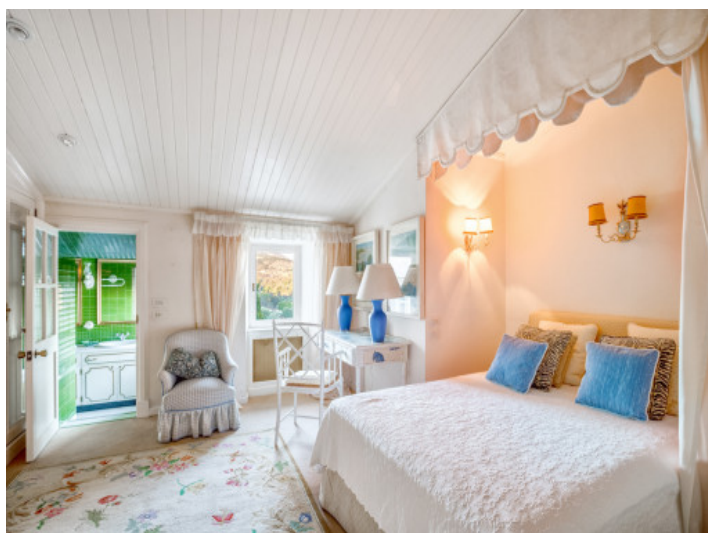
Uno de 10 dormitorios