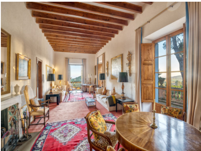
Cómoda área de estar con vigas de madera