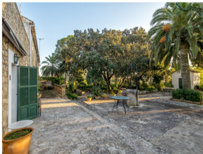
Amplia área exterior

Toda la información como mejor se puede saber, salvo por error durante el periodo de venta. Sirva este documento como un informe previo, las bases legales solo serán válidas a través de un contrato de compra acordado ante Notario.