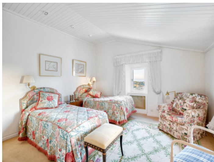
Precioso dormitorio doble