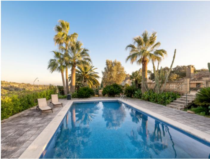
Hermosa finca rústica con piscina en Sant Llorenç