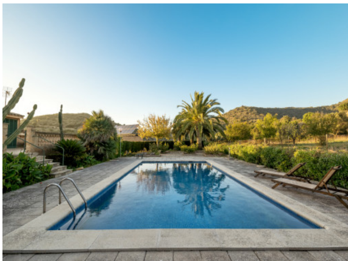
Idílica área de piscina con hamacas