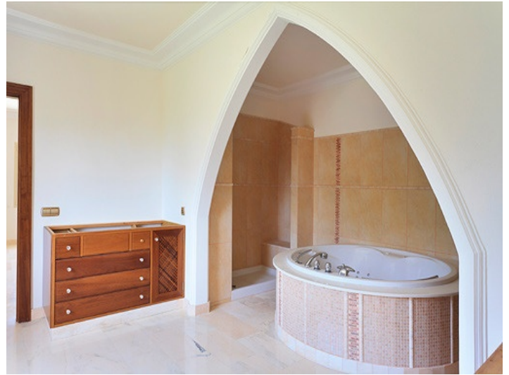
Yacuzzi en el baño de la planta baja