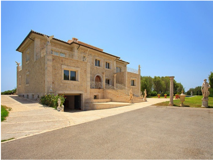
Zona de spa en el sótano