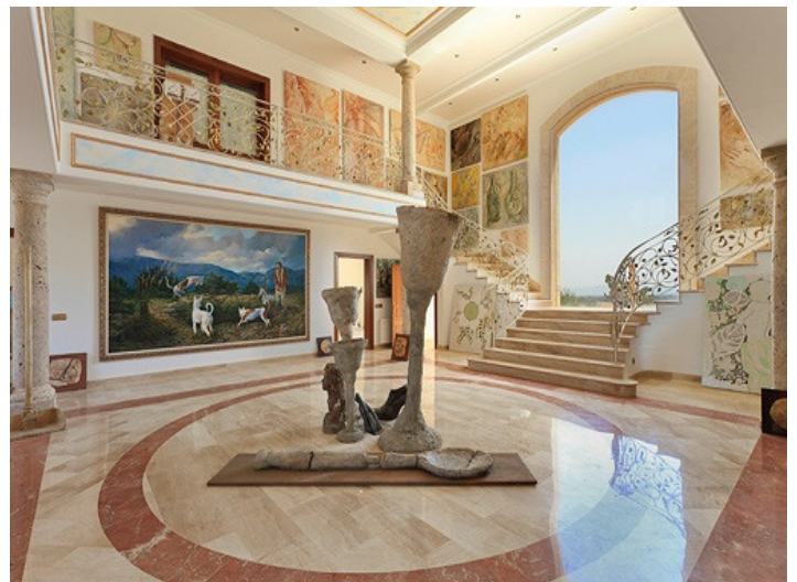
Exclusivo dormitorios doble en la planta baja

Toda la información como mejor se puede saber, salvo por error durante el periodo de venta. Sirva este documento como un informe previo, las bases legales solo serán válidas a través de un contrato de compra acordado ante Notario.