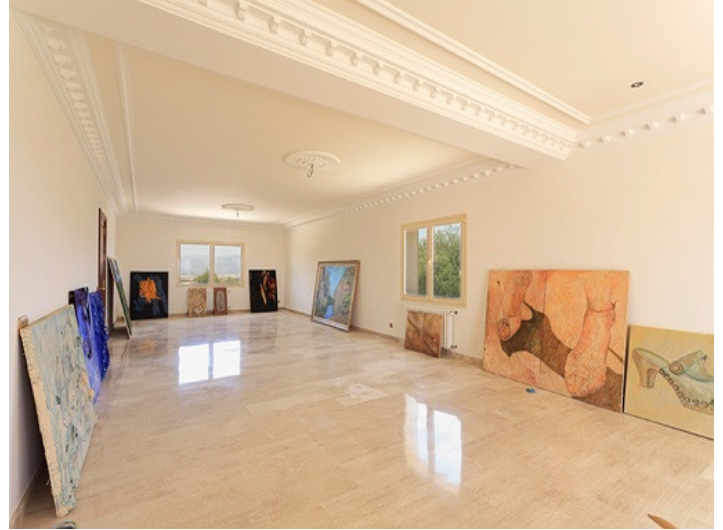
Cada uno de los dormitorios del primer piso tiene dos terrazas