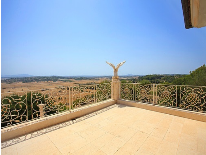
Vista frontal de la mansión