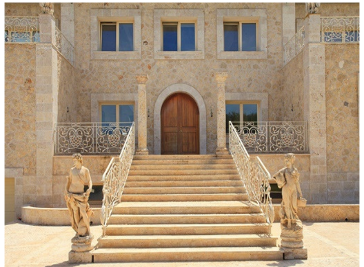
Impresionante escalera da acceso a la propiedad