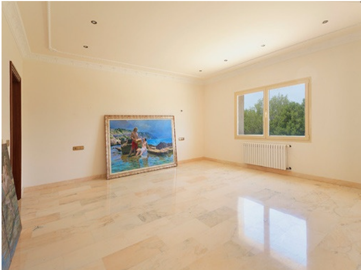
Bajo de la cúpula impresiona un fresco