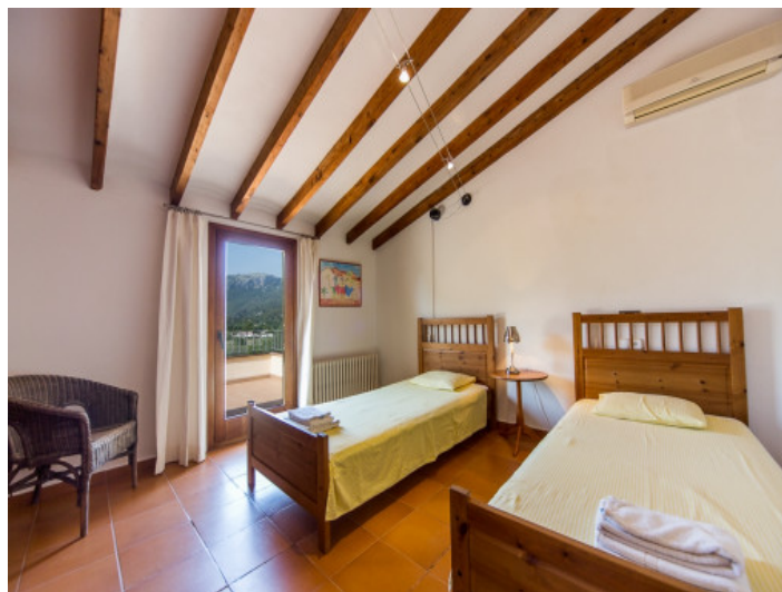
Dormitorio con aire acondicionado