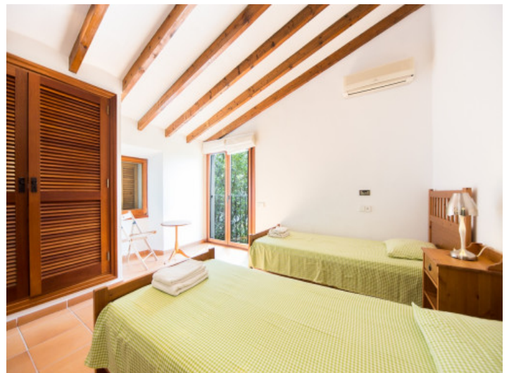
Dormitorio con armario empotrado

Toda la información como mejor se puede saber, salvo por error durante el periodo de venta. Sirva este documento como un informe previo, las bases legales solo serán válidas a través de un contrato de compra acordado ante Notario.