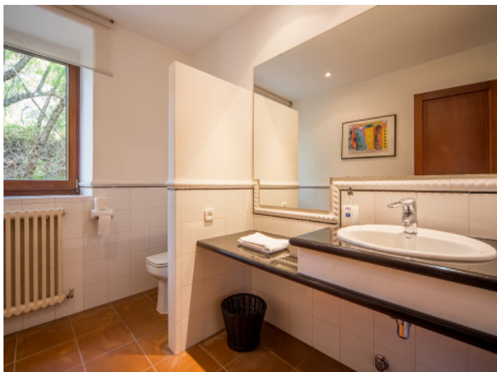
Baño con calefacción