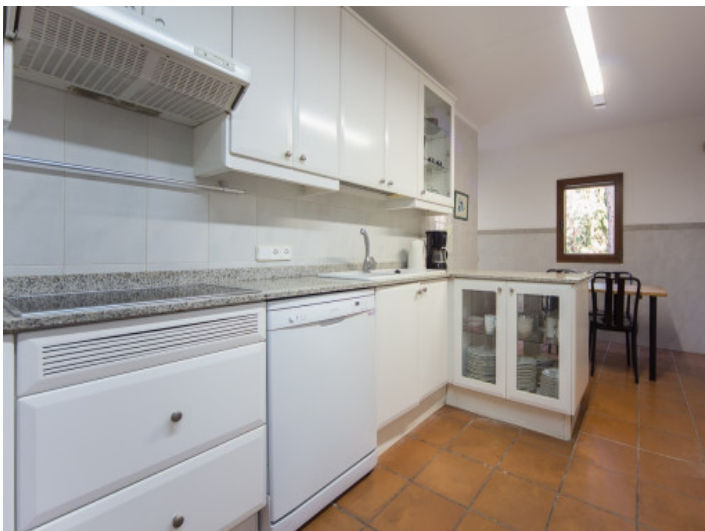
Cocina total equipada