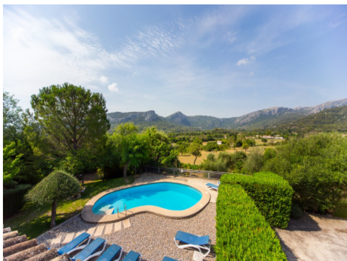
Vistas unicas al campo