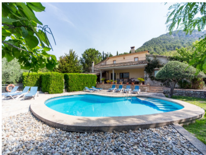
Área de piscina idílica