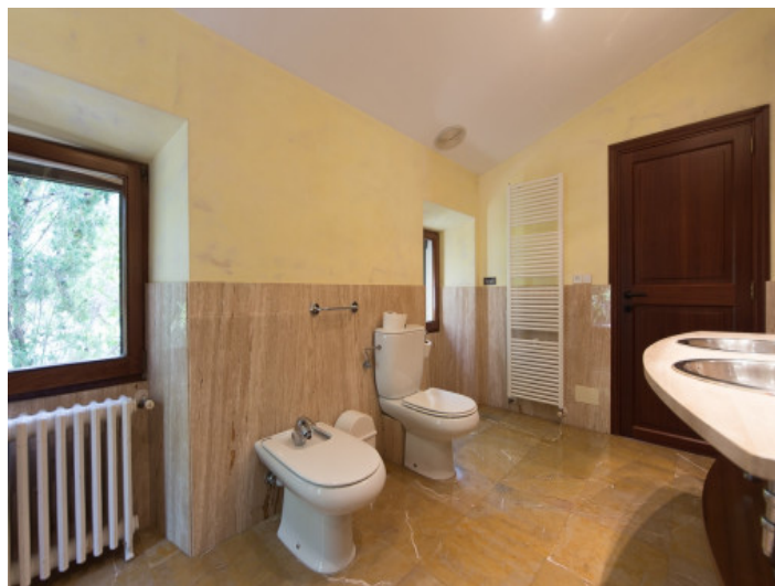
Baño con luz natural