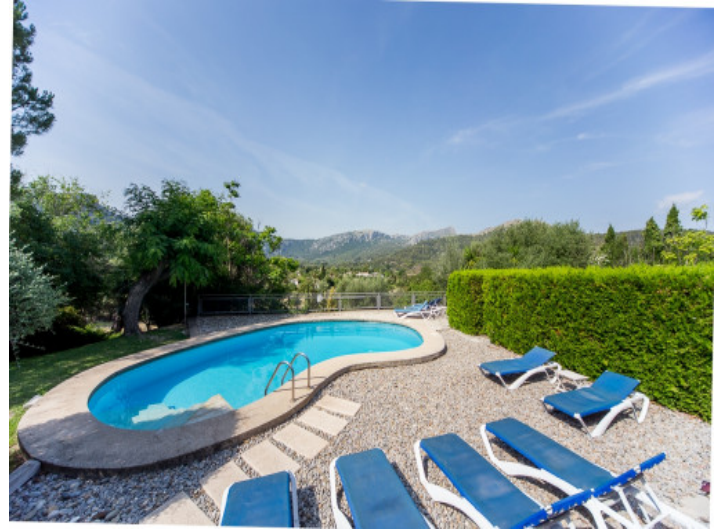
Piscina está rodeada con una terraza