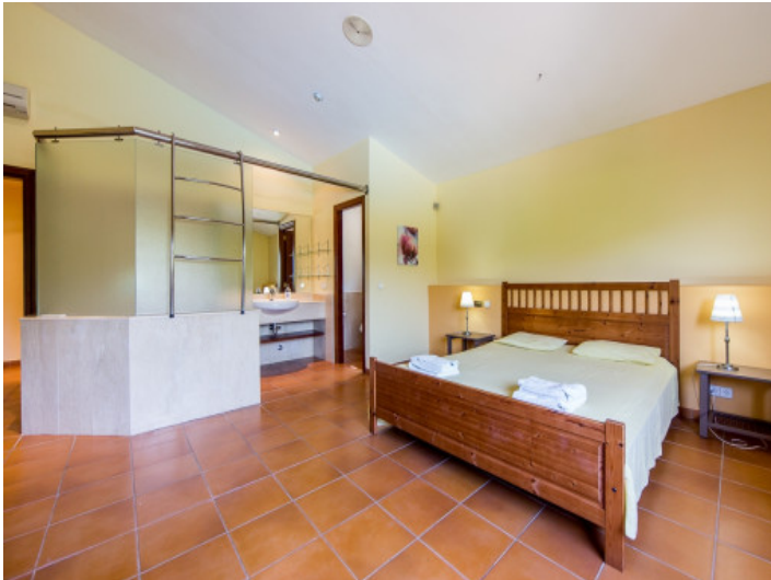
Dormitorio con baño en suite