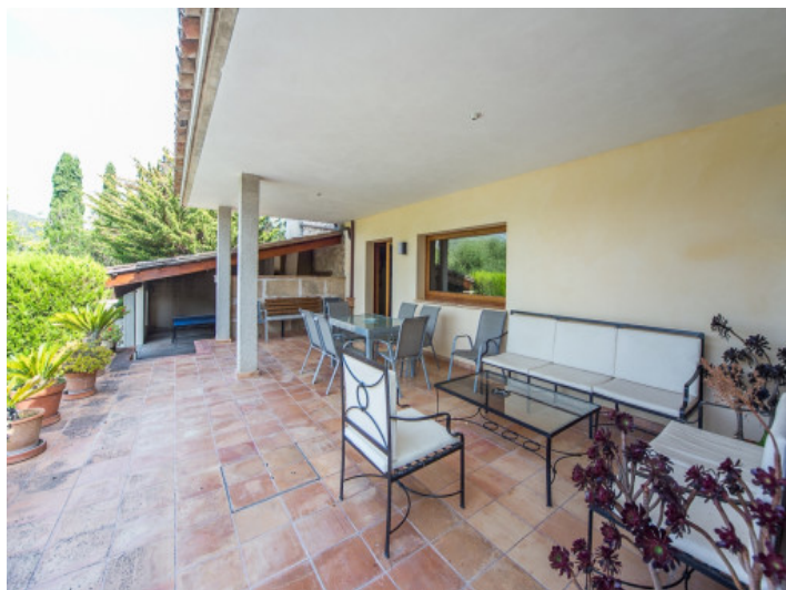
Terraza cubierta con área de comer