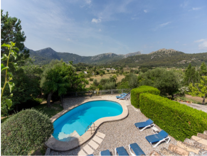
Piscina bien cuidada