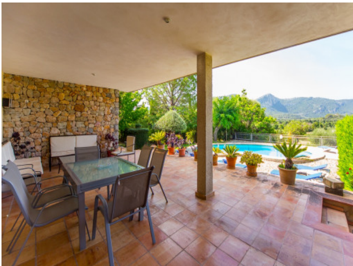
Vistas desde la terraza a la piscina