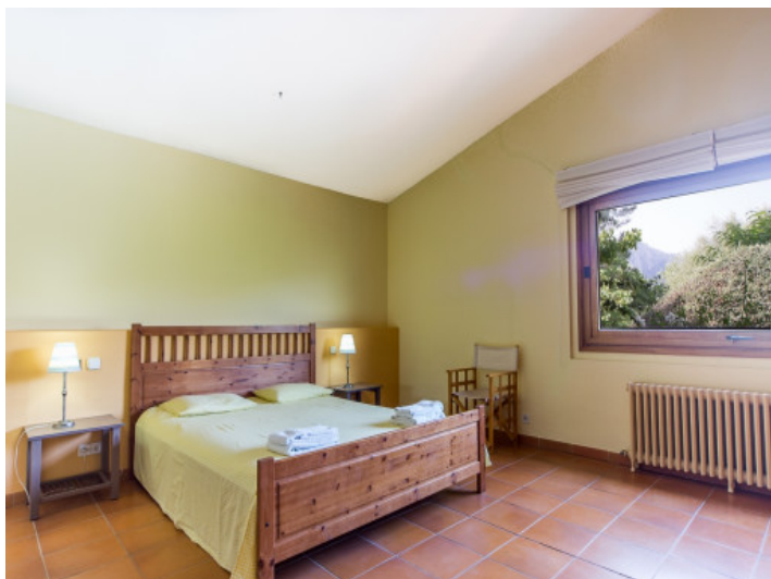
Dormitorio con calefacción