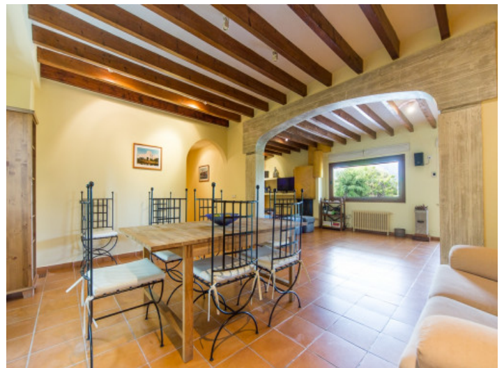
Salón y comedor abierto

Toda la información como mejor se puede saber, salvo por error durante el periodo de venta. Sirva este documento como un informe previo, las bases legales solo serán válidas a través de un contrato de compra acordado ante Notario.