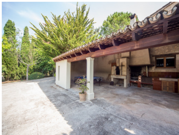
Terraza cubierta con barbacoa