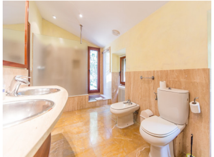
Baño con bañera y luz natural