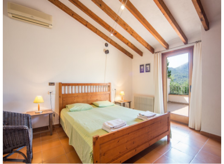
Dormitorio con balcón