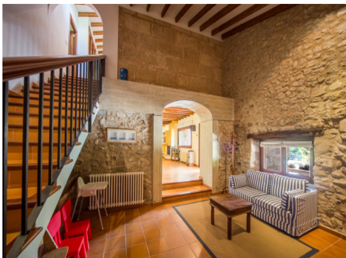
Área de estar en el corredor