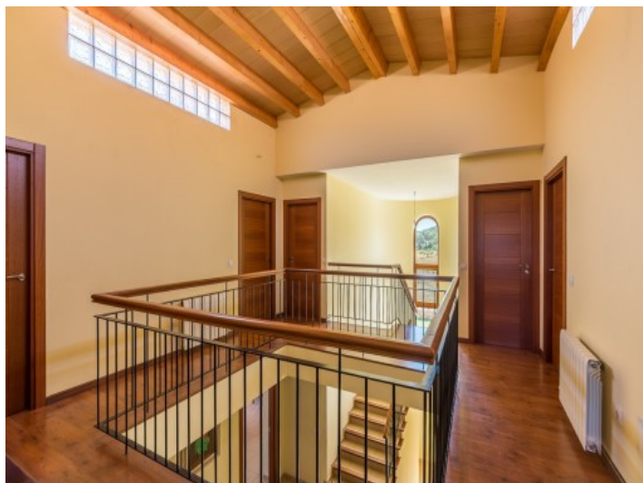
Galería en la planta arriba