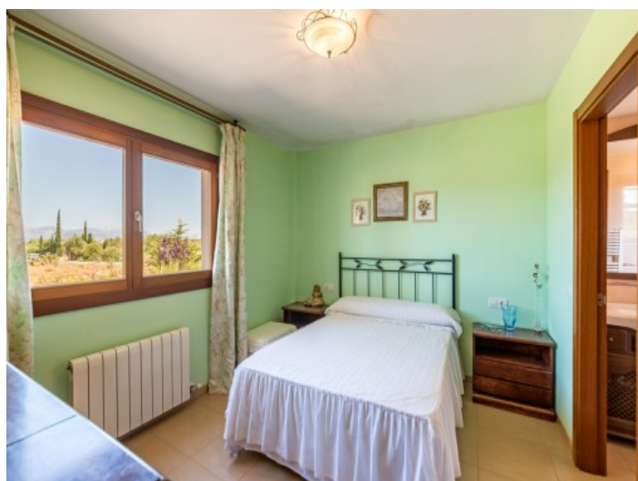
Dormitorio con calefacción

Toda la información como mejor se puede saber, salvo por error durante el periodo de venta. Sirva este documento como un informe previo, las bases legales solo serán válidas a través de un contrato de compra acordado ante Notario.