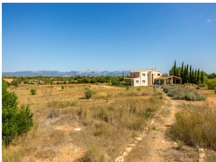
Vistas sobre el terreno de la finca