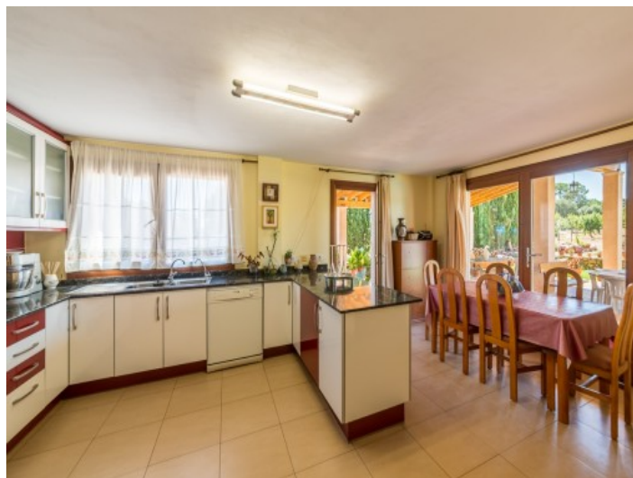
Cocina total equipada