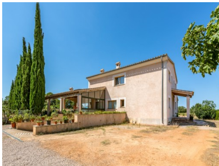
Vistas delante de la finca