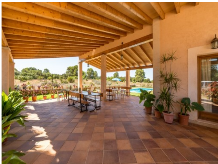
Terraza cubierta con comedor