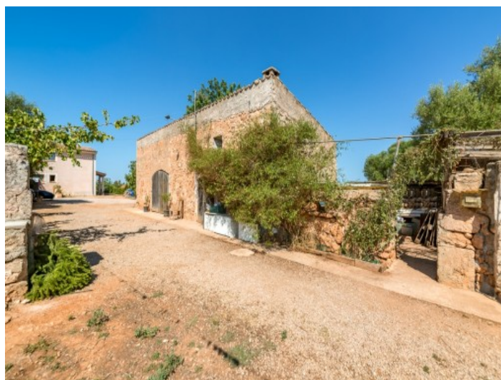
Terreno amplio de la finca