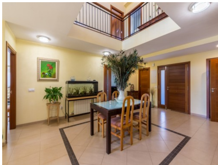
Comedor con galería