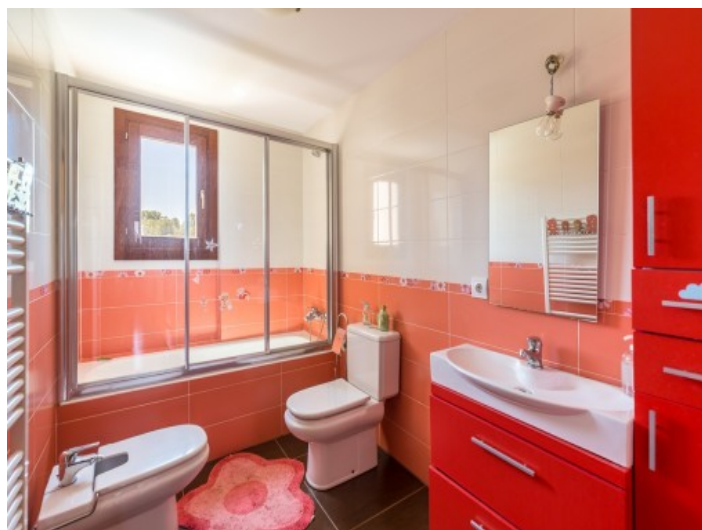
Baño con bañera

Toda la información como mejor se puede saber, salvo por error durante el periodo de venta. Sirva este documento como un informe previo, las bases legales solo serán válidas a través de un contrato de compra acordado ante Notario.