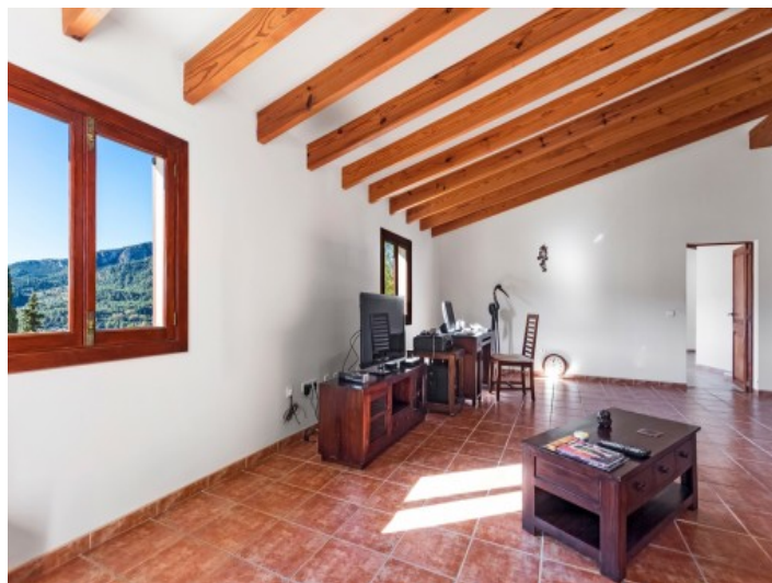
Área de estar espacioso