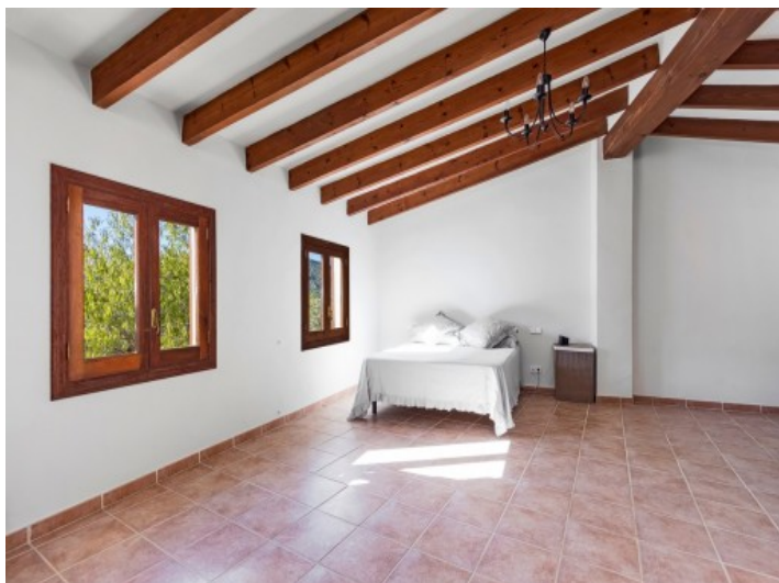
Extenso dormitorio principal