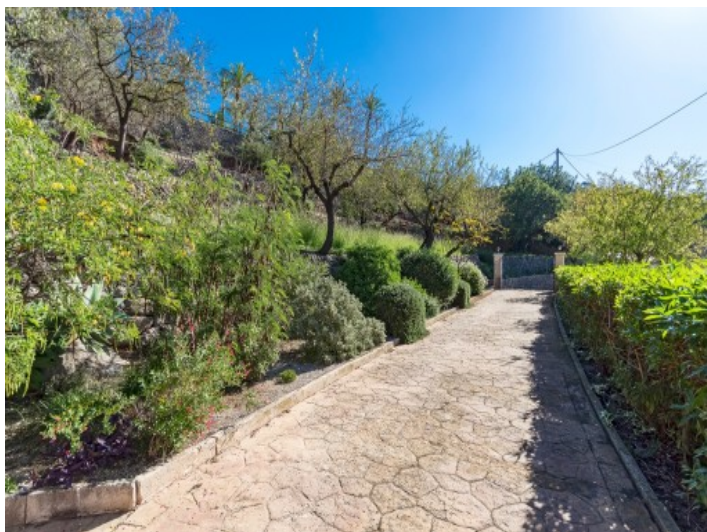
Subida a la finca