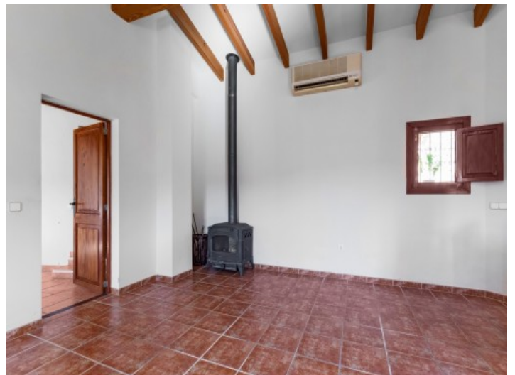
Chimenea en la casa de invitados

Toda la información como mejor se puede saber, salvo por error durante el periodo de venta. Sirva este documento como un informe previo, las bases legales solo serán válidas a través de un contrato de compra acordado ante Notario.