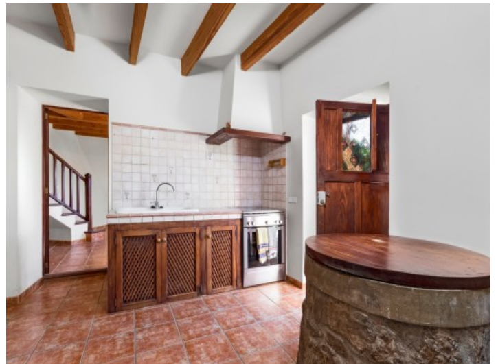
Cocina rústica en la casa de invitados