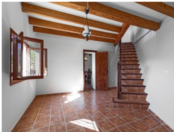
La casa de invitados tiene 2 plantas