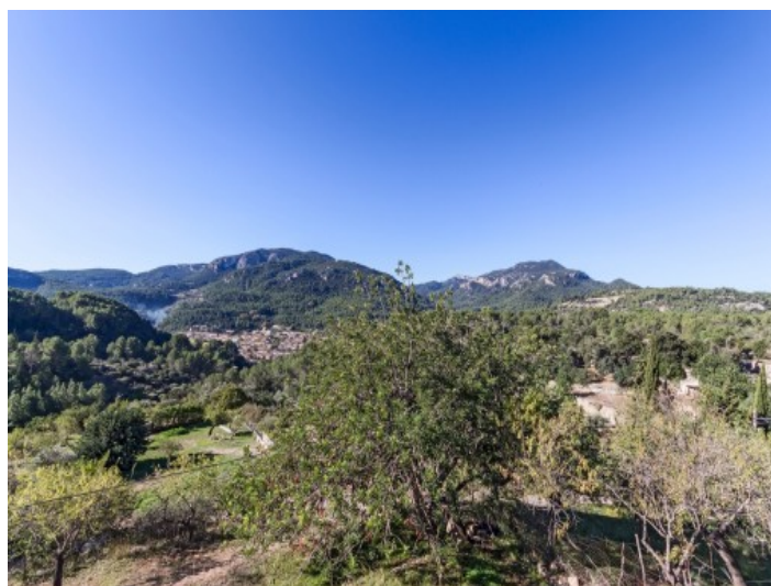
Vistas preciosas a la Tramuntana

Toda la información como mejor se puede saber, salvo por error durante el periodo de venta. Sirva este documento como un informe previo, las bases legales solo serán válidas a través de un contrato de compra acordado ante Notario.