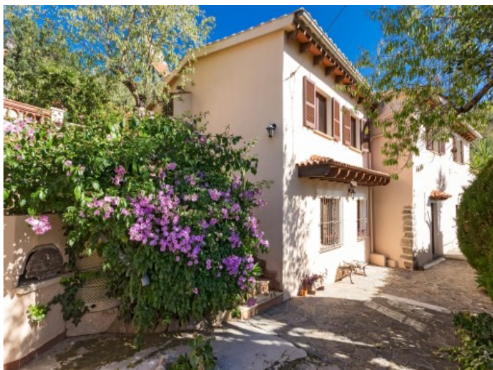
Vistas exteriores de la casa principal