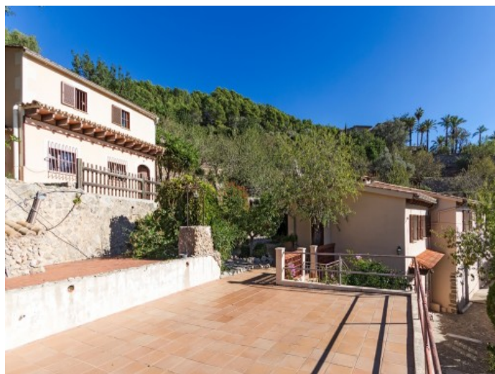
Vistas de la terraza, de la casa de invitados y de la casa principal

Toda la información como mejor se puede saber, salvo por error durante el periodo de venta. Sirva este documento como un informe previo, las bases legales solo serán válidas a través de un contrato de compra acordado ante Notario.