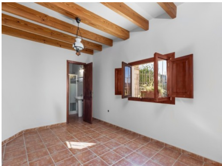
Acceso del dormitorio al baño