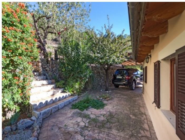
Aparcamiento y entrada