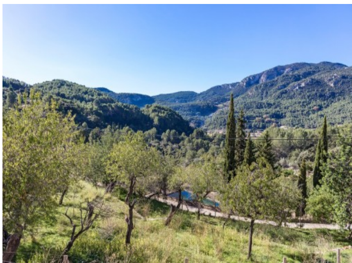
La finca está rodeada de naturaleza