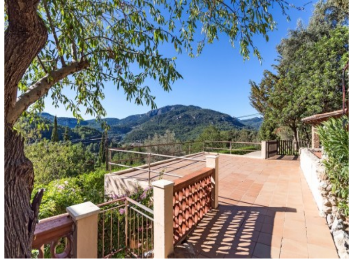
Terraza soleada con fantásticas vistas al campo