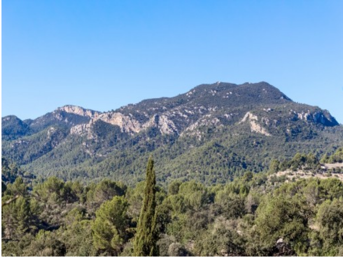
Impresionantes vistas a las montañas