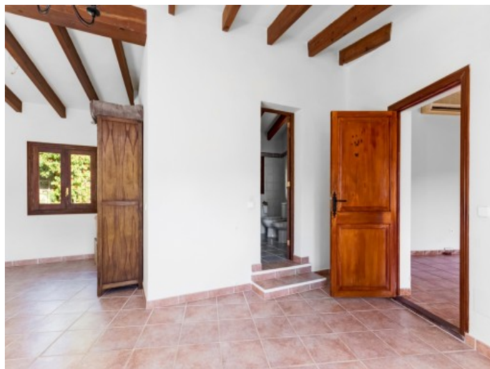
Dormitorio principal con baño en suite