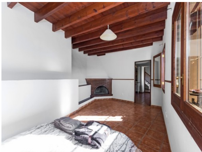
Dormitorio de huéspedes con chimenea