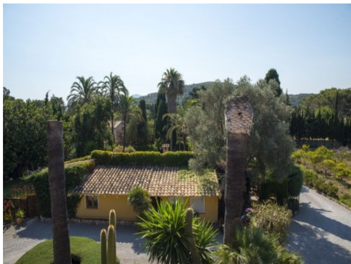
Vistas desde la terraza