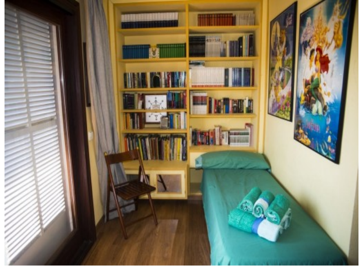
Dormitorio de huéspedes con cama alta práctica