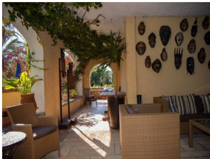
2 casas separadas ofrecen espacio para huéspedes