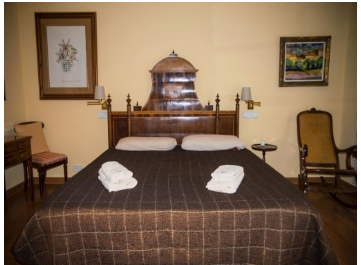
La cocina ofrece mucho espacio para la despensa