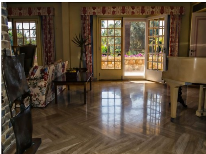
Pequeña biblioteca con sillones