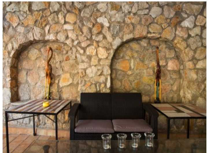
Decoración interior extravagante