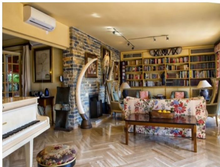
Buenas vistas desde el balcón