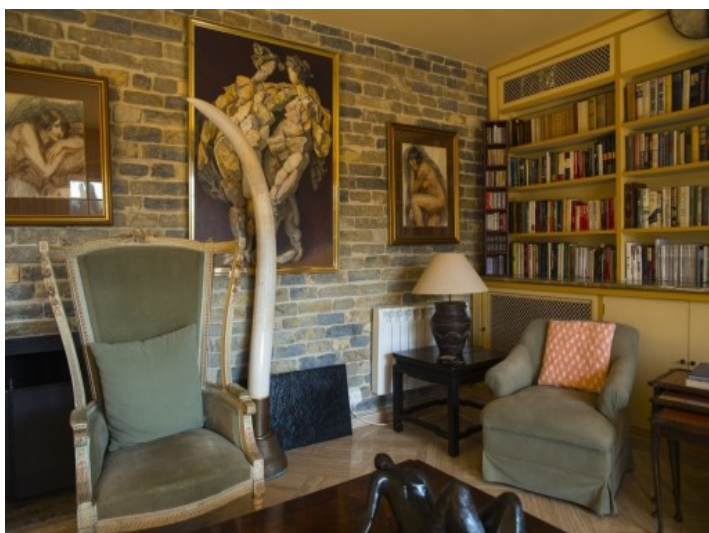
Área de estar con chimenea