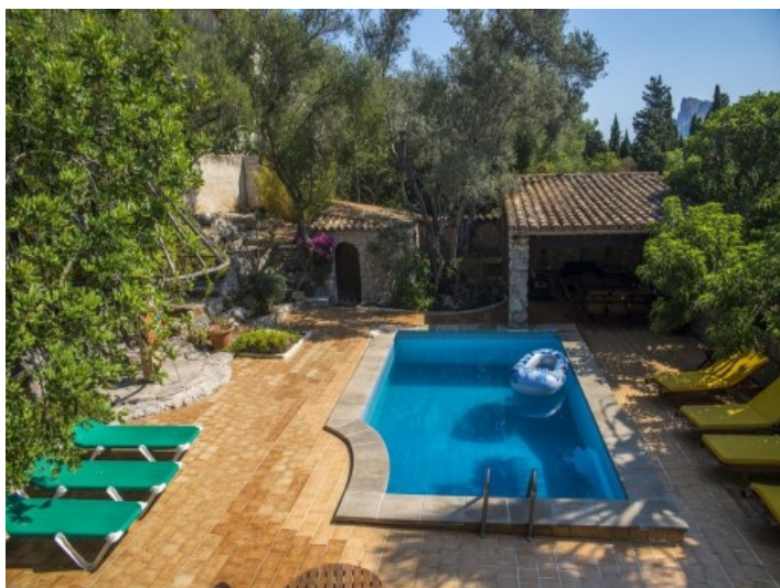
Área de piscina principal de la finca