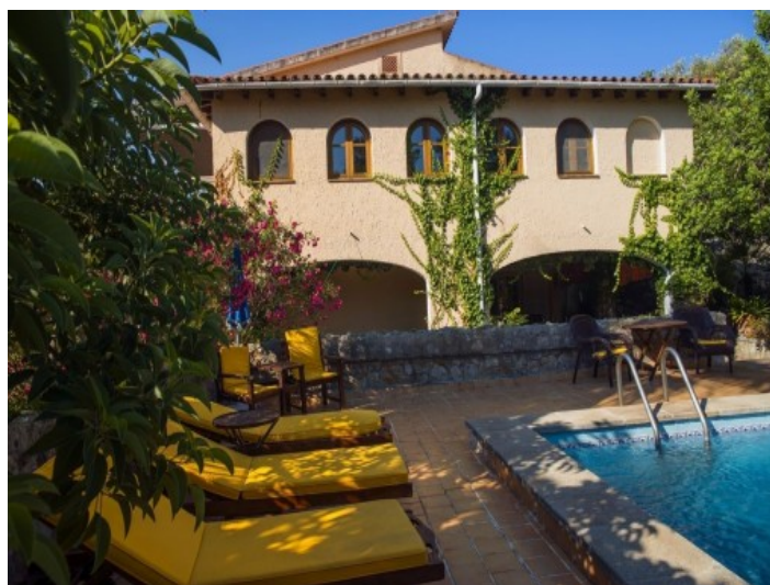
Área de barbacoa al lado de la piscina