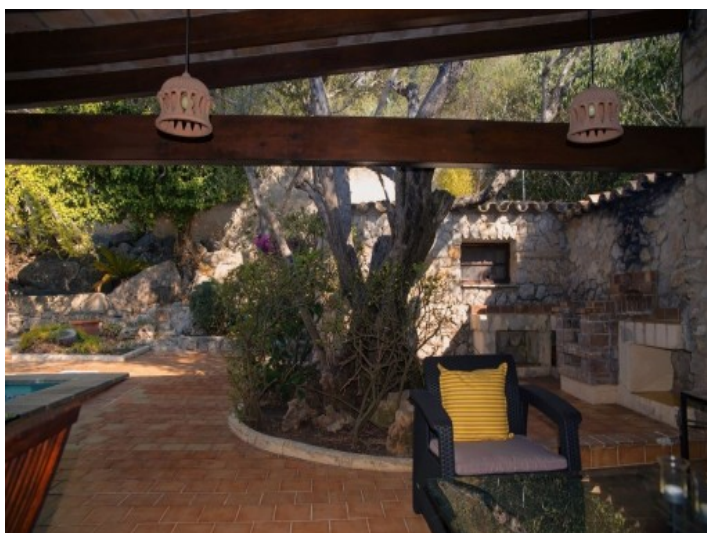
La propiedad está rodeada de la naturaleza