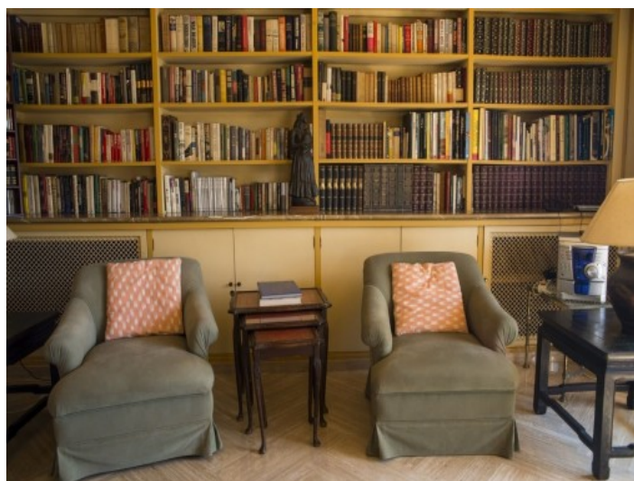
Una pared de piedra natural decora la zona de estar