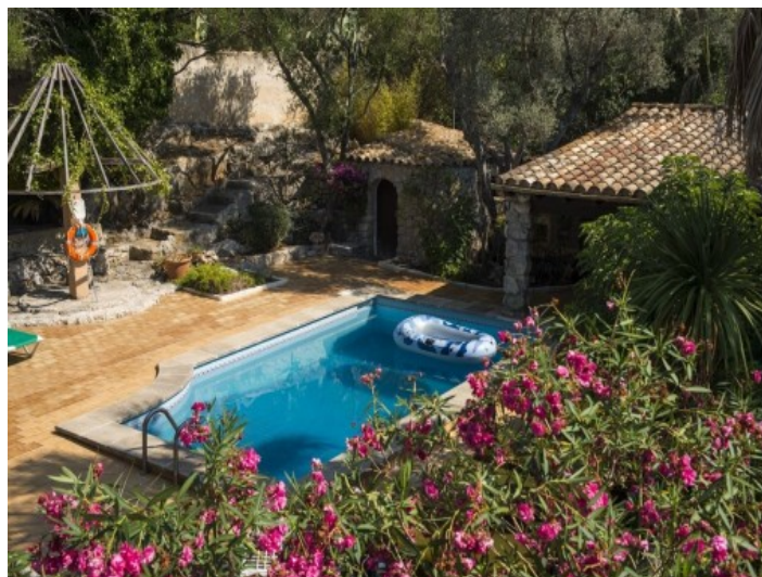
Casa de huéspedes separada de la finca