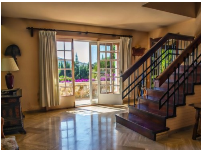
La finca ofrece varios áreas de estar