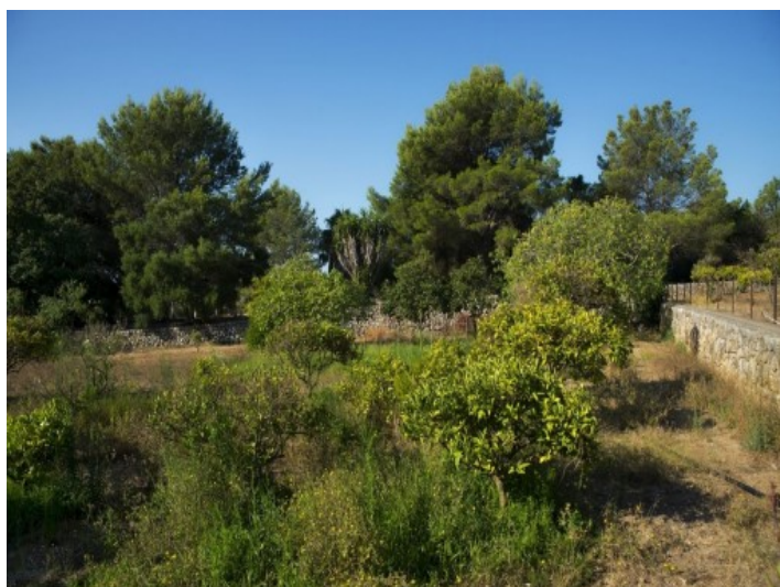
Vistas de la casa y área de la piscina