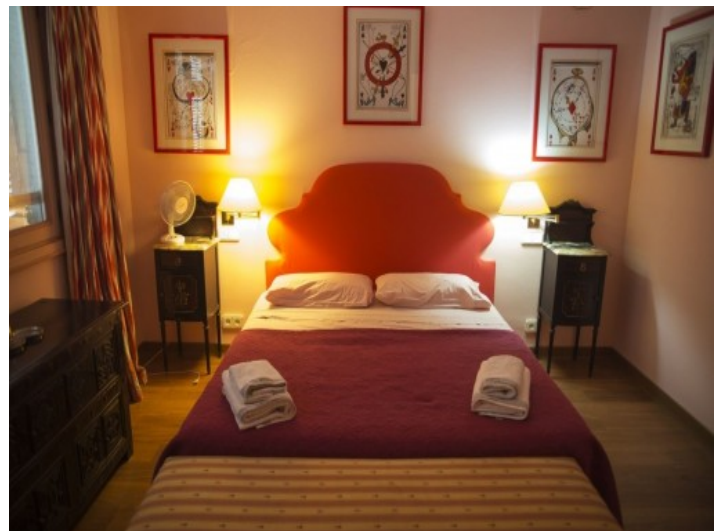
La propiedad ofrece 6 dormitorios

Toda la información como mejor se puede saber, salvo por error durante el periodo de venta. Sirva este documento como un informe previo, las bases legales solo serán válidas a través de un contrato de compra acordado ante Notario.