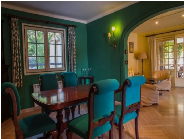
Zona de estar en verde