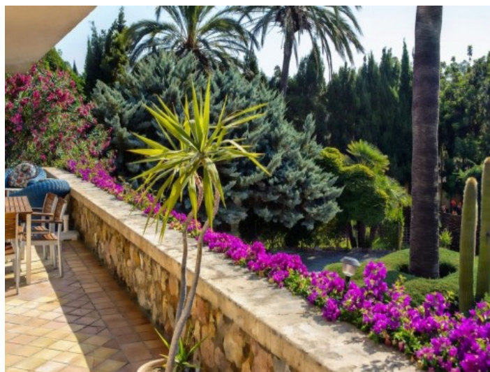
Hamacas atractivas en el área de piscina

Toda la información como mejor se puede saber, salvo por error durante el periodo de venta. Sirva este documento como un informe previo, las bases legales solo serán válidas a través de un contrato de compra acordado ante Notario.