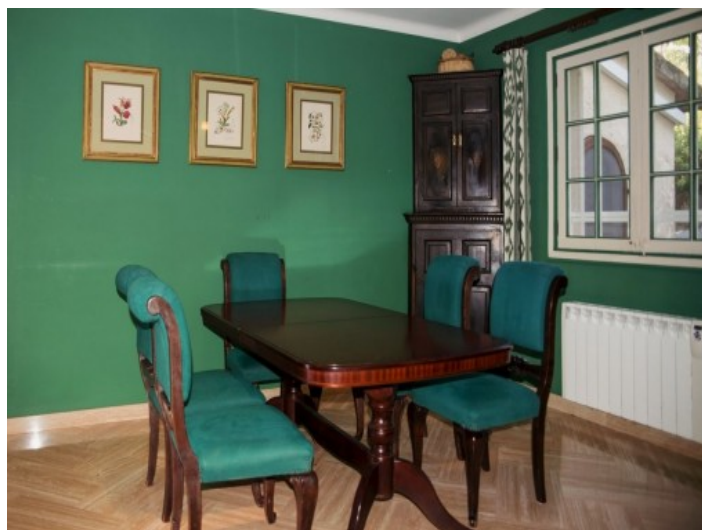
Acceso a la terraza

Toda la información como mejor se puede saber, salvo por error durante el periodo de venta. Sirva este documento como un informe previo, las bases legales solo serán válidas a través de un contrato de compra acordado ante Notario.