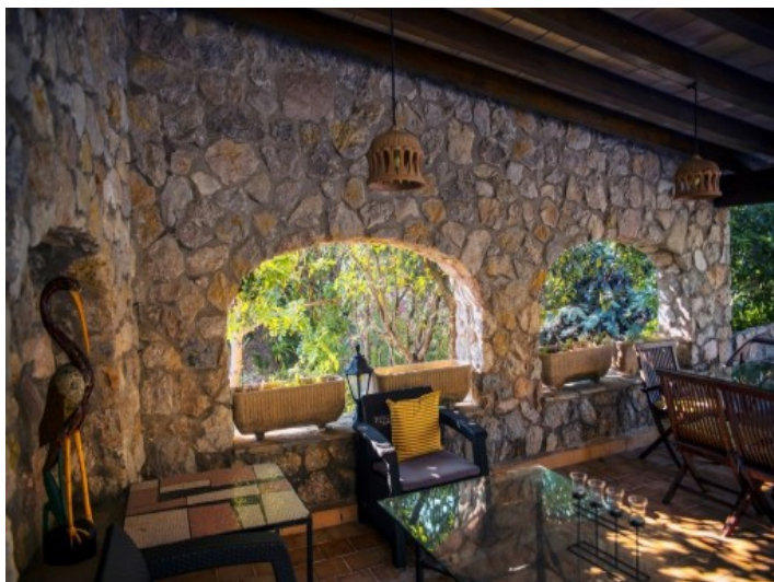
Zona de chill-out cubierta