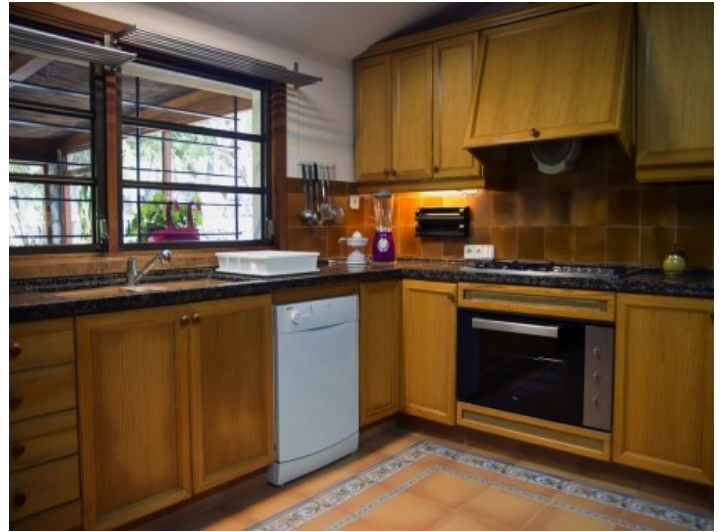
Vistas alternativas de la zona de estar