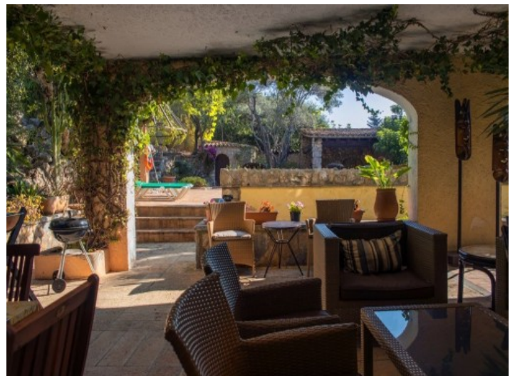
Las escaleras que dan acceso a los dormitorios

Toda la información como mejor se puede saber, salvo por error durante el periodo de venta. Sirva este documento como un informe previo, las bases legales solo serán válidas a través de un contrato de compra acordado ante Notario.