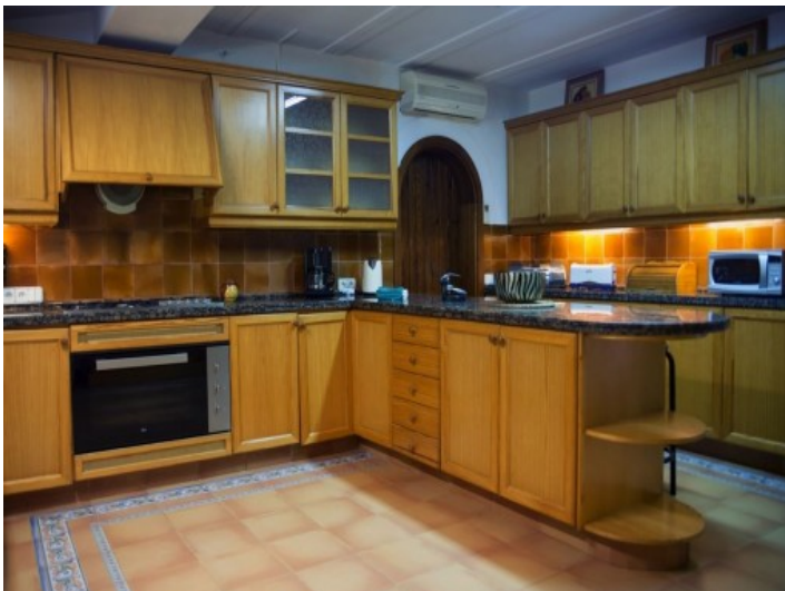
Cocina totalmente equipada