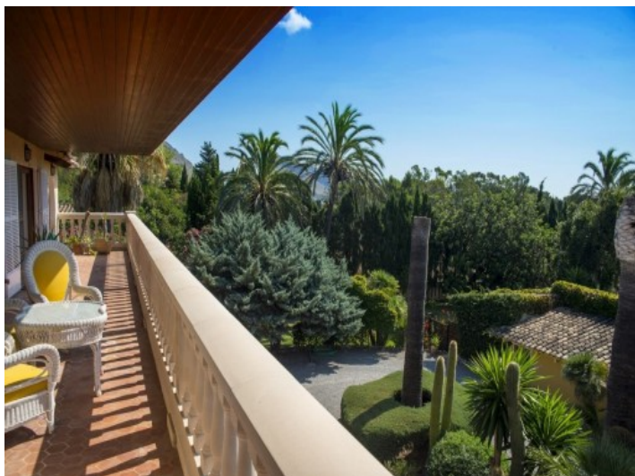
Camino de entrada larga de la propiedad