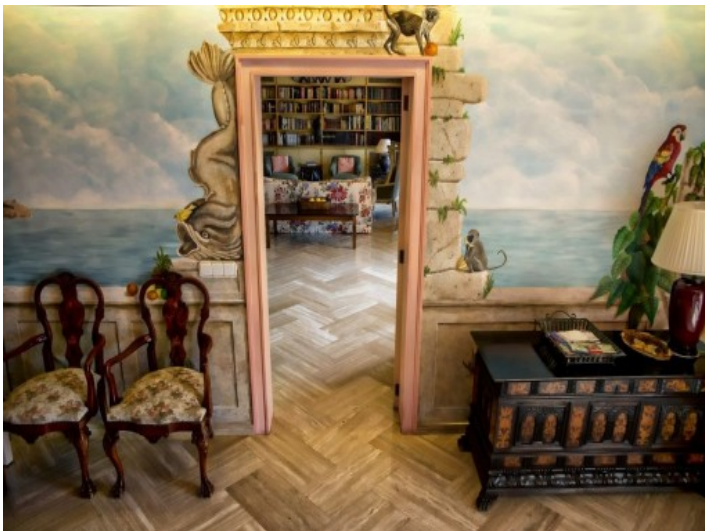
Vistas alternativas del dormitorio de huéspedes