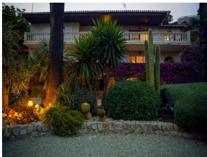
Jardín de la propiedad