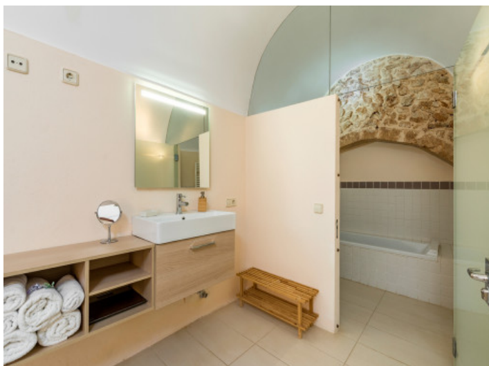
Uno de 2 baños