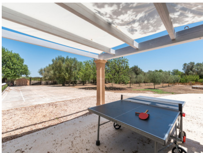
Área exterior con muchas posibilidades