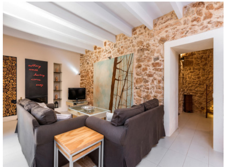
Agradable área de estar