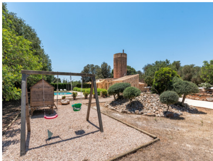
Área exterior con amplio espacio