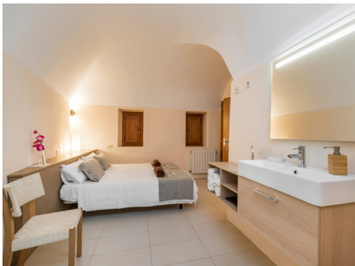
Uno de 3 dormitorios modernos