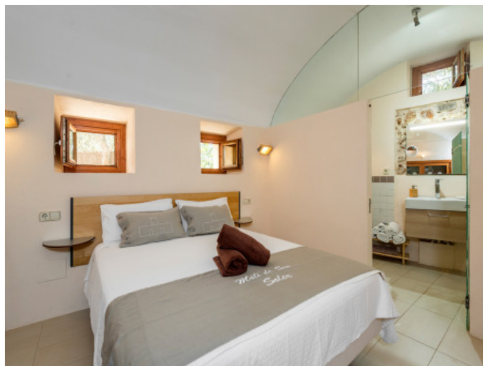
Dormitorio con baño en suite