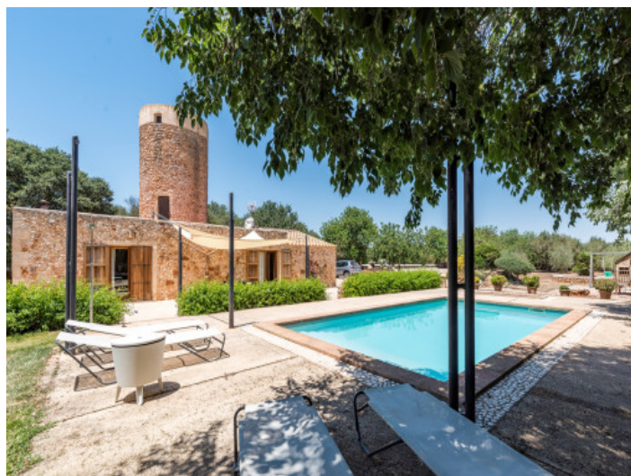
Área de piscina con privacidad absoluta

Toda la información como mejor se puede saber, salvo por error durante el periodo de venta. Sirva este documento como un informe previo, las bases legales solo serán válidas a través de un contrato de compra acordado ante Notario.