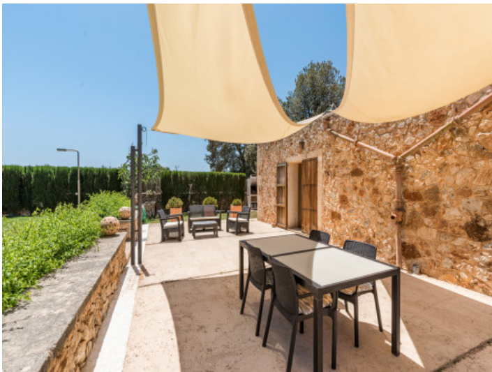
Encantador comedor en la terraza