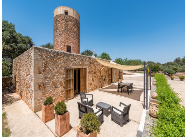
Vista exterior de la finca de piedra