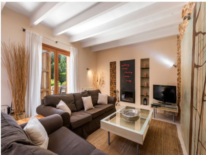
El área de estar ofrece una chimenea