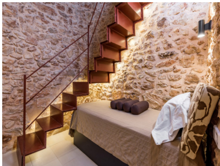
Dormitorio con auténtica pared de piedra