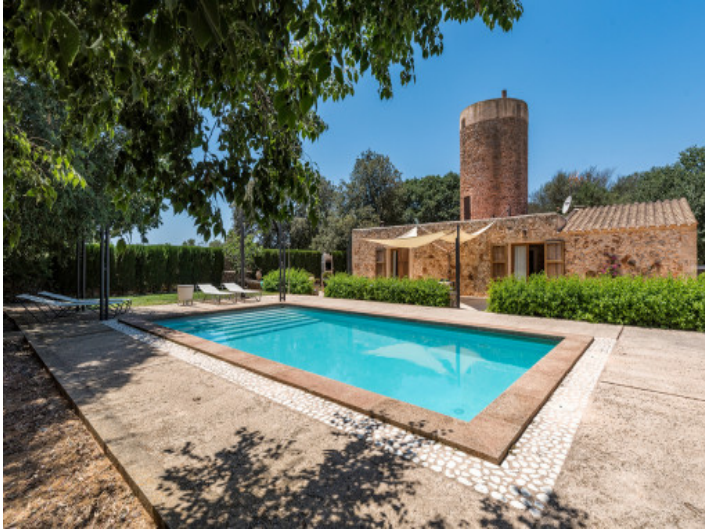
Área de piscina bien cuidada