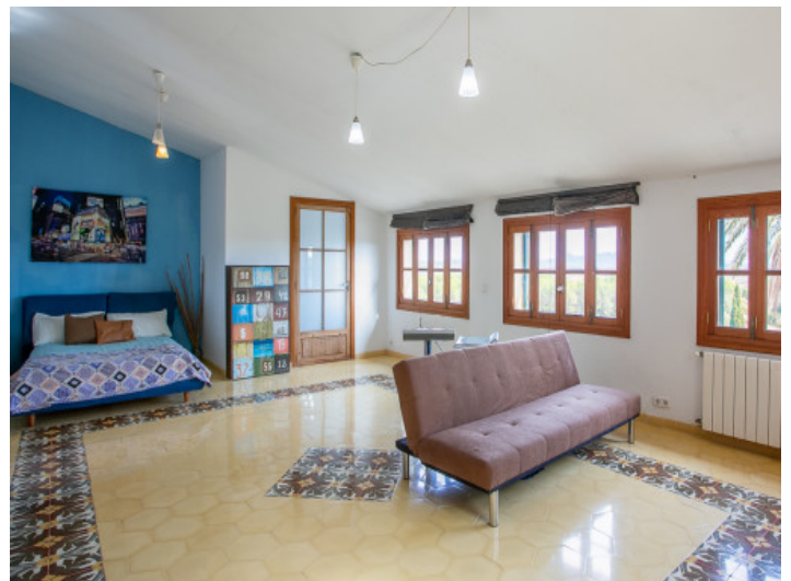
Amplio dormitorio en el piso superior

Toda la información como mejor se puede saber, salvo por error durante el periodo de venta. Sirva este documento como un informe previo, las bases legales solo serán válidas a través de un contrato de compra acordado ante Notario.