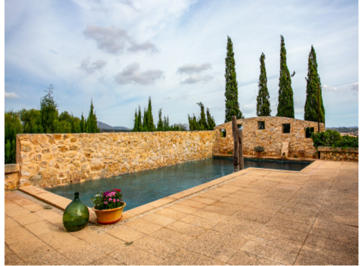
Piscina muy privada