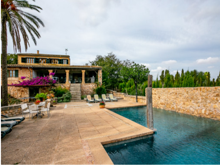
Preciosa área de terraza y piscina