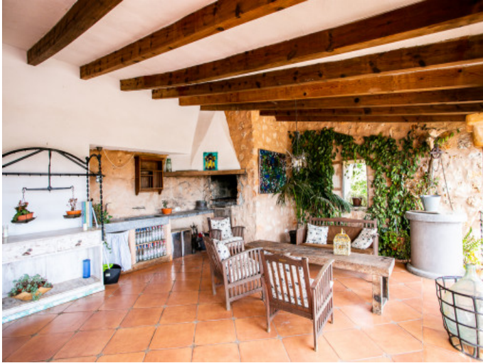
Gran terraza cubierta con barbacoa