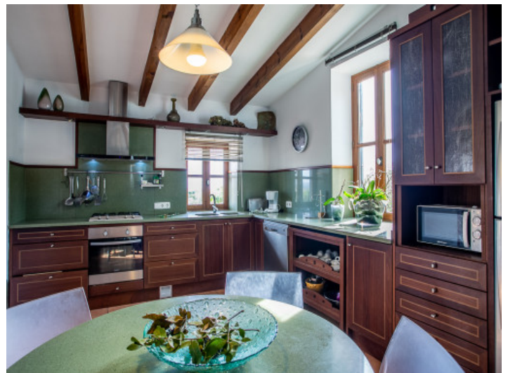
Cocina estupenda con comedor

Toda la información como mejor se puede saber, salvo por error durante el periodo de venta. Sirva este documento como un informe previo, las bases legales solo serán válidas a través de un contrato de compra acordado ante Notario.