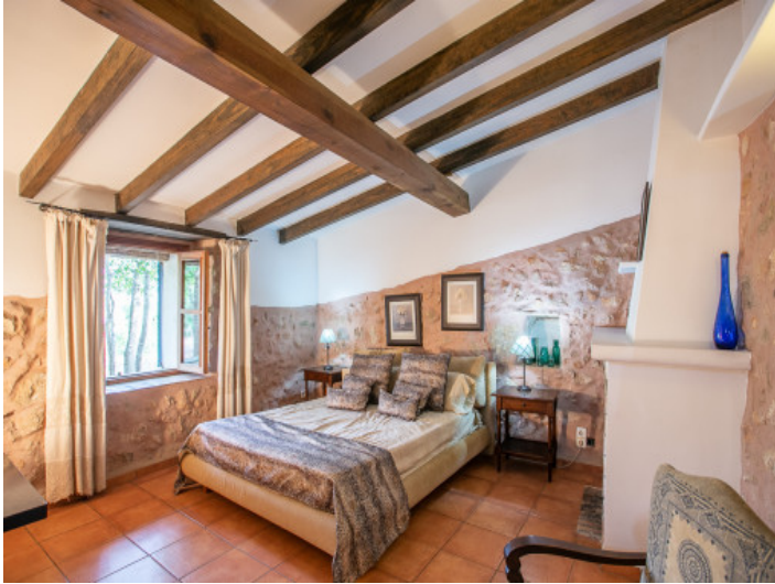
Dormitorio auténtico con pared de piedra arenisca