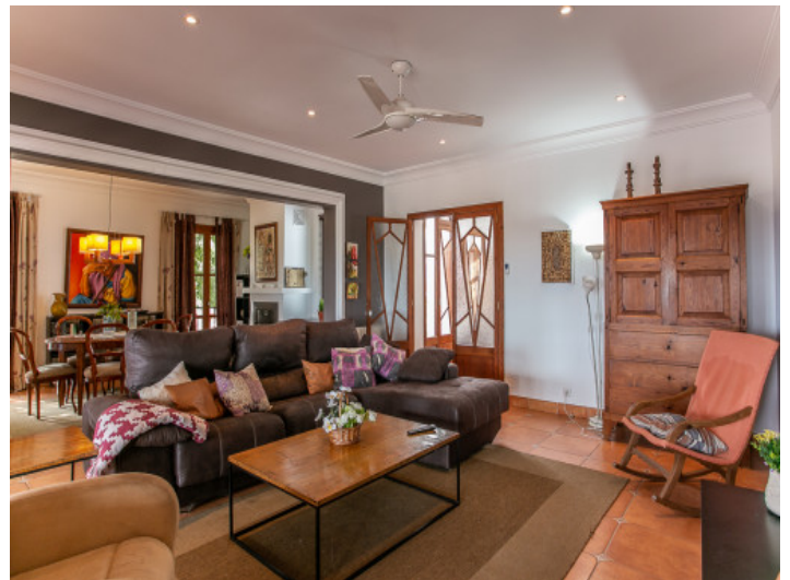
Salón-comedor en estilo abierto