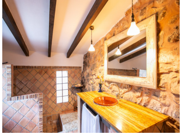
Baño con encanto