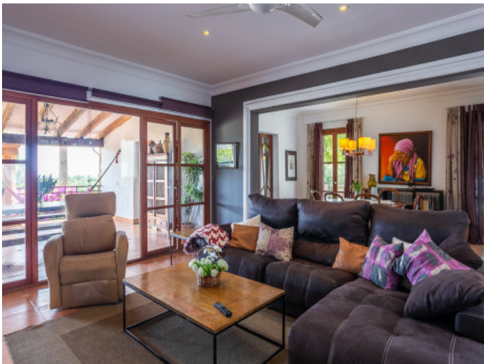
Salón con acceso directo a la terraza