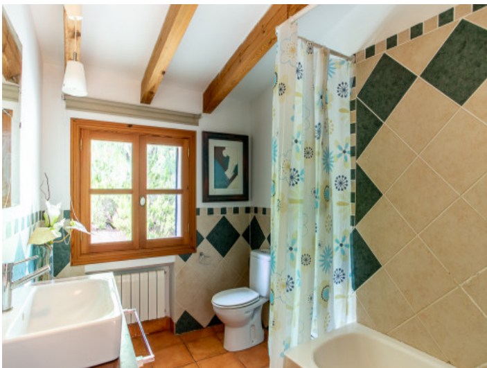
Uno de 3 baños