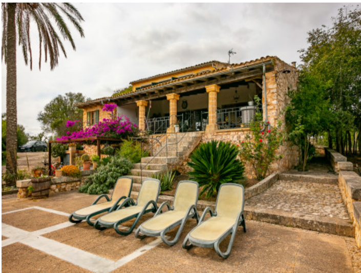
Espaciosa terraza soleada