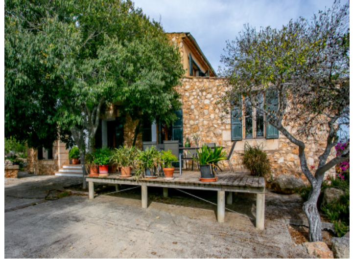
Idílica terraza delantera