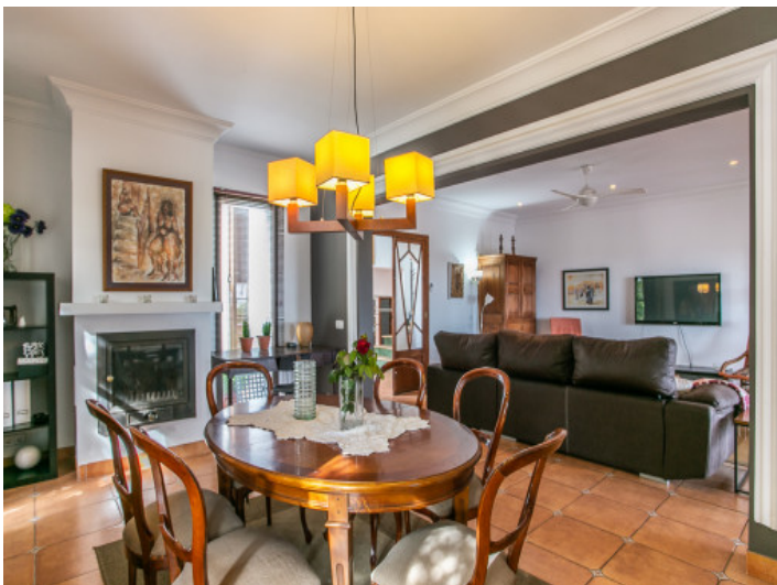
Comedor bonito con chimenea