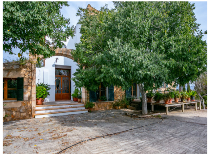
Acceso a la finca