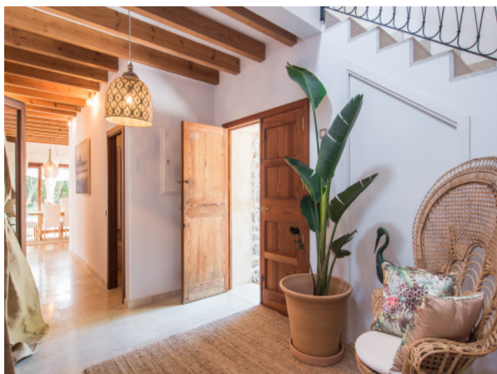
Villa excepcional con piscina y licencia de alquileres cerca del campo de golf Pula