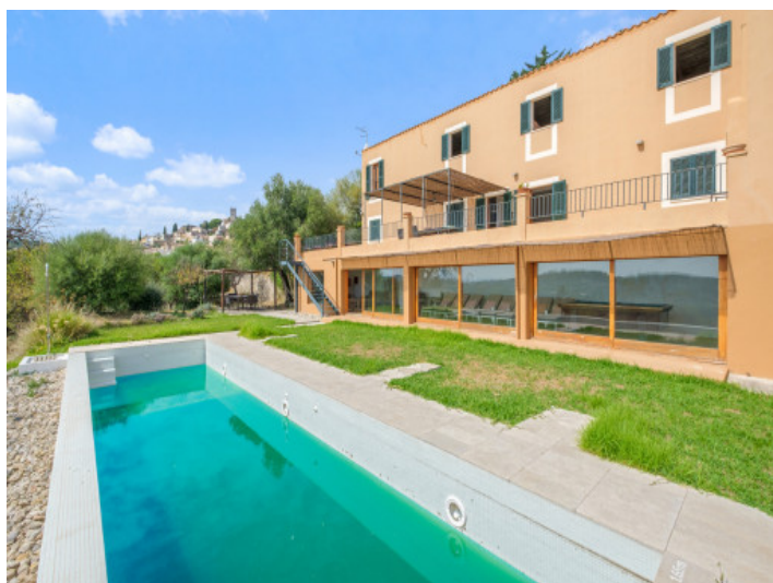
Vista exterior y piscina