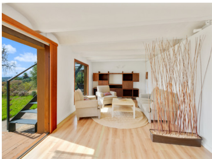
Zona de estar