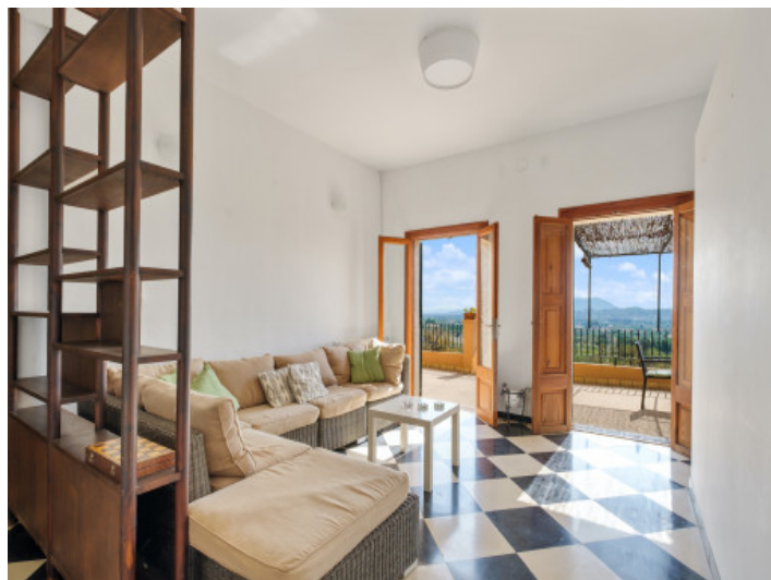
Área de estar