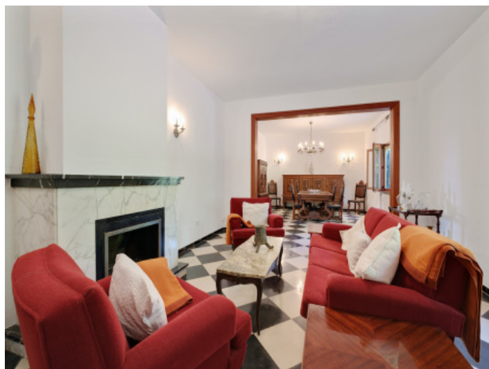
Área de estar

Toda la información como mejor se puede saber, salvo por error durante el periodo de venta. Sirva este documento como un informe previo, las bases legales solo serán válidas a través de un contrato de compra acordado ante Notario.