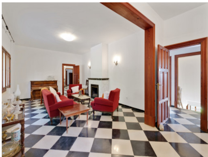
Área de estar