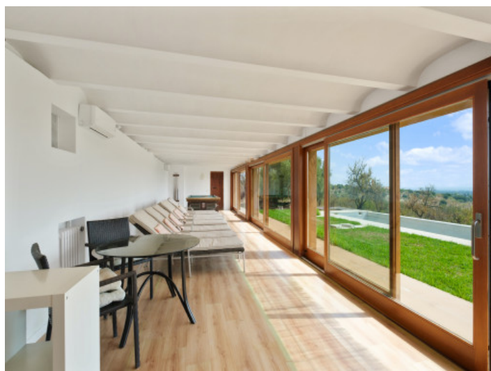
Área de spa